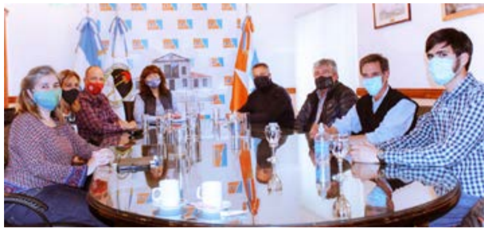
Junto al titular del INFUETUR Dante Querciali, la Presidente del Poder Legislativo, vicegobernadora Mónica Urquiza, se reunió con propietarios de establecimientos productivos ubicados en la ruta "A" de cabo San Pablo.

Los propietarios de la zona, mostraron su preocupación por el estado actual de San Pablo y la posibilidad de intrusamientos en la ruta para lo cual "es imprescindible