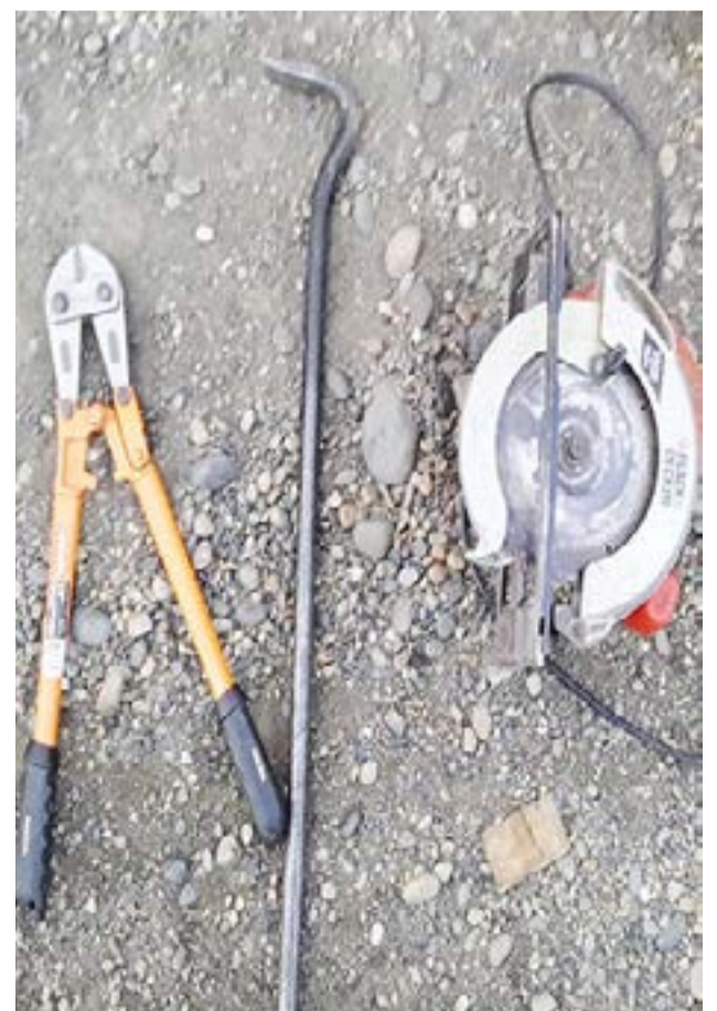
Recuperan herramientas tras un allanamiento en margen sur

una sierra circular de las mismas características que la denunciada, una barreta y una tijera de corte. Al cierre de esta edición, seguía en curso la medida judicial.