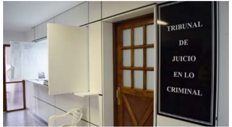
Tribunal de Juicio del Distrito Judicial Sur aplicó una pena ejemplar a sujeto acusado de abuso sexual de una niña. El hombre deberá cumplir 20 años de prisión.