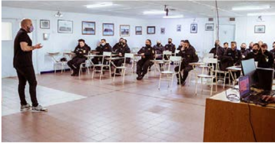
Autoridades policiales de toda la provincia recibieron capacitación en Género y Disidencias

Al finalizar la funcionaria remarcó que "este tipo de capacitaciones son importantes porque nos permiten garantizar derechos en temas tan importantes como la ley de identidad y el Trato Digno, por ejemplo, a la hora de tomar los datos en un trámite, respetando la identidad autopercibida de las personas como dicta la Ley".