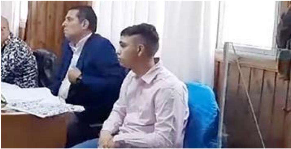
Sujeto que protagonizó una seguidilla de hechos violentos, entre ellos el ataque a su ex pareja, enfrenta al Tribunal de Juicio Oral de Río Grande.