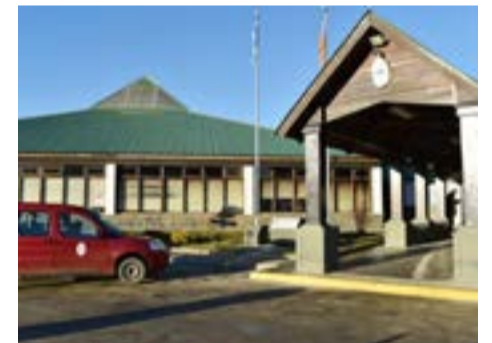
Este lunes, en Ushuaia, comienza juicio contra un hombre acusado de abuso sexual.

Para la audiencia de debate está prevista la presencia de 2 de testigos.