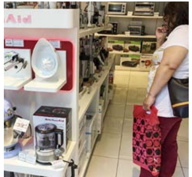
Las ventas minoristas registraron un alza del 9% interanual.

"No hay ninguna decisión estratégica de retirarse del país y eso lo sabe bien Guzmán. Si aparecen diferencias en nuestras tenencias tiene que ver con algún pedido puntual de un cliente, pero es difícil evaluar nuestra tenencia, pues algunas están bajo custodia, por lo cual no es comparable, y en la pantalla de Bloomberg no aparecen bien todos", es la respuesta que suelen dar cuando algún funcionario los señala con el dedo acusador.