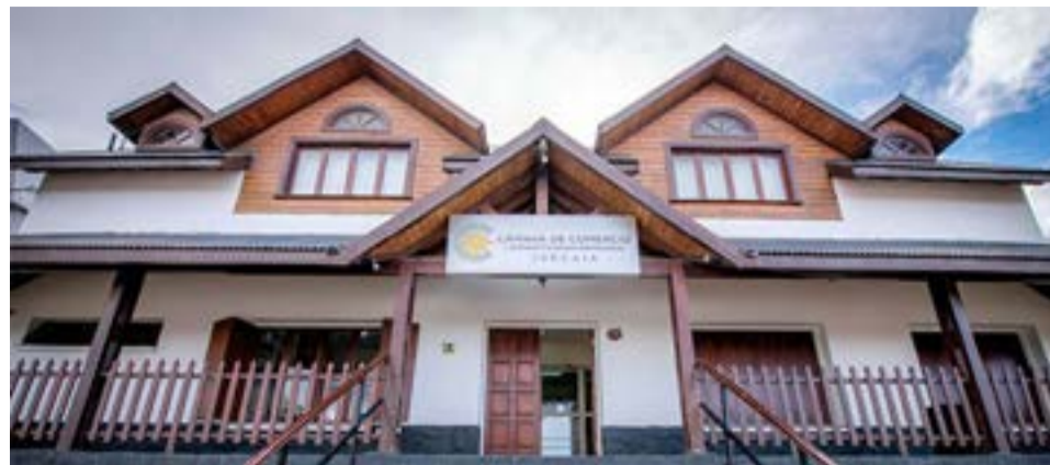
La Cámara de Comercio y otras Actividades Empresarias de Ushuaia manifestó su creciente preocupación “ante el explosivo y acelerado crecimiento de la venta ilegal en espacios públicos y cerrados en el ámbito de la ciudad de Ushuaia”.

“Es por eso, que el avance de esta actividad al margen de la ley que ya se ha re-