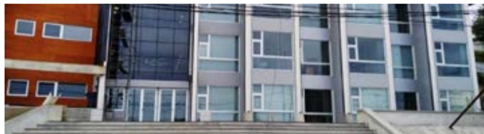
La capacitación obligatoria para aspirantes al Registro del Poder Judicial se pospuso para el 15 de noviembre.

Quienes deseen realizar consultas, pueden contactarse al mail consultasaspirantes@justierradelfuego.gov.ar