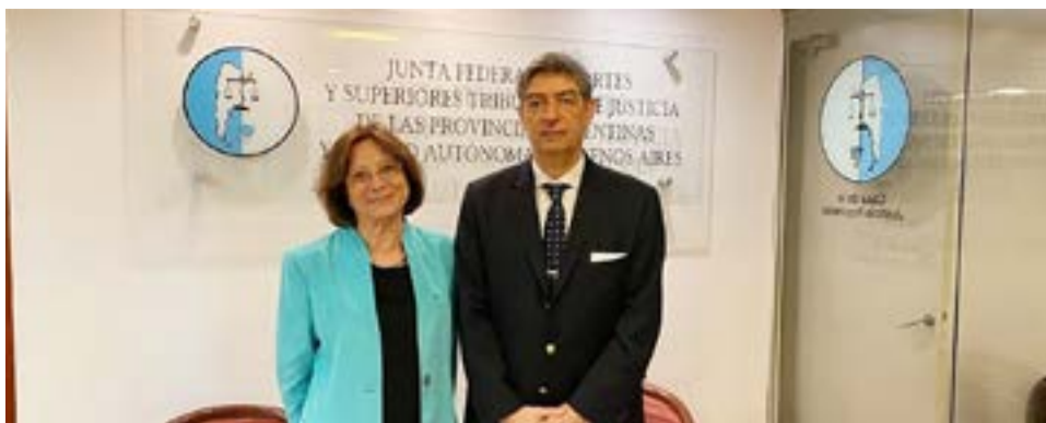
Jueces provinciales recibieron al presidente de la Corte Suprema, el Doctor Horacio Rosatti.