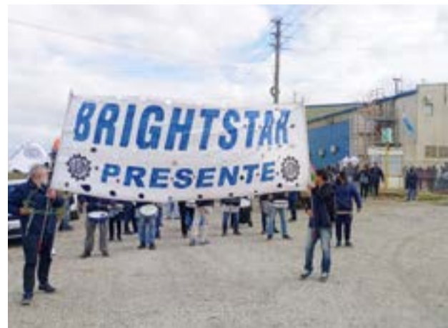
Trabajadores y trabajadoras de Brightstar, el viernes pasado en el último día de trabajo antes del comienzo de las vacaciones anticipadas impuestas por la empresa que comienzan hoy, se manifestaron sobre la ruta nacional 3 frente a la planta fabril.

resto de las familias que dependen de nuestro trabajo”. Se referían a “la famosa cadena o efectos colaterales”, pidiendo después en la nota “a todos los involucrados, en las discusiones que se están llevando adelante, que extremen los esfuerzos para asegurarnos nuestros puestos de trabajo y continuidad laboral”. El operario siguió leyendo y luego manifestó: “nosotros, desde nuestro lado, no vamos a abandonar la lucha. Estamos convencidos que la ciudad, la unidad de los trabajadores y la voluntad política, nos ayudarán a solucionar el conflicto”. Pera terminar expresando: “vamos a seguir más fortalecidos que nunca, la lucha recién empieza”, advirtió el trabajador metalúrgico en el texto leído ante los manifestantes. Vale mencionar que, el sábado por la mañana, también se manifestaron sobre la ruta nacional 3 trabajadores y trabajadoras de Digital Fueguina, en este caso para pedir que se concrete el postergado fásón que vienen esperando desde hace meses y para solicitar una solución de fondo frente a la incertidumbre que tienen respecto de la fuente laboral.