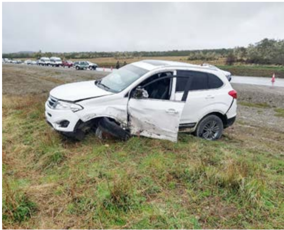
Colisión frontal sobre la ruta 3 dejó a dos personas hospitalizadas.