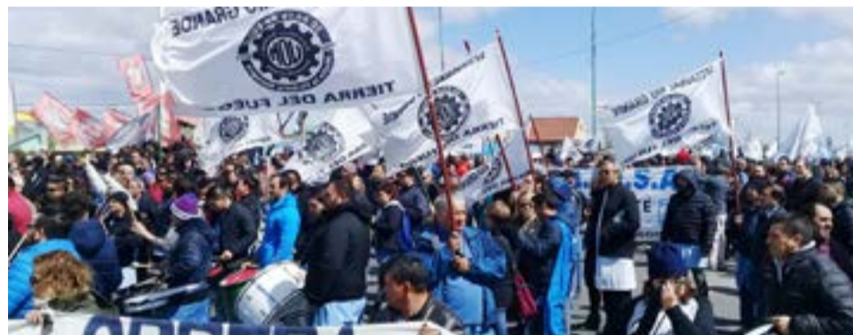
En el marco de la conciliación obligatoria impuesta por el Ministerio de Trabajo de la Nación, la UOM Seccional Río Grande acordó una suma no remunerativa de 20 mil pesos, a cobrarse antes del cuarto día de diciembre y un incremento del 15% desde el 1° de enero.

arribaron a un acuerdo, que consiste en 20 mil pesos no remunerativos a pagarse el cuarto día hábil de diciembre para todos los trabajadores y trabajadoras que trabajaron durante el mes de noviembre y un 15% a partir del 1° de enero del 2022. Vale destacar que el acuerdo fue aprobado por las asambleas de las distintas plantas, por amplia mayoría. De esta manera los operarios y operarias de las fábricas del sector obtuvieron un 50% de recomposición, en los últimos diez meses. Con