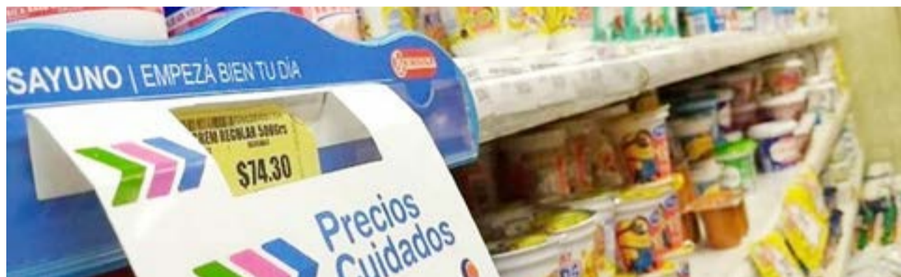
La brecha del dólar alcanza máximos de 2020. El diferencial entre el contado con liquidación libre y el tipo de cambio oficial se ubica en 116% y, salvo por lo que sucedió en algunas pocas ruedas de octubre de 2020, se trata de la brecha más alta en 30 años en la Argentina.

Si bien desde el Gobierno dicen que Pimco se portó mejor que Templeton, en base a la cartera de bonos que vendió uno y otro, desde Templeton le hicieron saber al ministro de Economía, Martín Guzmán que ellos buscan establecer vínculos de colaboración con los gobiernos de