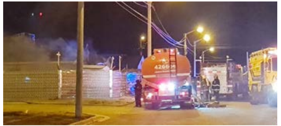
Fueron dos las viviendas afectadas por completo en Halcón Colorado al 2300 de Chacra XI y otras dos, se vieron afectadas.

Ya en horas de la mañana de este jueves, personal de la División Bomberos reali-