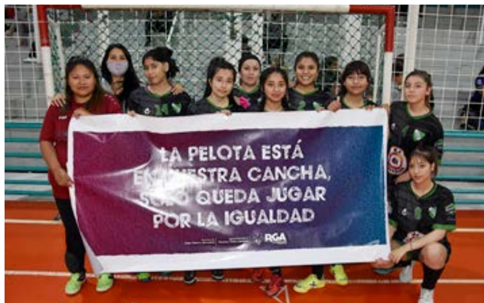
El equipo de San Francisco, categoría libre.