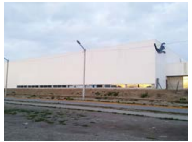
“Estamos avanzando en cuestiones específicas que tiene que ver con el convenio con el Gobierno nacional. Es importante que quede todo prolijamente ordenado ya que nos encontramos con un expediente que tenía muchas cosas que resolver y luego cerrar con la empresa que colaboró muchísimos con nosotros”, dijo con respecto al nuevo natatorio ubicado en Av. San Martín.