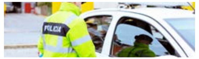
Una joven de 28 años fue encontrada sin vida en una vivienda del barrio Perón. Se presume suicidio.

Las primeras versiones indican que la muerte es por asfixia, mientras personal policial realiza las pericias necesarias a fin descartar cualquier indicio de criminalidad.