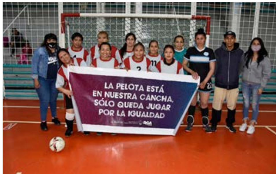
El equipo de DPO CBA, categoría libre