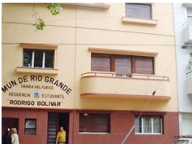
“Estamos hablando de una casa histórica que se encuentran en un sector muy lindo y la reestructuración es muy importante. Le va a dar la posibilidad a los estudiantes que están en La Plata y que requieran de un apoyo de distintos tipos”.

Aclaró que “no cumple el rol de residencia, pero sí un espacio que nuclea a los estudiantes para que reciban apoyo desde el Municipio y puedan realizar actividades dentro del espacio. La idea es que sea un lugar de encuentro también y para nosotros es muy importante su