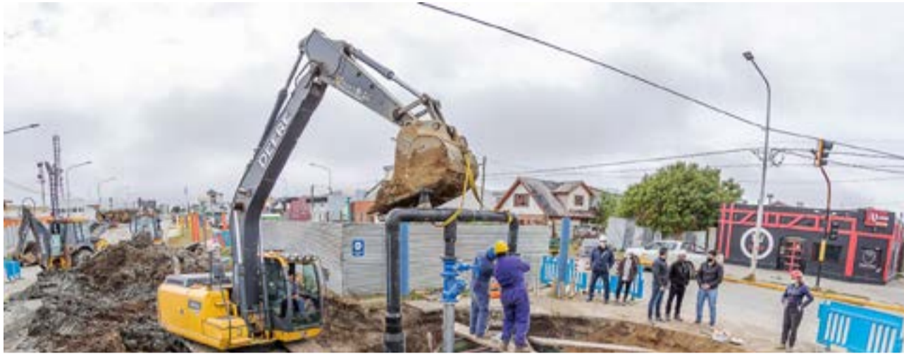
La funcionaria municipal se refirió a las diversas obras que “no se hacían hace más de 30 años y tienen que ver con todos los servicios que están bajo tierra” tanto en el casco viejo como así también en otras zonas de la ciudad.

principal Eva Perón, informó que “ya venimos trabajando con una empresa que está pronta a iniciar los trabajos. Con este viento es imposible trabajar en la altura y ese es el principal problema que tuvimos estos últimos días.