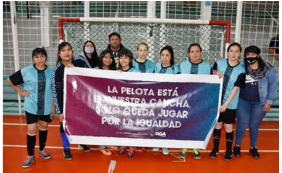
El equipo de Las Fluor, categoría libre.

jugadora está aplicando en el campo de juego, que si bien el evento ese participativo, vienen demostrando en estas dos fechas una alta competitividad y con la firme convicción de que si es posible el desarrollar estos campeonatos por la eficacia en su despliegue y la enorme cantidad de damas que también aman esta disciplina deportiva, e indicando por sobre