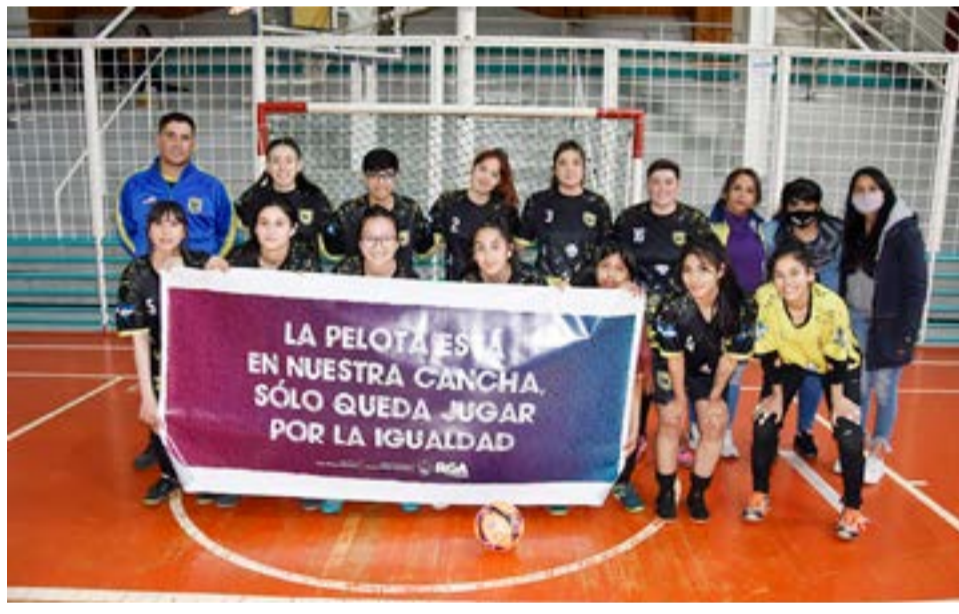
El equipo de Real Madrid, categoría libre.

de Real Madrid vs. Las Fluor, O'Higgins frente a San Francisco y cerrando la jornada Sol Naciente que jugó con DEPO CBA para esta instancia y completar así la primera fase con los restantes equipos que faltan enfrentarse. Destacando además desde la organización el muy buen nivel y el excelente desempeño que cada