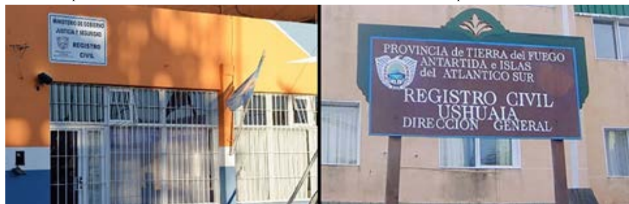
“Durante los dos últimos fines de semana de febrero y los primeros fines de semana del mes de marzo vamos a estar realizando los días sábados de 9 a 14 horas en las dependencias centrales de los registro civiles de la provincia operativos de identificación”, dijo la funcionaria provincial.

Por último dijo que “el registro de nacimientos va disminuyendo año a año, pero tiene que ver también con variables de población que se están viendo tanto a nivel nacional como mundial”.