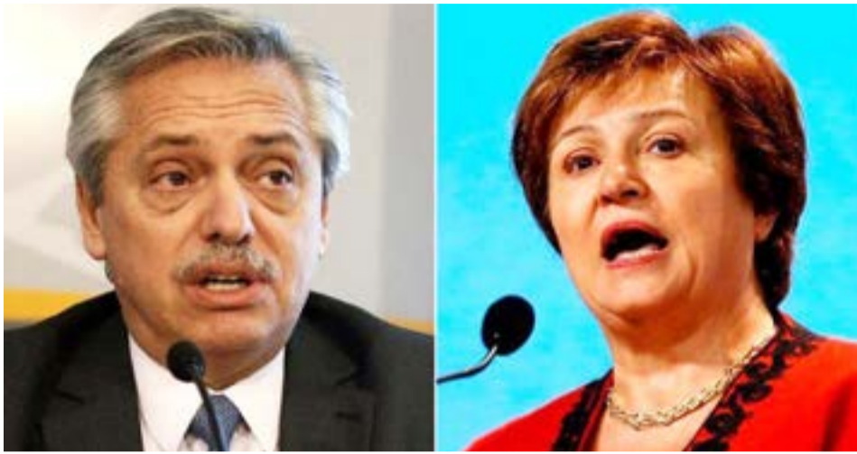
En la Casa Rosada se percibía un clima de satisfacción por el resultado de la reunión con el Directorio de Fondo Monetario Internacional y si bien no lo quieren decir en on the record, tienen la expectativa de que el acuerdo pueda cerrarse en los próximos días.

“el Board aprobó” y este paso es fundamental para que finalmente el gobierno argentino pueda firmar el acuerdo con el staff que da lugar a la Carta de Intención y el Memorándum de Entendimiento.