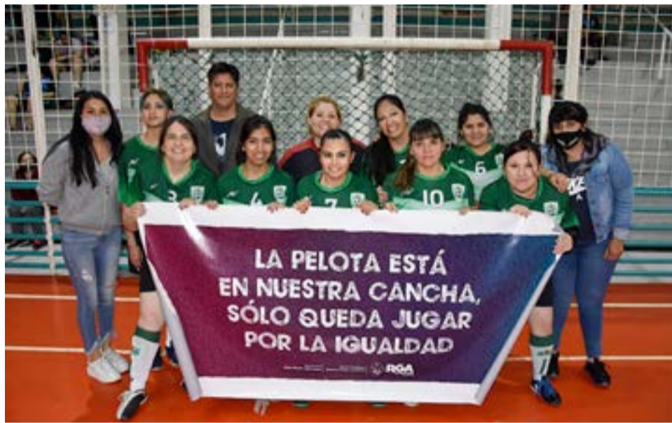
El equipo de Sol Naciente, categoría libre.