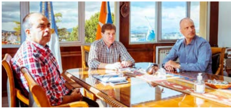
El gobernador Gustavo Melella mantuvo una reunión con el embajador de Argentina en Brasil, Daniel Scioli, a fin de coordinar diversas mesas de trabajo y avanzar en los sectores de turismo; pesca; logístico e hidrocarburos, entre otros, para potenciar las relaciones comerciales entre los distintos sectores.