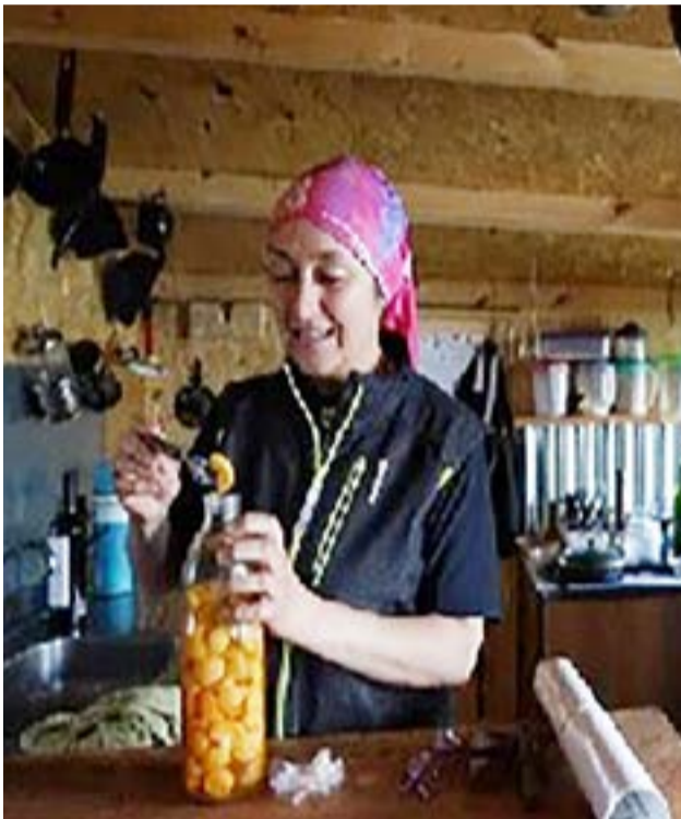
Una reserva de hongos de la zona, recogidos del bosque, conservados en aceite. Casi todo lo que come Diana lo consigue de la naturaleza, sea del mar o del bosque.

En el año 2016 el matrimonio de Diana con su marido