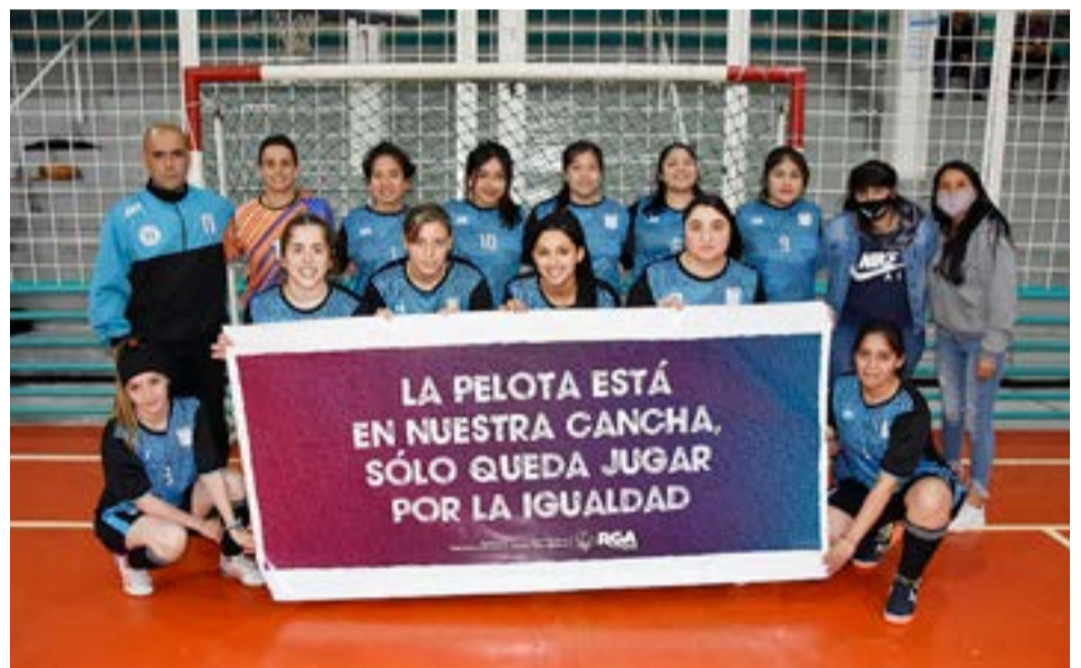
El equipo de O'Higgins, categoría libre.

todas las cosas que es viable el llegar a las ligas oficiales por la actitud y la aptitud que las totalidad de las chicas demuestran en todo momento que le es posible inter-