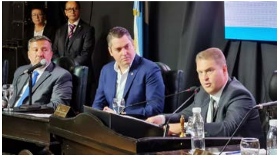
El presidente del Cuerpo de Concejales Raúl von der Thusen se dirigió hacia los presentes en su último discurso como edil de la ciudad.

En este sentido dijo que “el poder legislativo es el más democrático de los poderes, ya que todas las voces ciudadanas tienen su espacio y representación, por lo que en primer lugar es una gran satisfacción poder decir que cumplimos con la palabra empeñada allá por el año 2019 cuando asumimos esta responsabilidad, dado que al comenzar la gestión dividi-