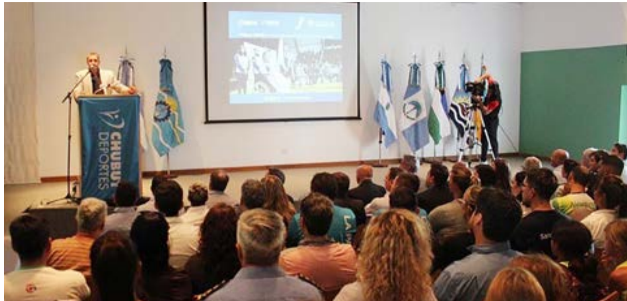
En la ciudad de Puerto Madryn se realizó el lanzamiento oficial de la segunda edición de los Juegos de la Integración Patagónica.

Comité Técnico asesor PCD, en donde hay presencia de autoridades fueguinas.