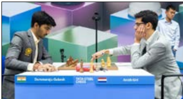
Con piezas Blancas Anish Giri en acción

El holandés Anish Giri se impuso en el grupo de maestros de la 85ª edición del Torneo Tata Steel Chess disputado en Wijk aan Zee, Países Bajos, del 14 al 29 de enero pasados, consiguió su primera victoria en el grupo principal de modo notable, invicto, con 8½ puntos sobre 13, venciendo en el camino al N.º 1 Magnus Carlsen y al N.º 2 del mundo, el chino Ding Liren. Giri destacó que este ha sido su "mejor resultado hasta ahora", y añadió que "es muy difícil tener un resultado mejor si exceptuamos el Campeonato del Mundo". Giri comentó que su meta para 2023 es el ajedrez clásico y clasificarse para el próximo torneo de Candidatos.