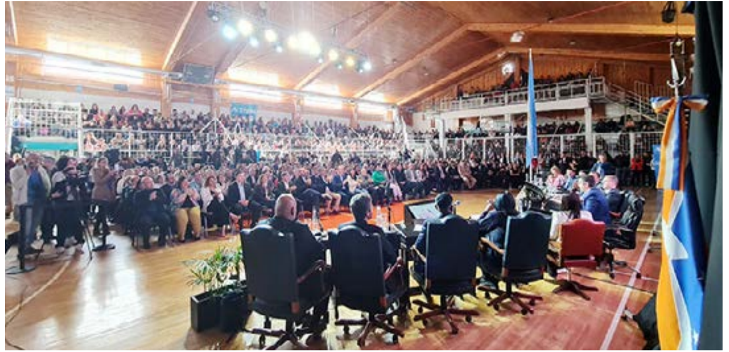
Con la presencia de funcionarios nacionales, provinciales, municipales, como así también autoridades de las fuerzas de seguridad, entidades civiles e instituciones intermedias.

Además, los programas “El mercado en tu barrio”, “Pan en tu mesa” y los descuentos en los corralones asociados al programa “Casa Propia” son acciones concretas para cuidar el poder adquisitivo de los vecinos.