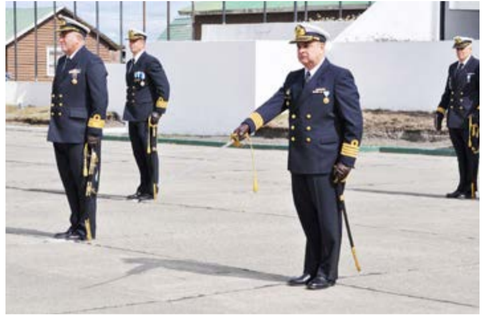
El Capitán de Navío de IM Héctor Antonio Herrera pidió a la formación, sable en mano, “subordinación y valor”, como primera acción ejerciendo de Comandante de la Fuerza de Infantería de Marina Austral.

Asimismo agradeció la colaboración y disposición del Comandante del Área Naval Austral, Contralmirante Walter Ernesto Doná, “quien nos abrió las puertas de