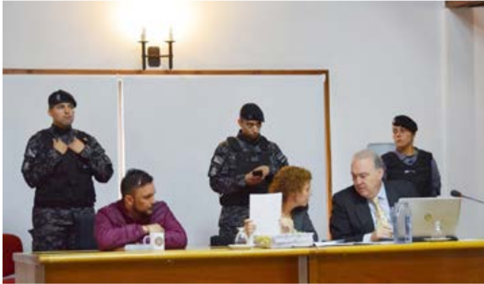
Este jueves son los alegatos en el juicio oral y público.

Respecto del hecho en el que se produjo el deceso de la víctima, adujo que por encontrarse “drogado, alcoholizado y empastillado” no recordaba nada. En tanto, manifestó que le colocó la sabana