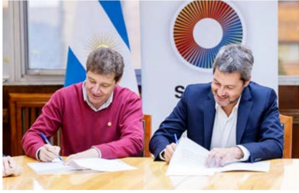
El Gobernador Gustavo Melella junto al ministro de Turismo y Deportes de la Nación, Matías Lammens, confirmaron la adhesión de Tierra del Fuego, Antártida e Islas del Atlántico Sur al programa La Ruta Natural que impulsa la promoción del turismo de naturaleza.

ma 50 Destinos con el que hemos hecho obras en más de 50 lugares del país y que la provincia lo ha aprovechado muy bien".