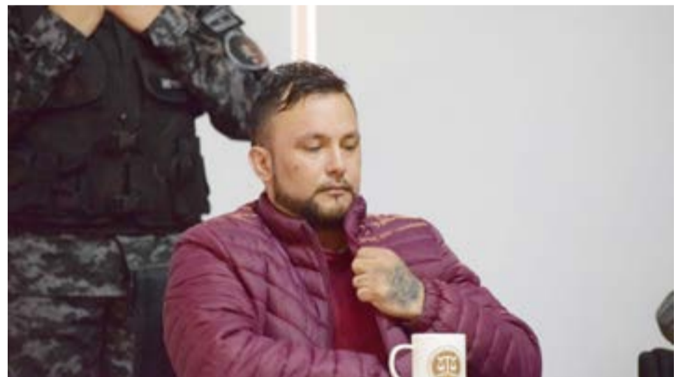
Lencina dijo que actuó “drogado, alcoholizado y empastillado”.