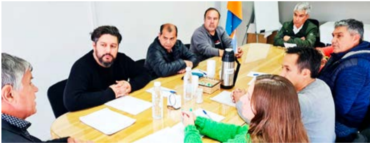
Este viernes a la tarde un grupo de comerciantes se reunió en la sede de la Cámara de Comercio, Industria y Producción, donde expusieron su malestar por las ferias y las ventas ilegales.

Coincidió con Salinas que “hay un comercio ilegal dentro de estas ferias, no vemos controles del Ministerio de Trabajo, ni de Bromatología ni del AREF por eso queremos saber si las autoridades del Colegio Don Bosco están al tanto de esta situación”.