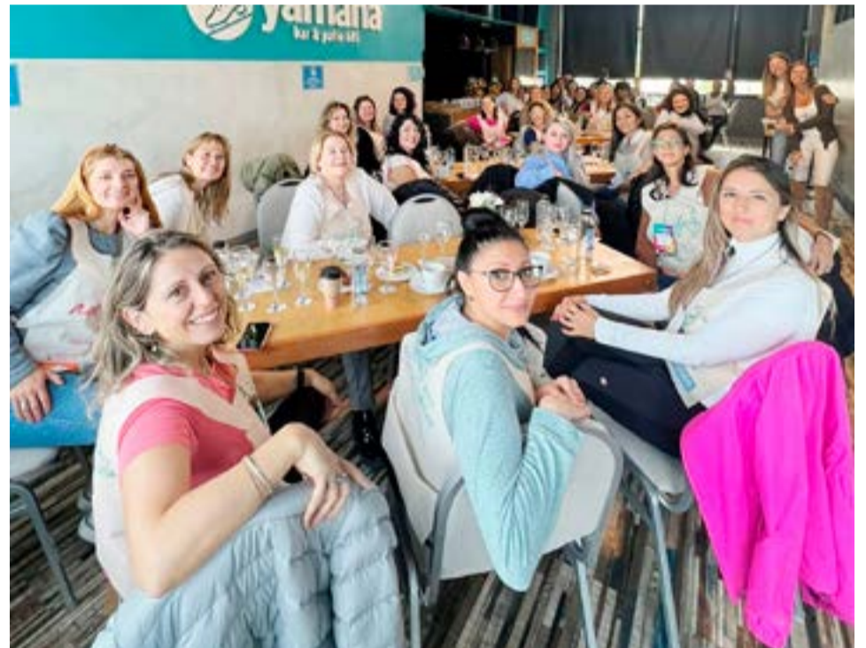
La Caminata de Mentoreo (“Global Mentoring Walk”) es un programa que conmemora el Día Internacional de la Mujer y busca resaltar la importancia del Liderazgo de las Mujeres, crear redes de apoyo y conexiones en sus comunidades, dar soporte y guía a las líderes emergentes para que cumplan sus metas y promover el mentoreo como estrategia de empoderamiento femenino, se realiza en 23 ciudades del cono sur y más de 180 países a la vez.

La Caminata de Mentoreo (“Global Mentoring Walk”) es un programa que conmemora el Día Internacional de la Mujer y busca resaltar la importancia del Liderazgo de las Mujeres, crear redes de apoyo y conexiones en sus comunidades, dar soporte y guía a las líderes emergentes para que cumplan sus metas y promover el mentoreo como estrategia de empoderamiento femenino, se realiza en