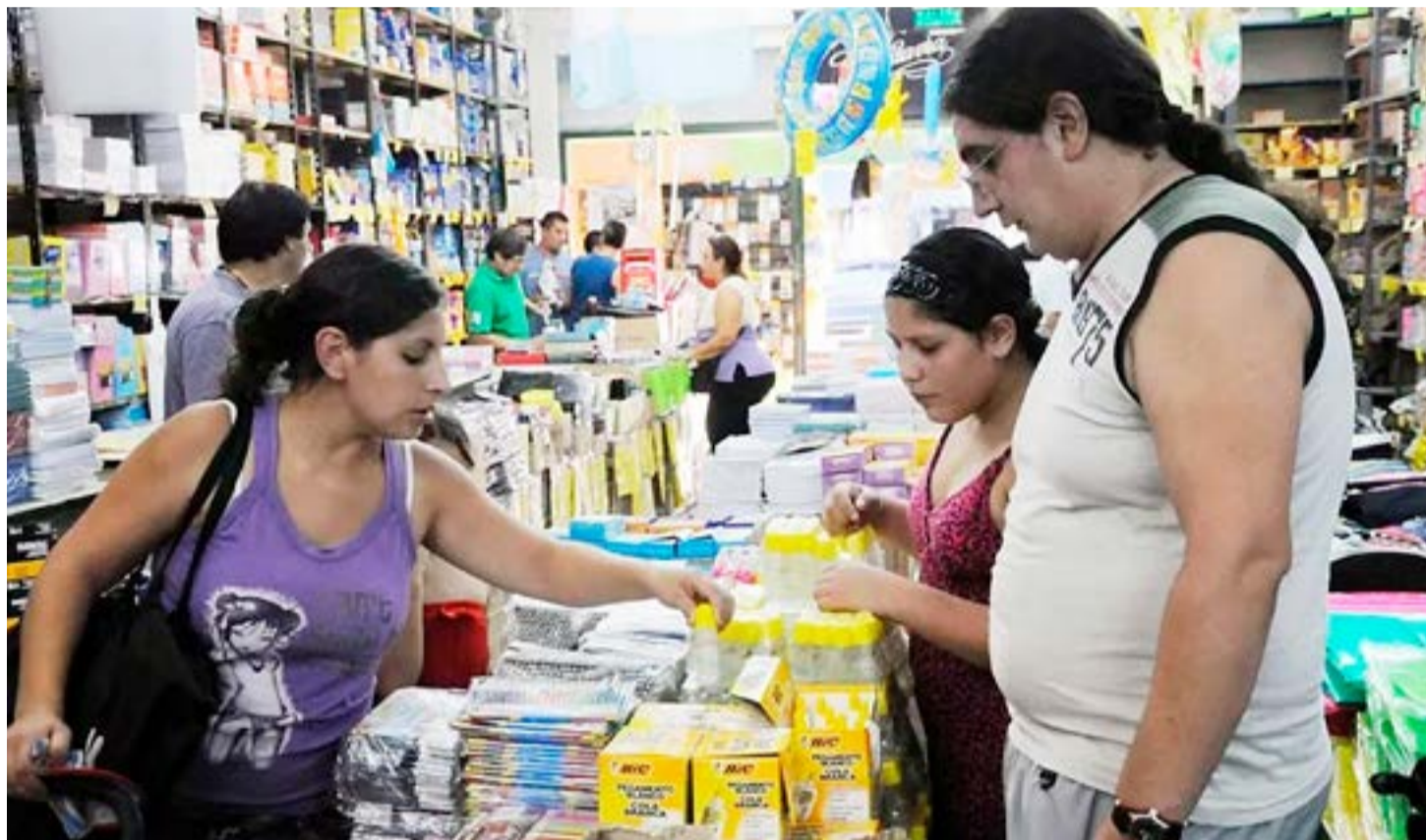
Los comerciantes aseguran que la temporada es buena, pero advierten algunos problemas de faltantes.

“No hace falta Precios Justos en la librería. Lápices de $30; gomas de $70, $80, $100; cartuchera de $500 hay todo el año. Un papel glacé de $50 es real, lo mismo que cuadernos a $180. Yo no necesito ese tipo de herramientas”, dijo Iglesias.