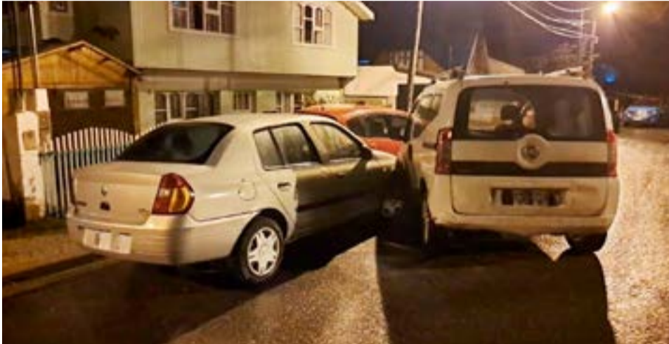
Violento choque entre tres unidades en Ushuaia, resultó sin heridos.