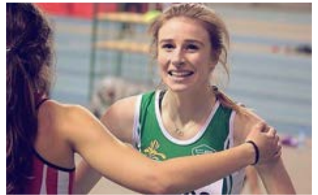
El siniestro fatal se registró el 26 de febrero de este año.