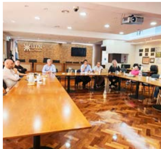
Durante el encuentro, se realizó una puesta en común de la situación actual de las radios en cada facultad regional y se discutieron estrategias para potenciar su desarrollo.

Vía zoom, también participaron representantes de las radios de las facultades regionales de Santa Cruz, Delta, Mendoza y Rafaela.