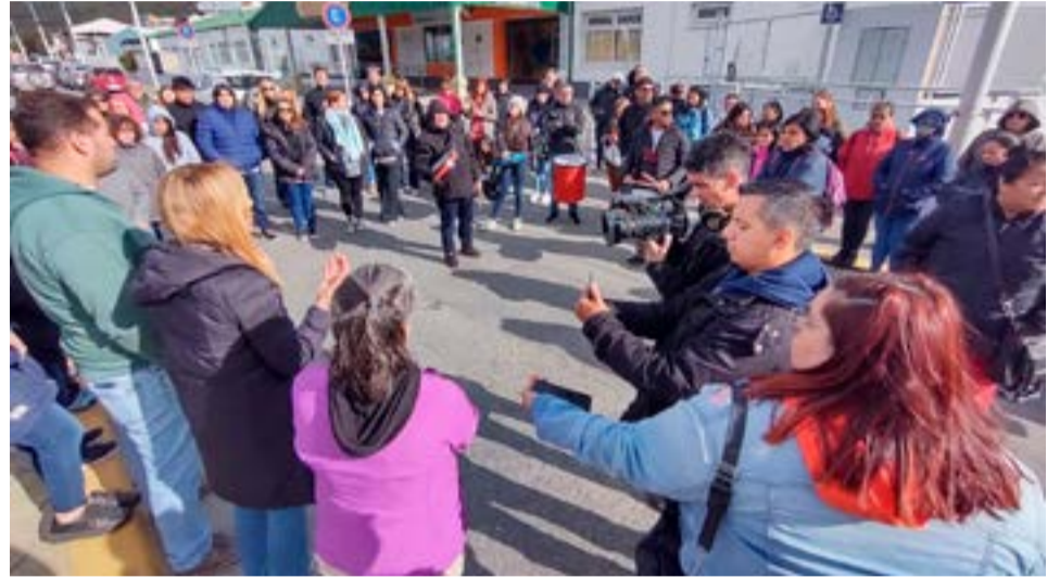
Directivos, docentes, padres, madres y estudiantes de la escuela especial Kayú Chénèn realizaron el viernes un abrazo solidario al edificio, para reclamar por el inicio de clases.