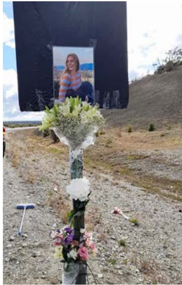
La joven atleta (foto) falleció tras haber sufrido un violento incidente de tránsito el pasado 26 de febrero, en cercanías de Tolhuin.

En esta ocasión se realizó una salvedad, creo necesaria e importante. Para colocar la Señal Informativa Estrella Amarilla, y pintar la Estrella, debe ser solicitada por un