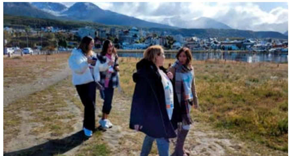
“Invertir en mujeres es cambiar el mundo” fue el lema 2023 del movimiento mundial que se desarrolla en simultáneo en 180 países con el objetivo de inspirar a la próxima generación de mujeres líderes a través del mentoreo.

nata de mentoreo 2023 te invitamos a visitar www.vocesvitales.org.ar y seguirnos en redes sociales: @vocesvitalesconosur donde encontrarás el formulario de inscripción.