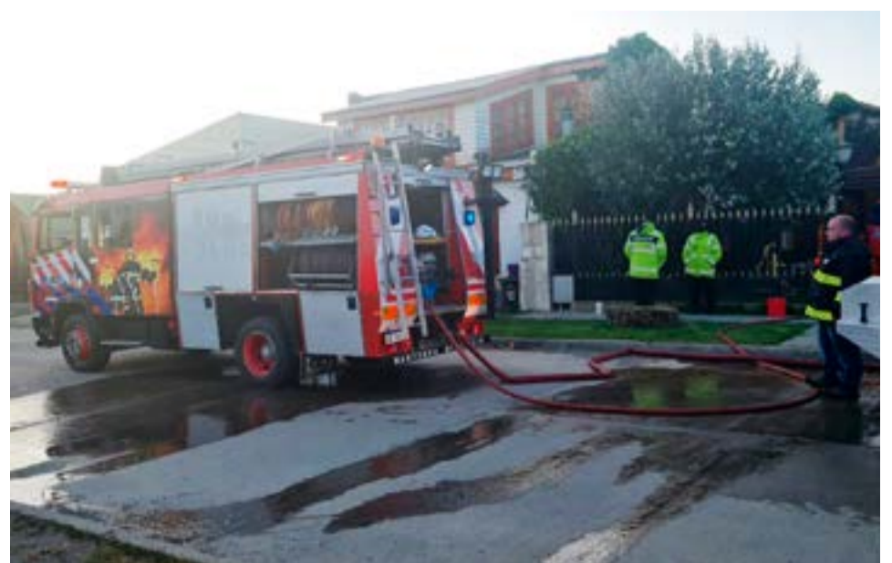
Principio de incendio en el tiraje de una parrilla en Gregoria Matorras al 1900, causó alerta entre vecinos de la zona.

la parrilla que se encuentra en el quincho, en el tiraje comenzó el ígneo afectando parte del techo. No resultaron lesionadas personas. Participaron además, Bomberos Voluntarios, Dirección Municipal de Defensa Civil y Dirección de Tránsito Municipal que colaboró con la Policía en el corte de la calle.