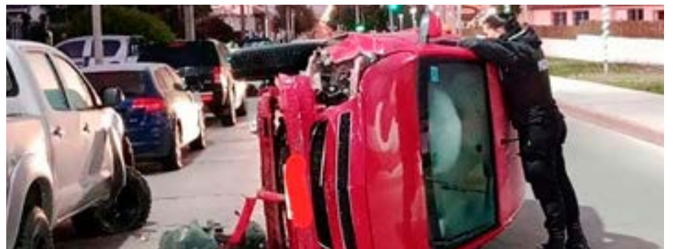
Conductor en contramano y en estado de ebriedad chocó a 6 autos estacionados y volcó.

El test de alcoholemia dio positivo, Riveros conducía con 1,03 g/L.