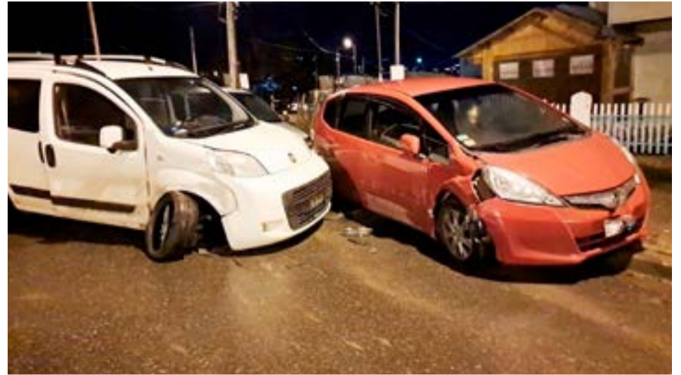
Estado en que quedaron los rodados.