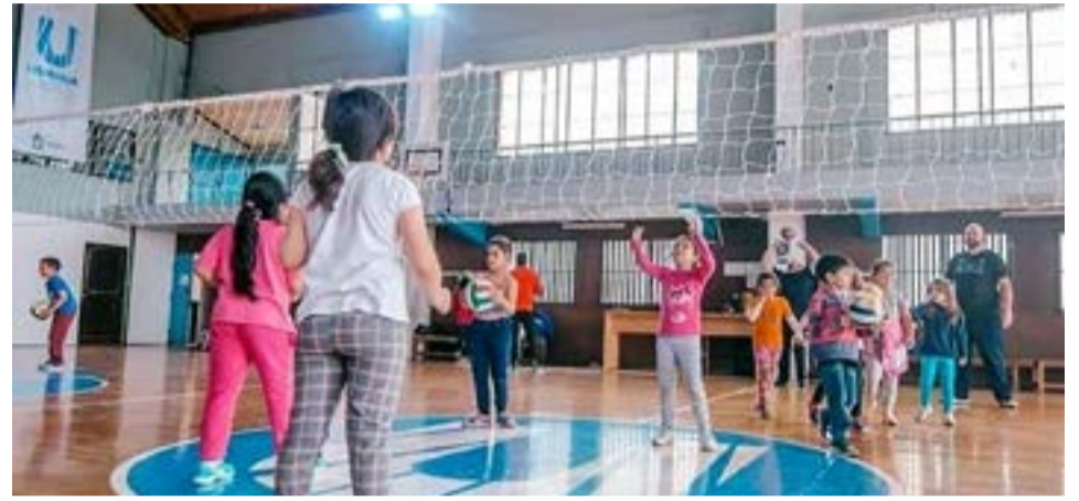
La Municipalidad de Ushuaia a través del Instituto Municipal de Deportes abre las inscripciones para las Escuelas Municipales 2023.

*Escuela de Kayak *Trail Running *Escuela de Montaña *Futsal Femenino *Futsal Masculino *Escuela Polideportiva *Escuela de Skate *Escuela Mini Atletismo *Escuela de Atletismo *Escuela de Newcom *Escuela de Básquet *Escuela de Voley *Entrenamiento *Funcional Damas *GAP *Yoga *Stretching *Escuela de Karate *Escuela de Judo