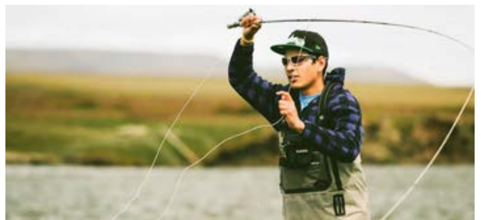
Nuevas habilitaciones de cotos de pesca para residentes de Tierra del Fuego hasta el final de temporada de la Pesca Deportiva 22/23.

“En caso de presentarse algún inconveniente en alguno de estos sectores o inclusive presenciar alguna actitud anti-deportiva, pueden presentar el descargo en la Secretaría de Ambiente, a la dirección de Recursos Hídricos o bien enviar un correo a pescacontinentaltdf@gmail.com”, cerró el Director de Recursos Icticos.