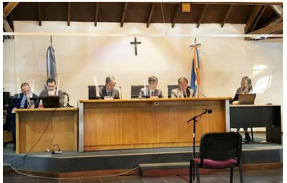
Hoy comienza un proceso oral no público contra sujeto que abusó sexualmente de una niña.

Para la audiencia de debate está prevista la presencia de 14 testigos.