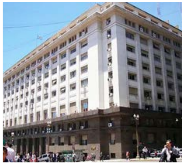
A pesar del traspí que tuvo el Ministerio de Economía en enero en materia fiscal con un incremento del déficit fuera de lo previsto, el gasto real devengado de febrero siguió en baja.

bre. Ya ordenados los pagos pendientes de diciembre, analistas estiman que las cuentas del sector público vol-