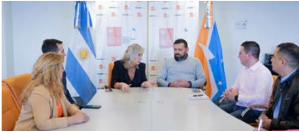
En el encuentro realizado en Casa de Gobierno se plantearon estrategias vinculadas con el cooperativismo, para acompañar a la reinserción laboral de liberados.

“Hoy, de manera articulada con el Gobierno de Tierra del Fuego, nos pusimos a trabajar para que este deseo se convierta en una realidad, donde los y las compañeras que están en las unidades penitenciarias puedan tener esta oportunidad junto con sus familias, posibilitando una verdadera inclusión para esta hermosa provincia”, finalizó.