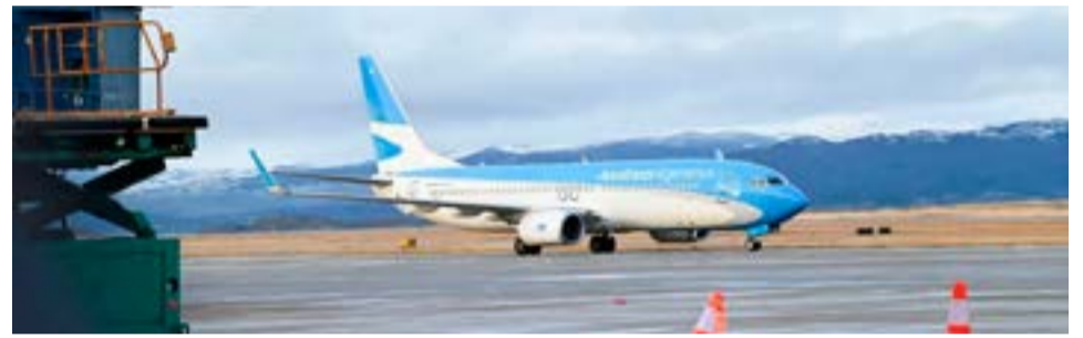
El Ministro de Turismo y Deportes de la Nación, Matías Lammens celebró que el aeropuerto internacional "Malvinas Argentinas" de Ushuaia haya superado en un 25% el movimiento de pasajeros registrado con anterioridad a la pandemia de coronavirus.

La terminal internacional de Ushuaia es una de las estaciones aéreas que más crecieron en cuanto al traslado de pasajeros de cabotaje en comparación con la prepandemia, junto con las de San Carlos de Bariloche y El Calafate. El porcentaje de crecimiento es del 37%