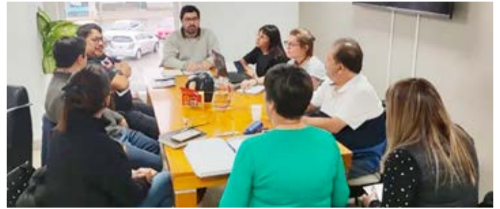
Sobre el final de la semana anterior, se desarrolló una nueva reunión paritaria del sector docente, con la presencia de representantes del SUTEF y el Gobierno de la provincia.

porcentajes para antigüedades superiores a 25 años, tal como se había asegurado en la reunión anterior, y se comprometió a analizar la nueva solicitud y traer una