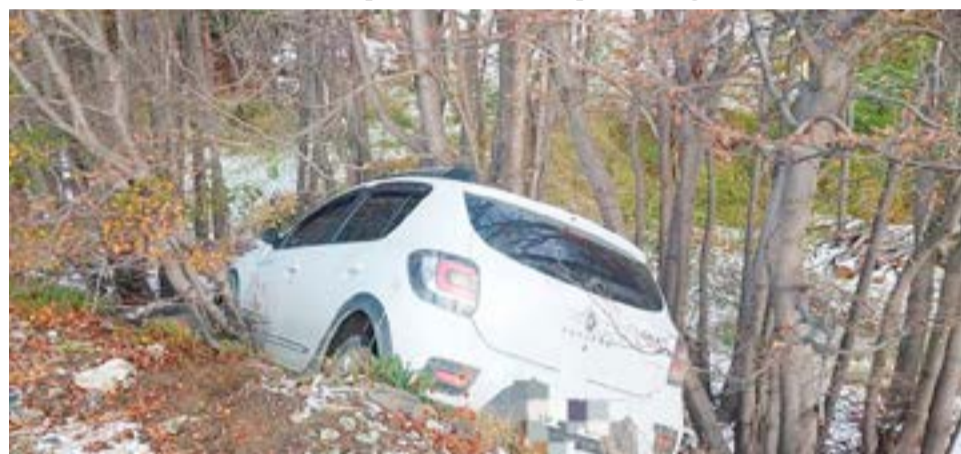
Conductora perdió el control de su unidad debido a la escarcha y terminó entre los árboles en el camino al Martial.

Asimismo, la conductora y única ocupante del rodado no presentaba lesiones visibles ni adujo dolencia alguna, por lo que al presentar la documentación correspondiente para circular fue asesorada de los pasos a seguir.