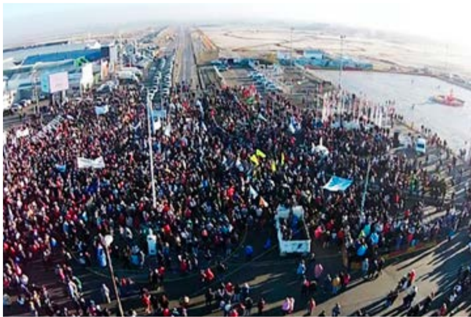
La Multisectorial de Derechos Humanos de Río Grande emitió un comunicado por el Día Internacional de los Trabajadores y las Trabajadoras.

cesario también hacer mención a los oportunistas, a los que se entregan a la