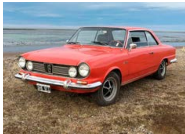
Un Torino, será parte de la muestra.