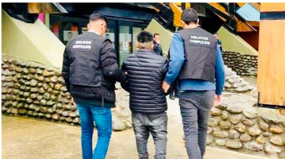
Capturan en Ushuaia a sujeto involucrado en una causa por intento de homicidio en Salta.

Por su parte, personal de Tránsito Municipal, practicó el alcohótest, arrojando éste positivo en 1.23 G/L, razón por la cual la unidad Kangoo, fue incautada y trasladada en grúa hacia el predio municipal.