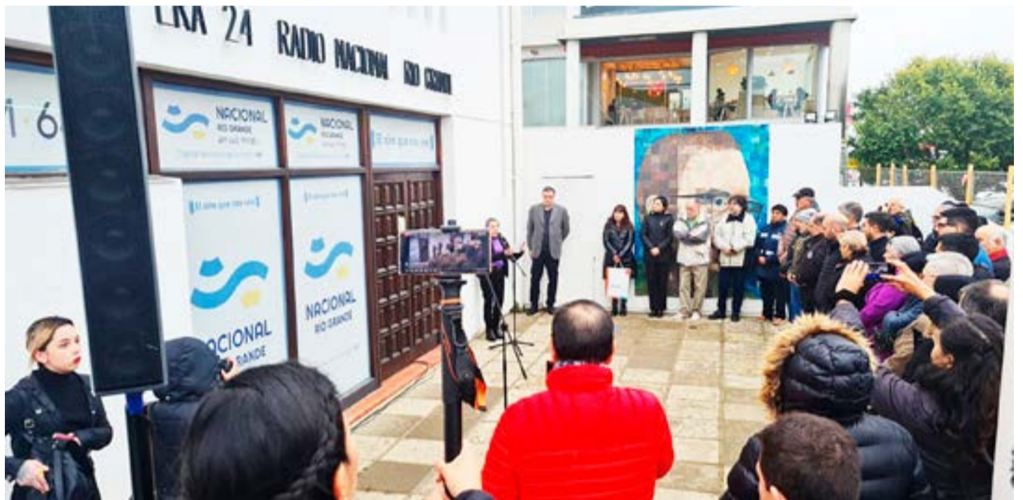
En la explanada de LRA 24 Radio Nacional Río Grande, se realizó el pasado viernes el acto por los 50 años de la emisora.

Agregó que desde la Frecuencia Modulada 640 del dial, “nuestro personal se encarga de llevar la voz a nuestras Malvinas, a nuestra Antártida, nada menos. Entonces realmente es un orgullo enorme poder ser parte de este festejo de 50 años, de ver trabajadores históricos que han estado poniendo al aire la radio, de ver los vecinos también que se acercan a saludar, que mandan mensajes, que se emocio-