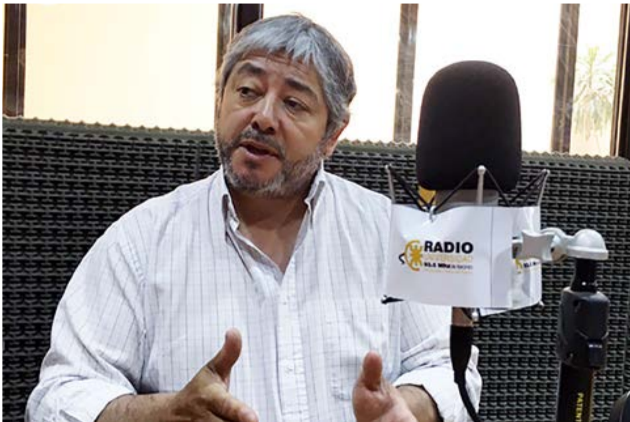
El candidato a intendente de Río Grande por Republicanos Unidos, Julio Mercado, dialogó con Radio Universidad 93.5 y Provincia 23 en el marco las elecciones provinciales a desarrollarse el próximo 14 de mayo y sobre la situación actual que atraviesa el sector ganadero y productivo de Tierra del Fuego.

Finalmente, anticipó que trabajarán en “mejorar el flujo vehicular del transporte en las dos cabeceras del puente General Mosconi. Entendemos y creemos que mejoraría muchísimo hacer un puente más y eso no se discute, pero mientras tanto, proponemos rediseñar las rotondas de ambos extremos porque el cuello de botella se hace ahí. El flujo por el puente es constante, quizá un poco más lento, pero constante. También queremos trabajar en cómo mejoramos el servicio público. Nosotros deberíamos seducir al usuario y al dueño de su propio vehículo a que use el transporte público de pasajeros. También tenemos que mejorar las garitas”.