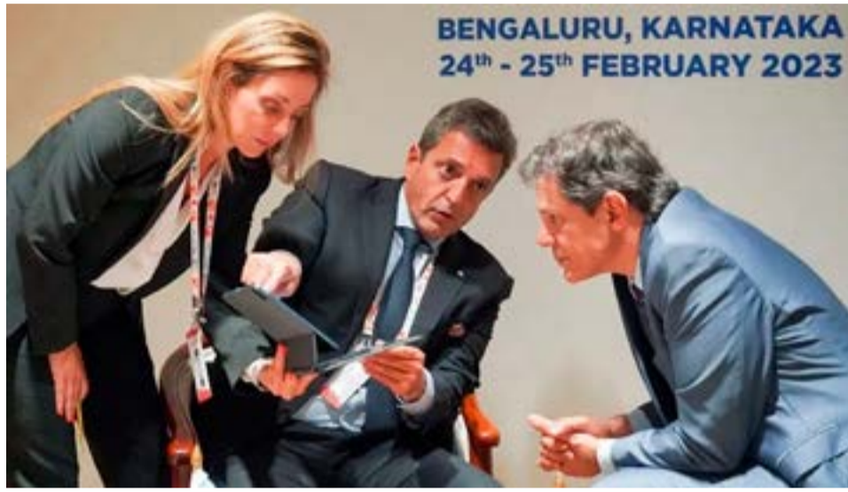
Brasil está dispuesto a incrementar el financiamiento del comercio exterior con Argentina para no seguir perdiendo terreno frente a China.

El déficit del año pasado fue consecuencia de importaciones que crecieron muy por encima de las exportaciones. "En detalle: mientras que las importaciones totalizaron los USD15.358 millones y crecieron un 29,3% interanual, las exportaciones llegaron a USD13.104 millones con una suba de 9,7% interanual", precisó Abeceb. Además, Galípolo no descartó conseguir incluso más financiamiento para este fondo bilateral de parte del Banco de los BRICS, actualmente presidido por Dilma Rousseff. Al fin y al cabo, tanto Brasil como China son los principales socios comerciales de Argentina. Sin embargo, se cuidó de no confirmarlo tampoco: "El tema de contar o no con ayuda del banco de los Brics es porque tiene un segundo país interesado en ayudar a la Argentina, que es China, que tiene musculatura para hacer algo. Tener un socio como China en este diálogo es muy relevante", dijo.