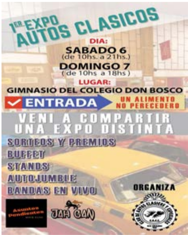
El afiche promocionando el evento.

Agregó que “hemos invitado a gente de Punta Arenas y de Porvenir donde hay autos clásicos muy lindos con