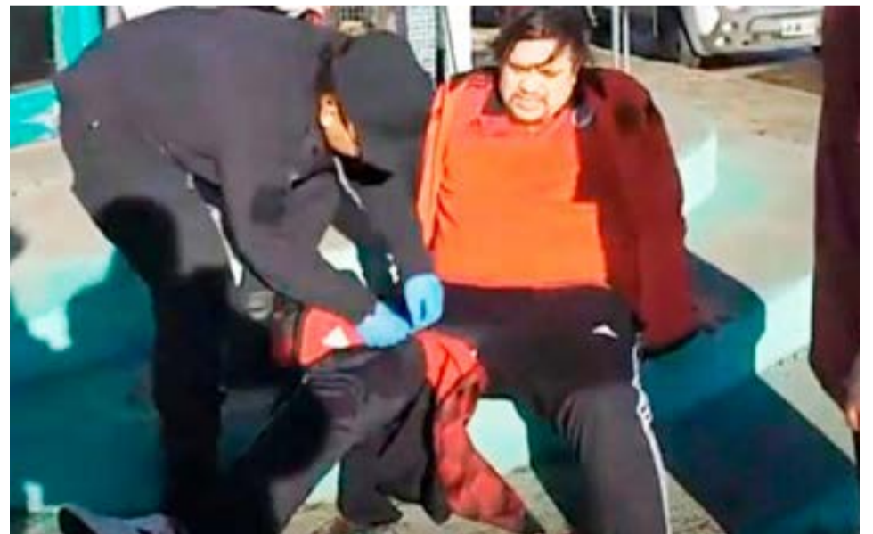
Cabe recordar que en la balacera un joven fue herido de bala.

hermano. Frente al pedido de excarcelación, el Fiscal Ariel Pinno no se opuso, por lo tanto, se lo excarceló y se le impusieron diversas