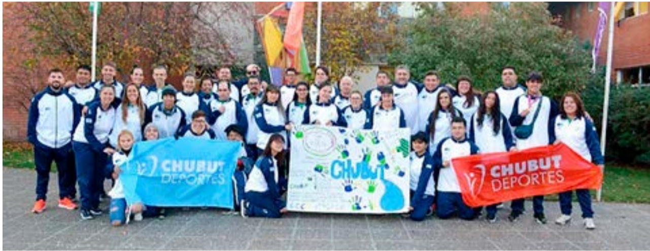
La delegación chubutense, compuesta por un total de 42 personas, entre deportistas, acompañantes, entrenadores, cuerpo médico, equipo de prensa y choferes, partió el domingo en horas de la tarde desde el Valle, arribando a la noche a Trevelin.

región de La Araucanía, la tercera edición de los Juegos Para Araucanía, destinados a deportistas con discapacidad.