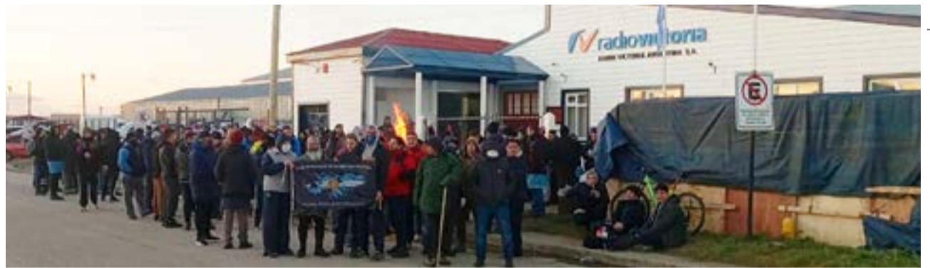
El Congreso de Delegados y Delegadas de la UOM Río Grande resolvió realizar un paro activo este jueves, en consonancia con la medida de la CGT R.A.

En el tramo final, la resolución indica la determinación de “decretar el quite de colaboración y corte total de jornada de horas extraordinarias, hasta tanto se resuelva nuestro reclamo salarial y realizar asambleas resolutivas en cada turno, en cada establecimiento metalúrgico a partir de la presente resolución”.