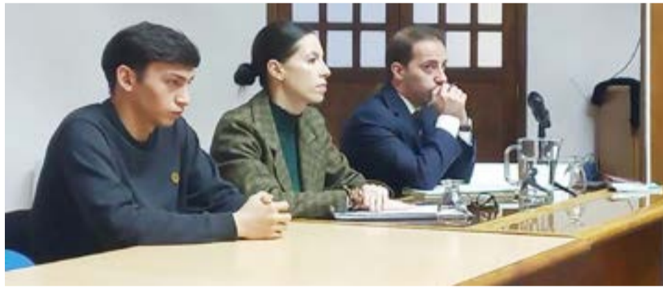
Sujeto que enfrenta juicio por la muerte de 5 personas en un incendio manifestó su arrepentimiento ante el Tribunal de Juicio de Ushuaia.