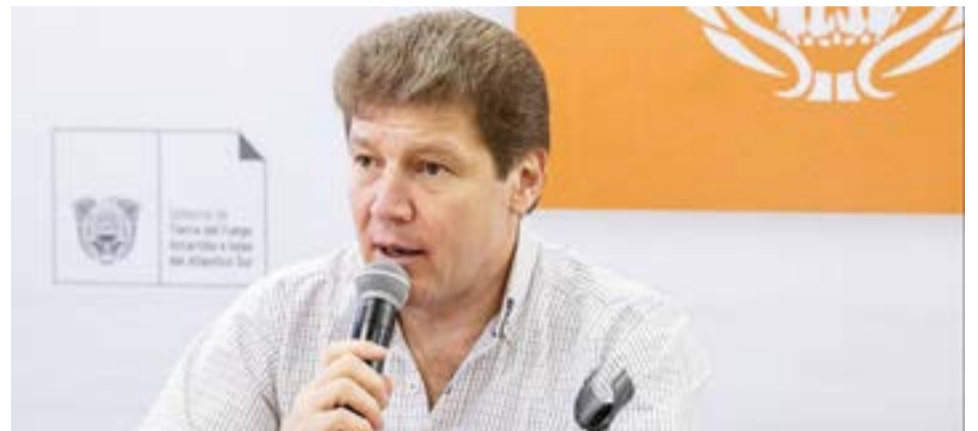
El gobernador Gustavo Melella expresó por FM Del Pueblo su oposición al pago de Ganancias por parte de los trabajadores, no sólo de la provincia sino de todo el país.

Se habla de la protección de la propiedad privada y eso está en la Constitución Nacional. Hacer un acto por una foto no tiene sentido. Si fuera realmente un acuerdo que se trabaja entre el gobierno