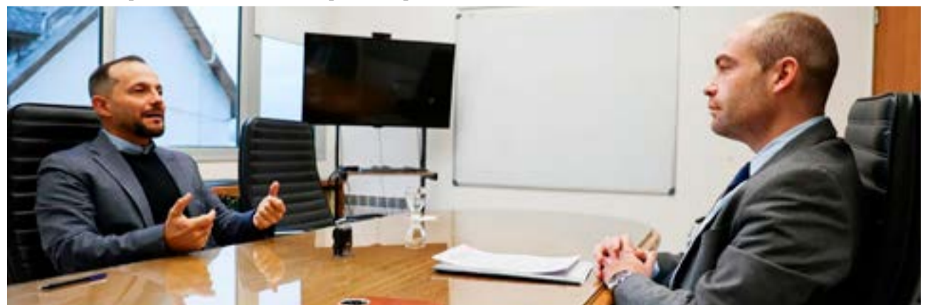
Alumnado de la Tecnicatura en Ciencia de Datos e Inteligencia Artificial podrán realizar prácticas profesionalizantes en el Poder Judicial.