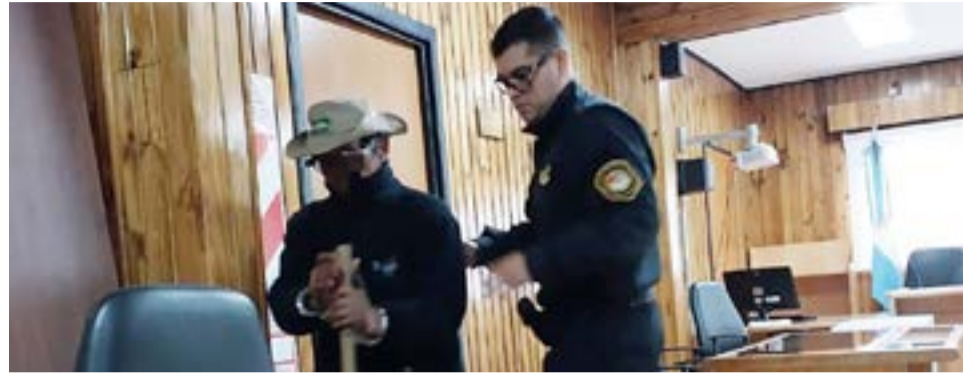
Hombre que abusó de su nieto fue condenado a 18 años de cárcel efectiva.

Los fundamentos de la sentencia serán leídos el 21 de mayo a las 13.