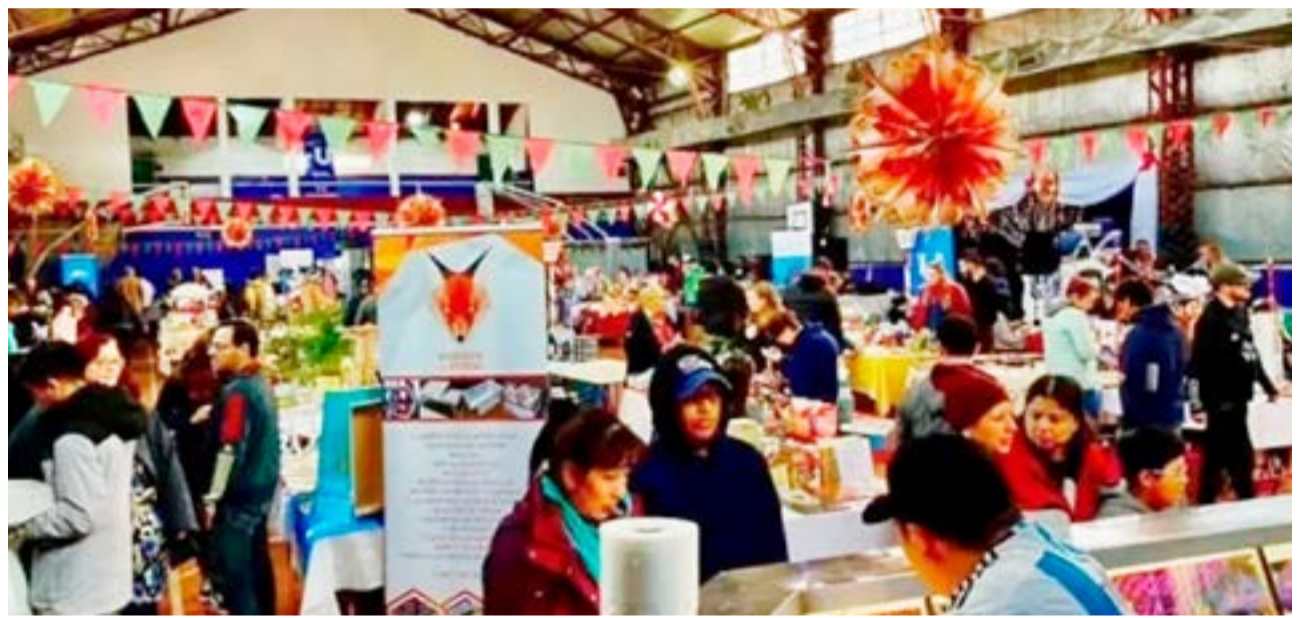
La Municipalidad de Ushuaia llevará adelante este sábado 11 y domingo 12 de mayo en el gimnasio municipal "Cochocho" Vargas, de 14 a 20, una nueva edición del Mercado Concentrador y la Expo de Emprendedores.

En ambas jornadas estarán los stand de Tarjeta +U y del área de Economía Social del Municipio, donde se atenderán consultas e inquietudes.