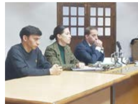
Condenan a un hombre por el fallecimiento de 5 personas en el incendio de una vivienda en la ruta "J"