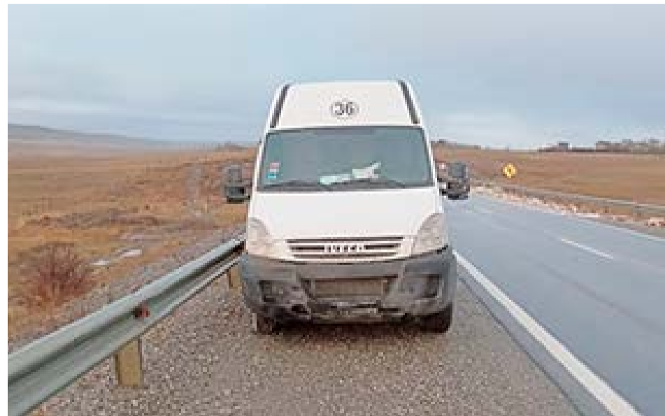
Una combi despistó en cercanías de Tolhuin.

tórax, por lo que se procede al traslado al Hospital Modular para su atención médica.