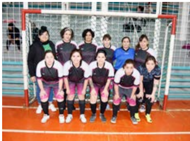
El equipo de Fusión, categoría mayores.

"Y en mi caso personal, bueno, contarte que yo todavía sigo en carrera, o sea, ya de por sí soy arquera, así es que, participo en todos los equipos que me fueron convocado, que es en la valla, mi lugar es el arco y para mi es lindo y es muy divertido ya que también disfruto de la compañía de amigas que a través de los años fuimos jugando, como así también de aquellas chicas que se fueron retirando con el tiempo, pero si continuamos viéndonos en todos los torneos que organiza en nuestra ciudad la asociación civil, deportiva, social y cultural de Río Grande, como así también en todos los torneos de futsal femenino que organiza el Municipio de Río Grande, así es que, es una gran satisfacción para mi poder continuar activa ya que he logrado mi propia experiencia, de la cual, bueno, la mayoría de los equipos sí me llaman, ahí estaré, estado