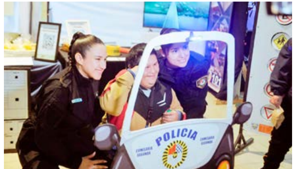
La muestra estará dispuesta hasta el próximo viernes 10 de mayo, de 09 a 16:00 horas, en la sede del IPRA ubicada en Perito Moreno 168.

En la muestra de este año participan los niveles inicial, primario y secundario de