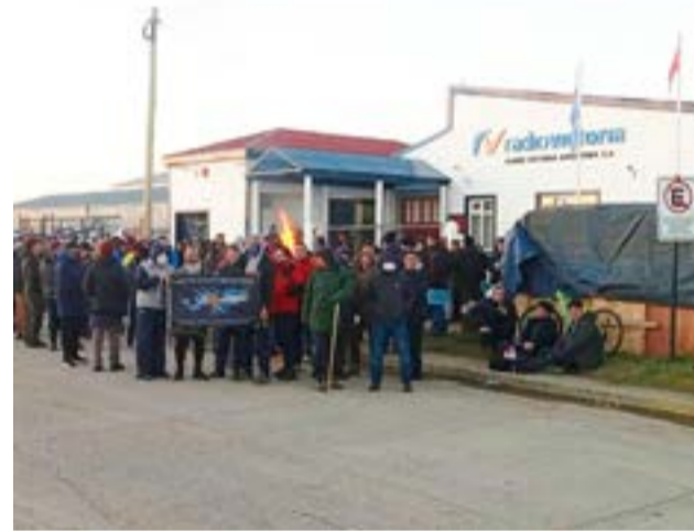
El paro de actividades resuelto por la CGT a nivel nacional, será acompañado con diferentes manifestaciones en la provincia.

No habrá transporte público de pasajeros. Tampoco funcionará el servicio de recolección de residuos, por lo que se solicita a los vecinos y vecinas no sacar sus