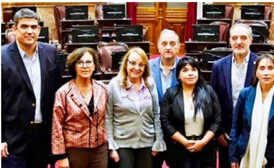
Las senadoras y senadores patagónicos de Unión por la Patria solicitaron a los distintos espacios políticos de la región que rechacen en general y en particular la Ley Bases y el Paquete Fiscal “ya que no existe un solo artículo y/o capítulo que beneficie a las provincias del sur argentino”.

y afectaría la generación de energía para la Nación. Como así también, nuestros medios públicos de comunicación como Radio Nacional y la Televisión Pública que llegan con su contenido a cada rincón de la Argentina ejerciendo soberanía comunicacional”.