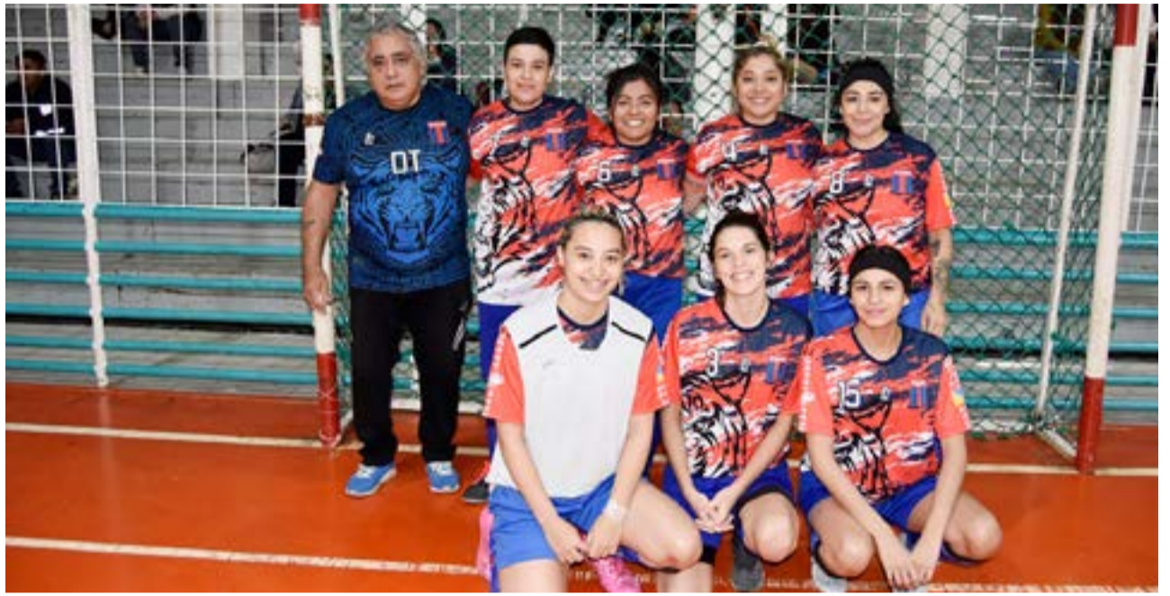
El equipo de Deportivo Tigre, categoría mayores.