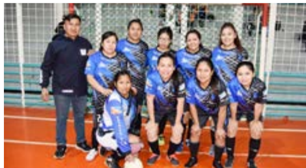
El equipo de Patagonia, categoría mayores.

Además destacó que: "contarte que la mayoría de las jugadoras pertenecemos a la selección senior de Río Gran-