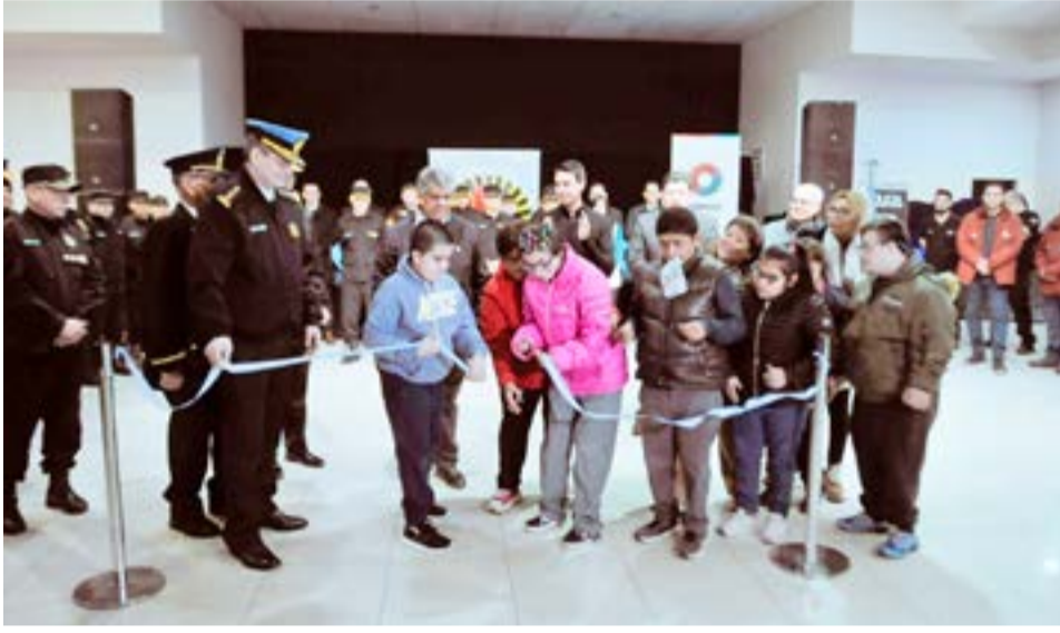
Se inauguró en Río Grande una nueva edición de la Expo "Conociendo tu Policía".

Desde el Gobierno provincial invitaron a vecinos y vecinas de la ciudad de Tolhuin a participar de la inauguración de la Expo "Conociendo tu Policía" que se realizará mañana jueves 9, desde las 10:00, en el Gimnasio Polideportivo "Ezequiel Rivero" ubicado en Lucas Bridges N°322. La muestra se desarrollará los días 9 y 10 de mayo, de 10 a 18:00.