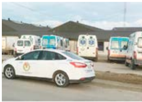
Dos personas resultaron intoxicadas por uso de soda cáustica para limpieza de baños de un establecimiento ubicado en calles Fagnano y Bilbao.

Río Grande.- Personal de maestranza estaba efectuando limpieza de los baños utilizando soda cáustica lo que ocasionó ardor y picazón, razón por la que se requirió presencia de personal sanitario. La ambulancia trasladó a dos empleadas del establecimiento, quienes fueron asistidas en el sector "Shockroom" recibiendo oxígeno y suero, a la espera de resultados médicos, encontrándose ambas estables en su estado de salud. En la fecha se intervino en un establecimiento educativo sito en Irigoyen y Av. Belgrano a raíz de personas que habían sufrido intoxicación. Momentos después se supo que ambas personas se encontraban estables.