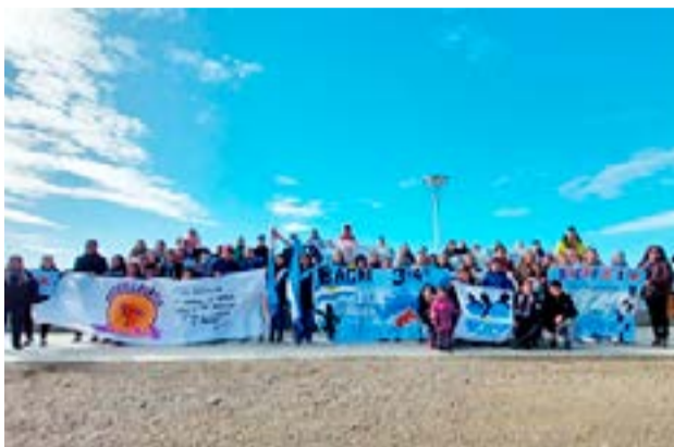
El Bachillerato Popular "Presente", que funciona en la ciudad de Río Grande, cumplió su sexto aniversario el pasado martes 14 del corriente.

Después se señala que "Quienes hacemos el bachi, estudiantes, educadores y referentes de la comunidad, contribuimos de manera articulada para una sociedad más justa, equitativa e igualitaria, con el objetivo de