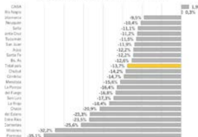
Gráfico 4. Variaciones % interanuales por jurisdicción subnacional. Abril 2024