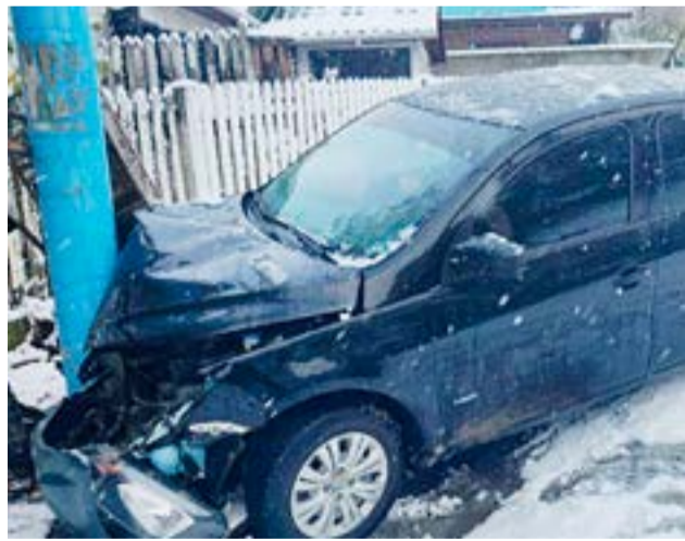
Circulaba sin cubiertas de invierno, perdió el control del auto y chocó contra un poste en la ciudad de Ushuaia.

El conductor del rodado no sufrió lesiones, sin embargo, su hijo de 11 años resultó con golpes en su mano y cabeza y fue trasladado al hospital.