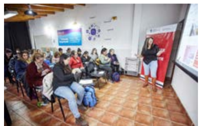
Durante tres encuentros los y las asistentes desarrollaron el uso de la plataforma Canva, la creación de gráficos y publicaciones para redes sociales; diseño de logotipos y material promocional; consejos para destacar contenidos; utilidades y funcionalidades en general.

de logotipos y material promocional; consejos para destacar contenidos; utilidades y funcionalidades en general.