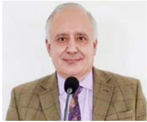
Concejales imputados por malversación de fondos públicos: “para mí son todos inocentes”, anticipó el Juez Silvio Pellegrino.

Río Grande.- Pellegrino confirmó que la causa “alcanza a estas siete personas que son mencionadas en la denuncia”, respec-