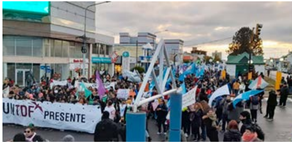
Ante la falta de respuestas del gobierno nacional, CONADU Histórica convocó a un Paro Nacional para el día de hoy, junto al Frente Sindical Universitario.

la Universidad de Buenos Aires y de un 300% para hospitales de la misma. Esto deja en evidencia que el Gobierno tiene