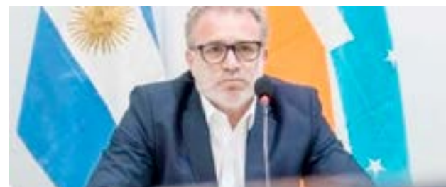
Daniele sugirió que es momento de suspender todas las disputas internas, por lo cual hay que “parar la pelota y suspender todo porque no es momento definitivamente”.

Daniele sugirió la necesidad de una reflexión profunda dentro del partido y al respecto sostuvo que “creo que sería bueno revisar un poco esas cosas