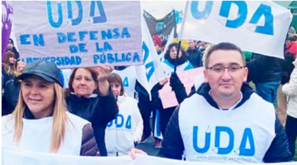
Todos los sectores gremiales del sector docente confluyen en el paro de hoy.

Para AMET, "la educación está siendo descuidada por el Gobierno nacional y provincial. Necesitamos un financiamiento adecuado de las instituciones en todos los niveles educativos. ¡Levantemos la voz y exijamos un cambio ahora mismo! ¡Por una educación justa y digna para todos!", concluye el comunicado.