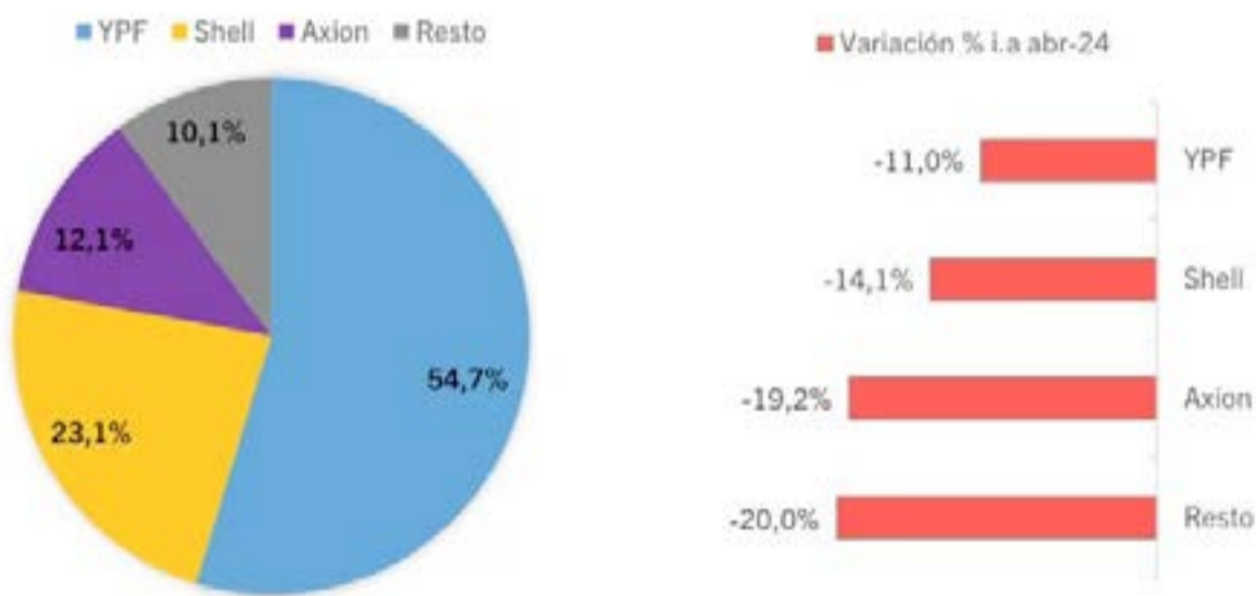
Gráfico 3. Participación % y variación % i.a. por empresa en las ventas de combustible. Abril 2024