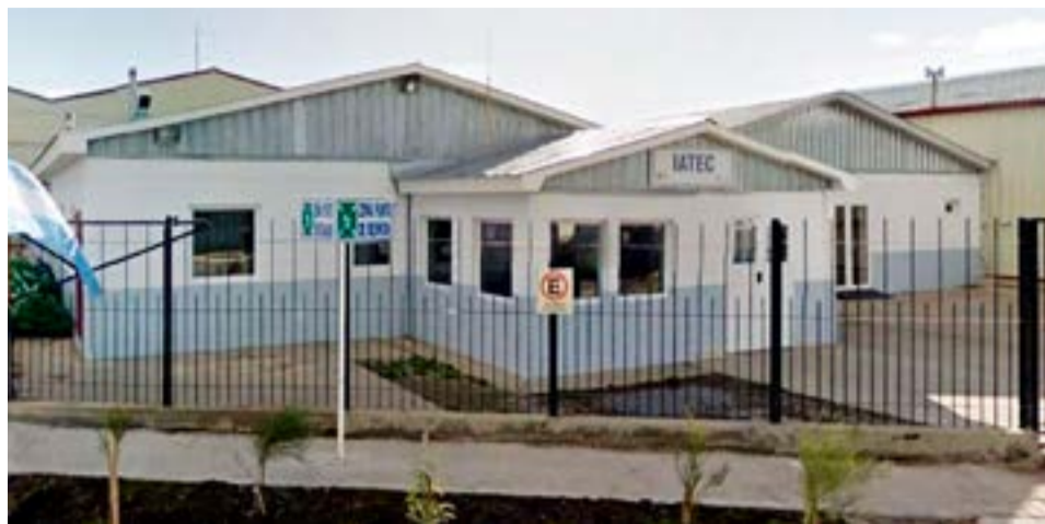
Ayer por la mañana, 21 operarios y operarias no pudieron ingresar a ocupar sus puestos de trabajo en las plantas de IATEC de la ciudad de Río Grande.

Finalmente, luego de un extenso debate, se resolvió extender de 20 a 30 minutos por cada hora el paro de actividades que vienen realizando en las plantas. Igualmente, se esperaba saber si el Ministerio de Trabajo de la provincia intervendría de manera similar a lo resuelto para los despidos ocurridos en Radio Victoria Fueguina, resolviendo decretar la conciliación obligatoria y abriendo un periodo de negociación.