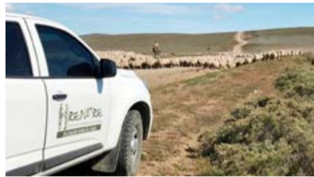
El RENATRE anunció un nuevo aumento en la prestación por desempleo destinada a los trabajadores y trabajadoras rurales para el mes de mayo, abonándose el reajuste correspondiente al incremento, con la cuota del mes de junio.

der al Sistema Integral de Prestación por Desempleo. Además de la prestación económica, la prestación comprende cobertura médico-asistencial, servicio de sepe-