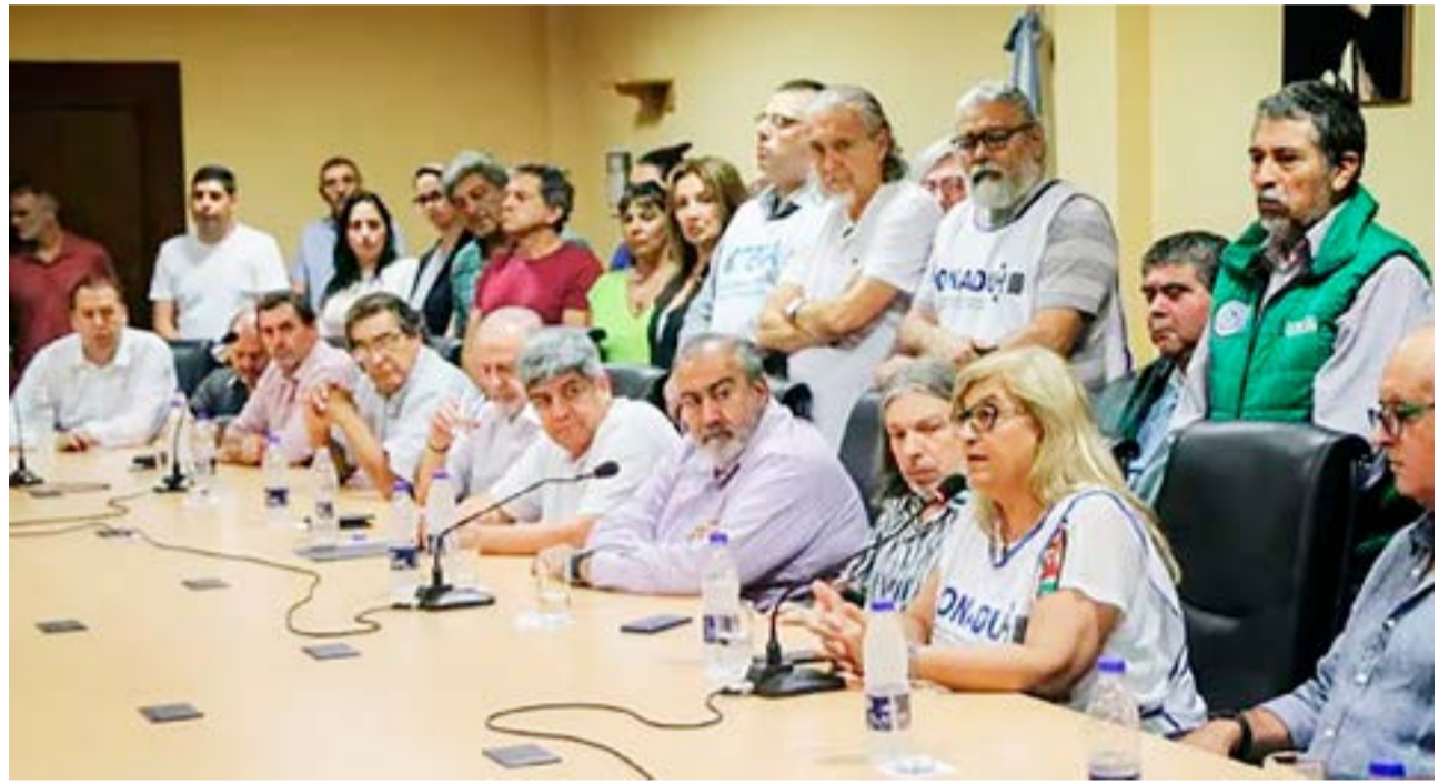
Frente Sindical de Universidades Nacionales (FSUN) anunció un paro nacional universitario de 48 horas para el próximo martes 4 y miércoles 5 de junio, luego de reunirse ayer con la ministra de Capital Humano, Sandra Pettovello, y el subsecretario de Políticas Universitarias, Alejandro Álvarez.

del presupuesto es el salario de quienes trabajamos en las universidades y ello está aún sin solución”, denunció el FSUN en un comunicado.