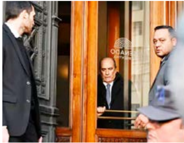
El flamante jefe de Gabinete, Guillermo Francos, al salir del Senado.