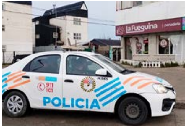
Asaltaron una panadería y un sujeto se alzó con unos 40 mil pesos.

Río Grande.- Un hombre ingresó a la panadería, amenazó a la empleada y luego huyó del lugar, llevándose unos 40 mil pesos que correspondían a la recaudación. La mujer solicitó de inmediato presencia policial y luego, fue trasladada a las dependencias de la Comisaría Tercera para prestar declaración y se realiza el relevamiento de las cámaras de seguridad de la zona. El propietario de la panadería, aportó las imágenes del