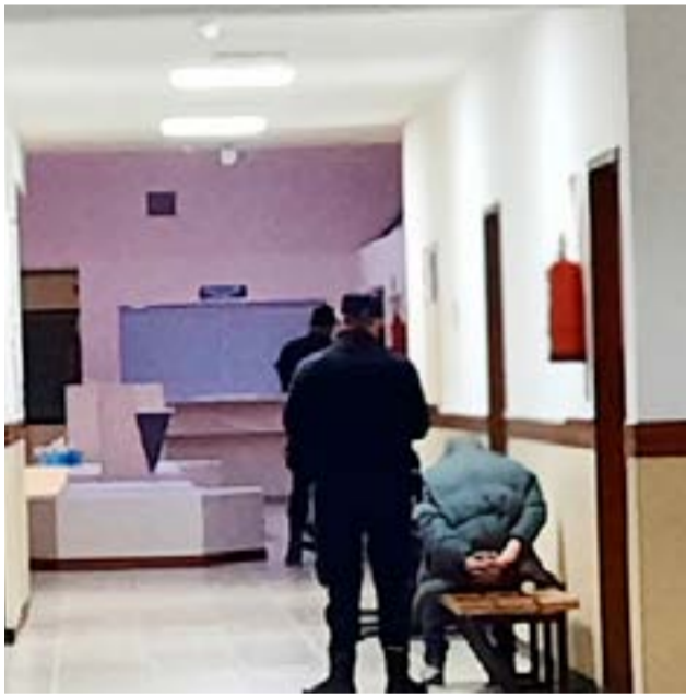
Ya son 6 los detenidos con posible vinculación al homicidio de Flavio Machado y se indagó a 5 de ellos.

Río Grande.- En la tarde de ayer, personal policial trasladó a los detenidos entre el domingo y el lunes, con posible vinculación en el asesinato de Flavio Gabriel Machado.