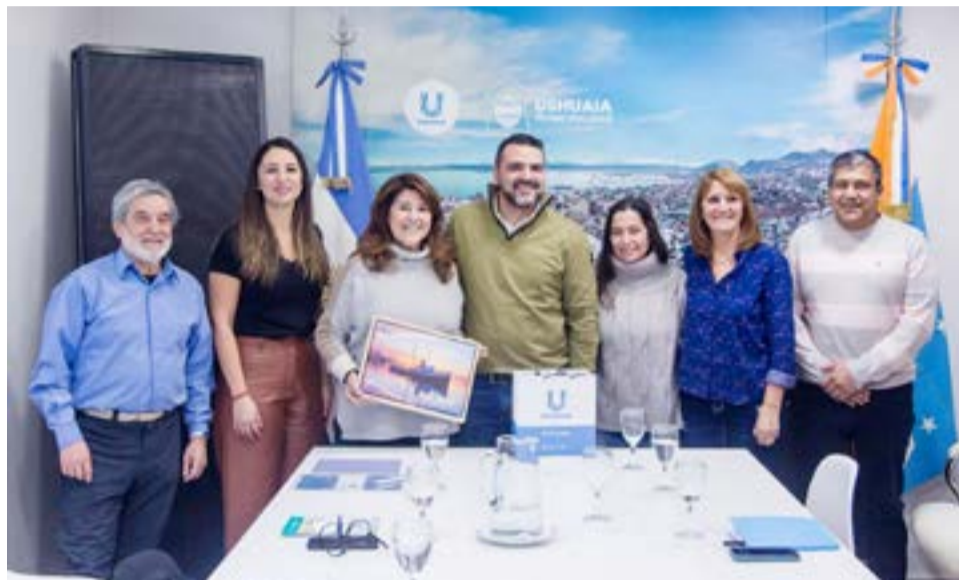
En la reunión se abordaron diferentes temáticas donde el equipo de ICLEI Argentina presentó ante el municipio un proyecto que está gestionado para la provincia de Tierra del Fuego, donde se pretende trabajar en forma articulada y conjunta en tres áreas protegidas; Bahía Encerrada, Península Mitre y Corazón de la Isla.

En tanto, el municipio acordó avanzar en el desarrollo de un trabajo en conjunto para que Ushuaia sea miembro de la Red de Ciudades de ICLEI, y así extender la experiencia con otros 2500 gobiernos locales de todo el mundo, con el objetivo de generar una agenda articulada para la formulación técnica del desarrollo de proyectos que busquen financiamiento externo e intercambio de experiencias con otras ciudades del mundo.