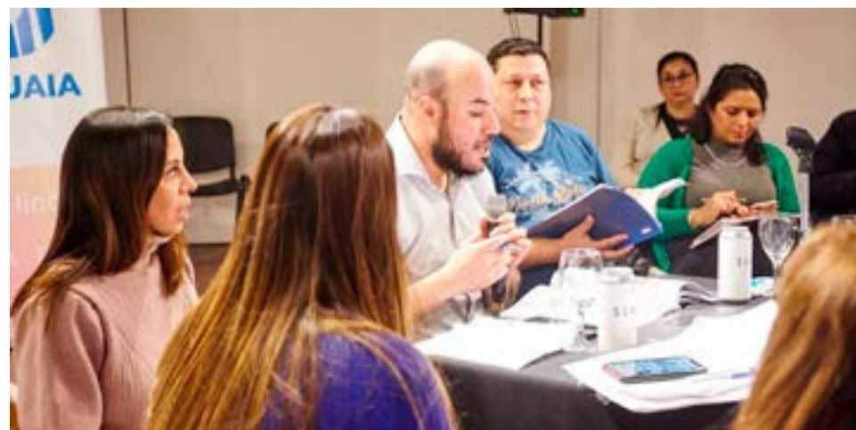
En el Foyer de la Casa de la Cultura de Ushuaia se llevó a cabo la segunda sesión ordinaria del año del Consejo Asesor Municipal de Seguridad Vial, en el marco de la cual se evaluaron distintos asuntos girados por el Concejo Deliberante para su análisis.

raderas y viables que mejoren el tránsito vehicular y reduzcan los siniestros en la ciudad”. Estuvieron presentes autoridades del Ejecutivo municipal, concejales y representantes de diversas instituciones como Policía de la Provincia, Seguridad Vial Provincial, Asociación de Taxis, Red Nacional de Familiares Víctimas de Siniestros Viales, Agencia Nacional de Seguridad Vial, Defensa Civil y Juzgado Administrativo Municipal de Faltas, entre otras. La sesión del Consejo de Seguridad Vial pasó a un cuarto intermedio hasta el lunes 3 de junio a las 17 horas en el Foyer de Casa de la Cultura.