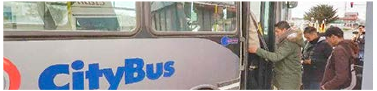
El Ejecutivo Municipal tomó la determinación de absorber con arcas municipales un 50% de la tarifa del boleto de colectivos de $1.174,85 en función de la estructura de costos presentada por la empresa City Bus, lo cual los usuarios abonarán un precio final de $587,42.

Ante esta solicitud de la empresa y las previsiones con-