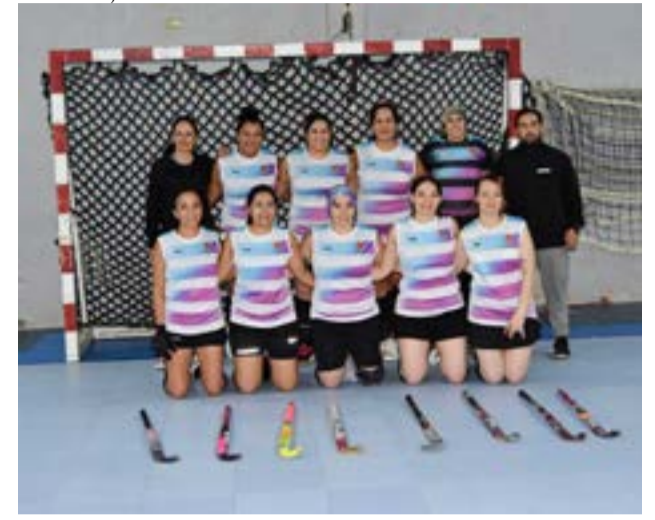
El equipo de Tolhuin.

Partido 2 – categoría sub-14 – inicio: 13.00 horas URC Rojo 2 URC Azul 3