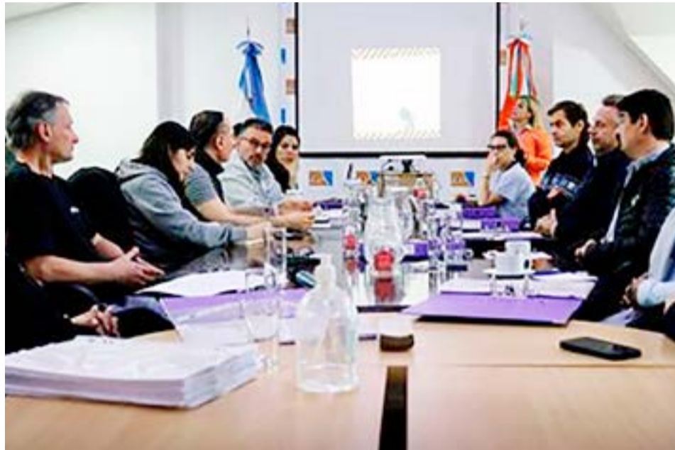
El Sindicato Unificado de Trabajadoras y Trabajadores de la Educación Fueguina (SUTEF) presentó, en la Comisión Nro. 4 de la Legislatura de la provincia, el anteproyecto de Ley de Financiamiento Integral del Sistema Educativo.

En ese mismo sentido, destacó que "el anteproyecto de ley va en esa dirección. Por ejemplo, la comunidad a partir de ese Consejo podría saber cuánto se invierte en las instituciones educativas, la responsabilidad de si están abiertas las instituciones ya no es del equipo directivo o la docencia podría opinar sobre cómo se contrata la mejor forma de mantenimiento edilicio", concluyeron desde el sindicato docente.