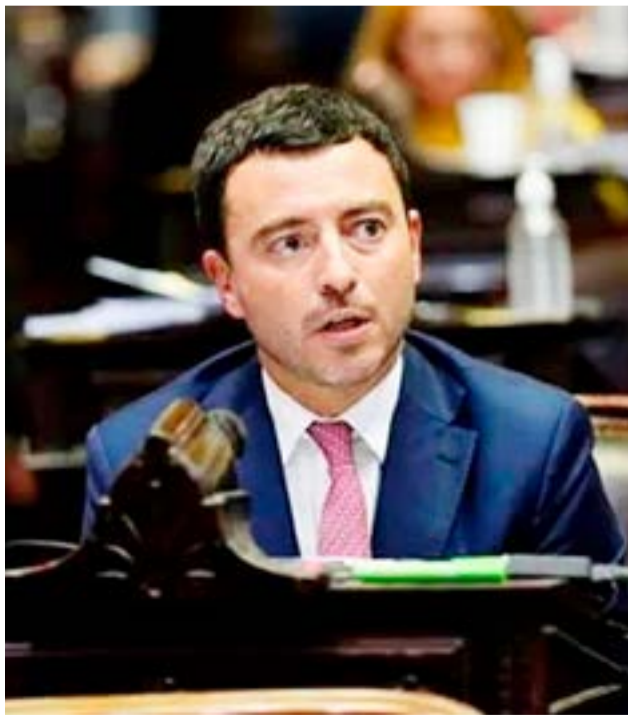
El diputado nacional Rodrigo De Loredo (UCR) propuso eliminar las exenciones tributarias que rigen en Tierra del Fuego, con el objetivo de garantizar el 'equilibrio fiscal' que propone el Gobierno nacional sin afectar las jubilaciones.

Río Grande.- El diputado nacional Rodrigo De Loredo (UCR) propuso eliminar las exenciones tributarias que rigen en Tierra del Fuego, con el objetivo de ga-