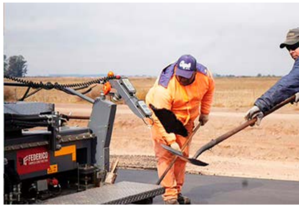
El Gobierno activó esta semana la decisión de transferir a las provincias obras públicas inconclusas de distinta naturaleza, paralizadas desde que asumió el presidente Javier Milei.

Córdoba, Chubut y de Neuquén. Con estos dos últimos, Ignacio Torres y Rolando Figueroa, firmó convenios para el traspaso de obras públicas. Se indicó que estos distritos se comprometen a asumir la financiación o ejecución de las obras detalladas en los convenios, entre las que se incluyen la construcción de hospitales y Centros de Desarrollo Infantil (CDI); la terminación de obras hídricas, de saneamiento y mejoramiento urbano; y de rutas y caminos, entre otras.