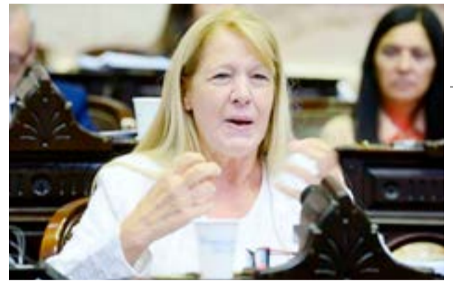
Diputada nacional Margarita Stolbizer (GEN).

Y remarcó: "Nuestra propuesta es de razonabilidad. ¿Se pueden obtener los objetivos de equilibrio fiscal sin aumentar tarifas en la Argentina? No. ¿Se pueden obtener los objetivos de equilibrio fiscal sin prescindir de áreas del Estado? No. ¿Se puede obtener el equilibrio fiscal sin achicar transferencias a provincias? No". "¿Se puede obtener el equilibrio fiscal como norte sin caer siempre en podar los haberes previsionales de nuestros viejos? Sí, se puede, porque 0.4% y lo vamos a decir hasta el cansancio es algo que tranquilamente lo podrían trocar por el gasto tributario de Tierra del Fuego", afirmó.