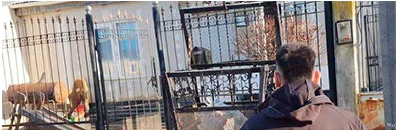
Realizan dos allanamientos en Río Grande por el robo de autopartes.