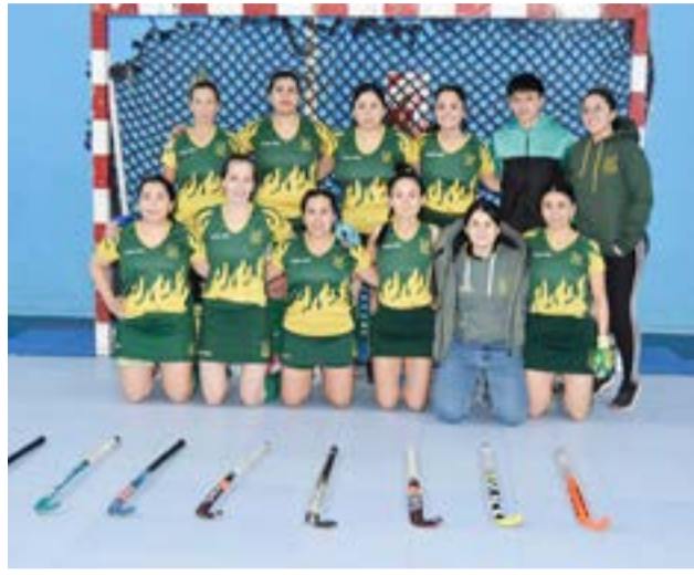
El equipo del Río Grande verde.

los espacios deportivos repletos de amigos, familiares, novios, novias, esposas, esposos y fieles seguidores de esta hermosa disciplina, qué más podemos pedir, ojala continúe así hasta fin de año, y con respecto a la sexta fecha que ya cumplimos el fin de semana, bueno, contarte que de forma simultánea diría, tanto en Río Grande como en Ushuaia, se presentaron las categorías sub-12,