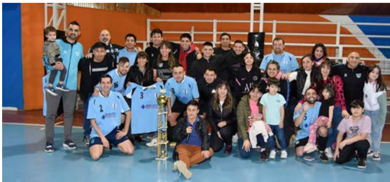
El equipo de la Secretaría de Deportes, campeón del Torneo Solidario de la Administración Pública.

“Para cerrar quiero agradecer a todos los equipos que fueron parte de esta linda causa solidaria, es impresionante la cantidad de equipos que dijeron que sí, que por cuestiones de tiempo y espacio nos fue imposible poder incluirlos a todos, que de seguro habrá una nueva oportunidad para sumarse y disfrutar de un buen momento entre amigos y familiares ya sea con otro masculino, un femenino o un mixto, ya que la idea siempre es que haya atrás una causa benéfica y más por la situación que estamos pasando hoy en la ciudad, así es que, en esta ocasión fue leche, mañana por ahí ojalá que sean pañales para el hospital, y quizás también hasta alimentos para la protectora de animales porque es una causa que hace me involucre mucho, me comprometo, yo quiero que detrás de estos eventos deportivos haya causa benéfica, entonces la gente se suma y salen estos espectáculos fabulosos, muchas gracias”, concluyó.