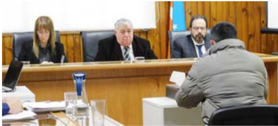
Este miércoles serán alegatos en el juicio por homicidio en Tolhuin