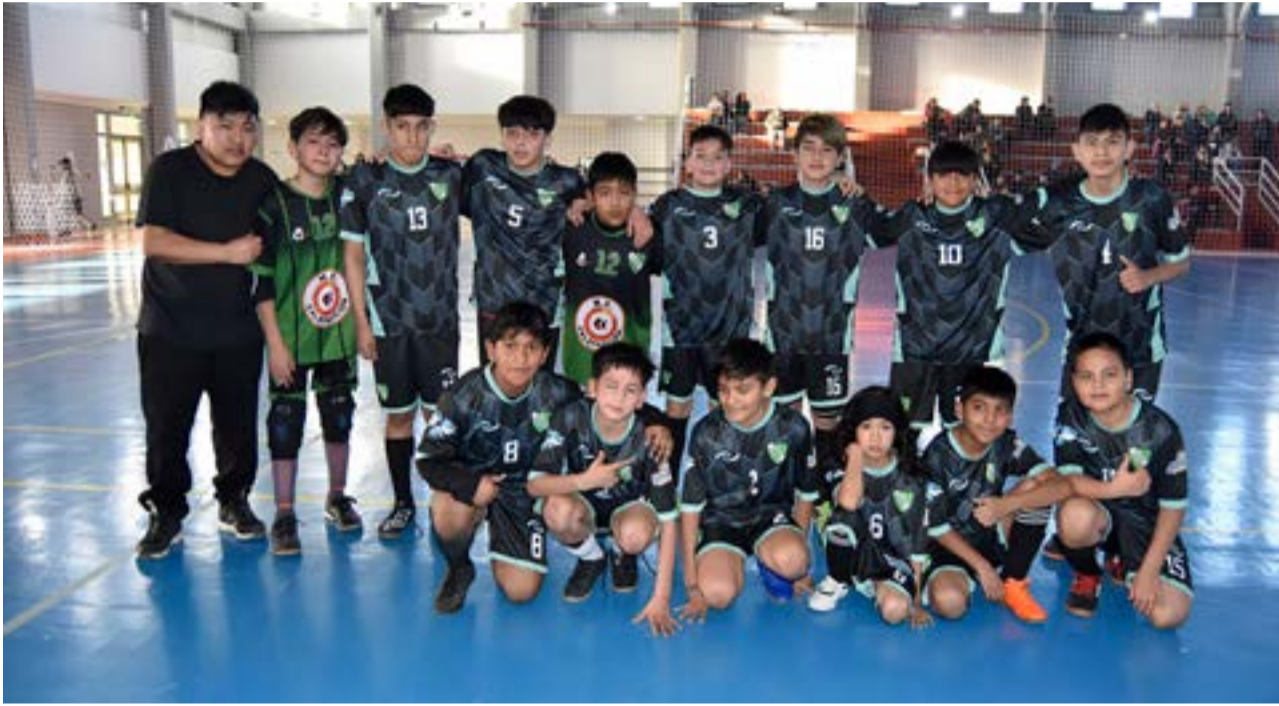
El equipo de San Francisco, 7ma división masculina.

y Azucenas en la Margen Sur, la primera fecha de la "Copa Infantil Margen Sur" en la modalidad de futsal AFA para las divisiones de inferiores.