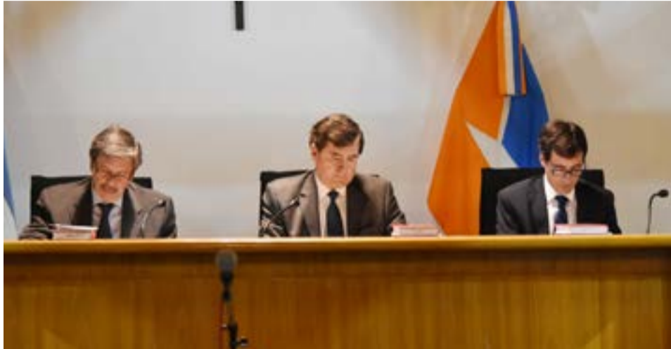
Comienza juicio por delitos de abuso sexual en Ushuaia.