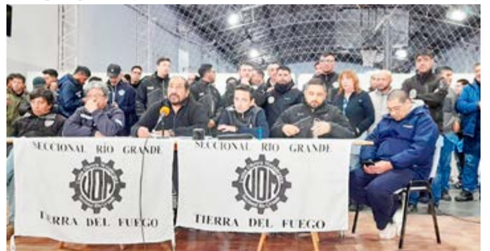
Con la firma de las y los dirigentes de la UOM seccional Río Grande, se publicó un duro documento cuestionando al senador Pablo Blanco y los diputados Santiago Pauli y Héctor Stefani.

Finalmente, con la firma de los dirigentes de la UOM Río Grande, el texto manifiesta “Insistimos en reafirmar cada acción en contra de la Política de este Gobierno Autoritario; Ajustador; Hambreador y