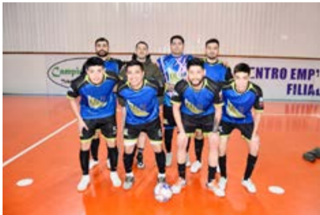
El equipo de Kalen TDF, categoría libre.

Río Grande.- Continuando con este espectacular campeonato participativo que el centro de empleados de comercio filiar Río Grande realiza ya hace varios años en la ciudad, es que el domingo 23 de junio desde las 14.00 horas en las instalaciones del complejo deportivo que está ubicado en la calle Islas Malvinas N° 998, la comisión de deportes desarrolló parte de la segunda fecha del Torneo de futsal (CAFS) "Copa Amistad CEC 2024" donde intervinieron en esta ocasión los equipos de La Fusión 24 vs. Kalen TDF, El Rejunte vs. LG, Borussia FC vs. Fire Control, DASA vs. Los Ñeri, SAIEP vs. Academia FC y Fecha Libre frente a Los Moperos en la categoría libre.