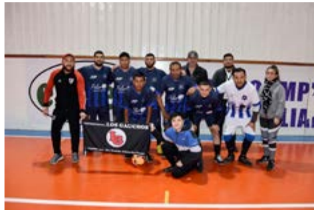
El equipo de LG, categoría libre.

¿Con respecto a la modalidad de participación, es la misma o cambió este año? Allí detalló que: "este año decidimos ya directamente que solo participen los empleados de comercio y dejamos de lado lo que serían los agremiados a otros sindicatos por una cuestión de que ya por la cantidad de jugadores y de equipos que