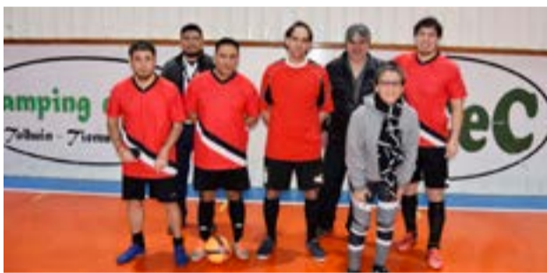
El equipo de El Rejunte, categoría libre.

23 equipos que se inscribieron para esta nueva edición que venimos haciendo ya hace 5 años en lo que sería la metodología de una copa, la Copa Amistad CEC, en