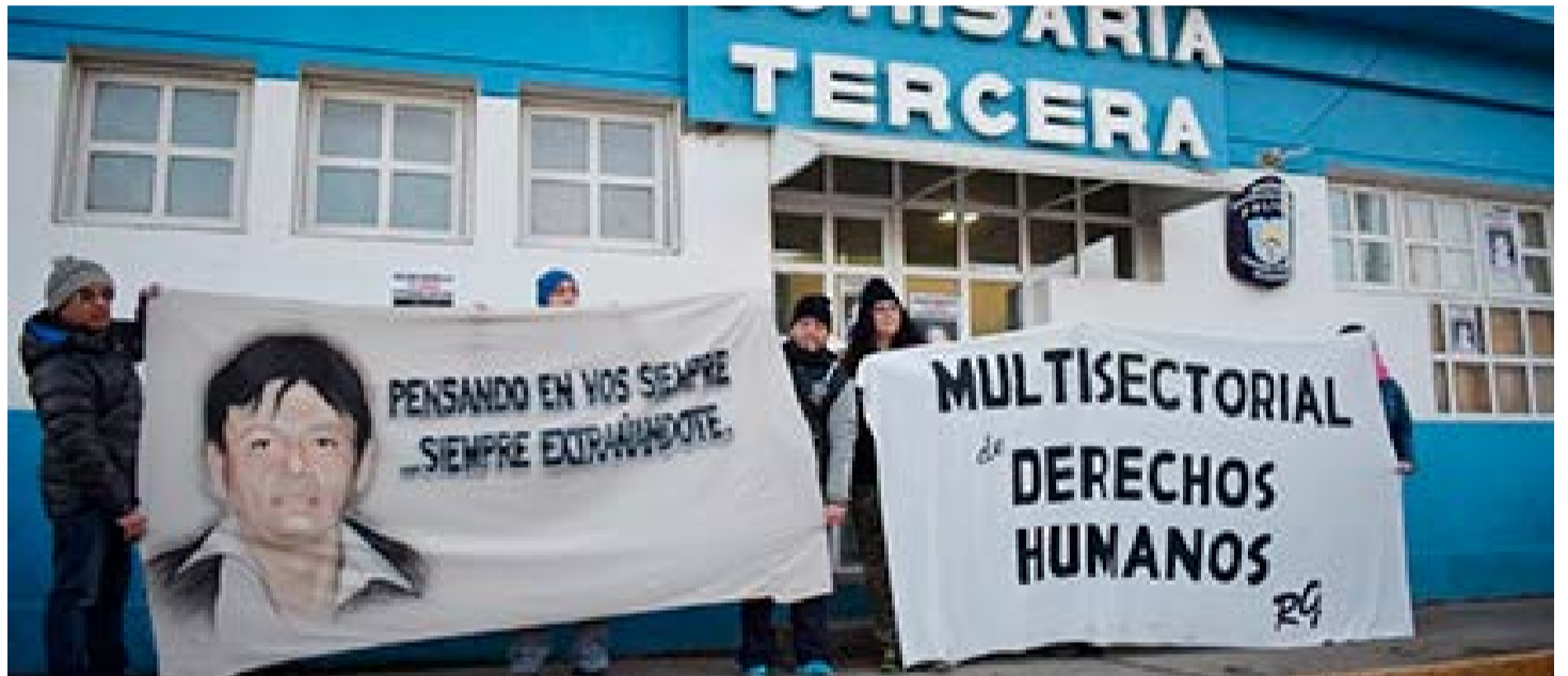
La cuñada de Oscar Vouillez, al cumplirse 20 años desde su desaparición, se refirió a la falta de esclarecimiento del hecho.

y adelantó que probablemente, cuando se cumpla el aniversario de la aparición del cuerpo, se realice algún tipo de acto para reclamar nuevamente por el esclarecimiento del hecho.