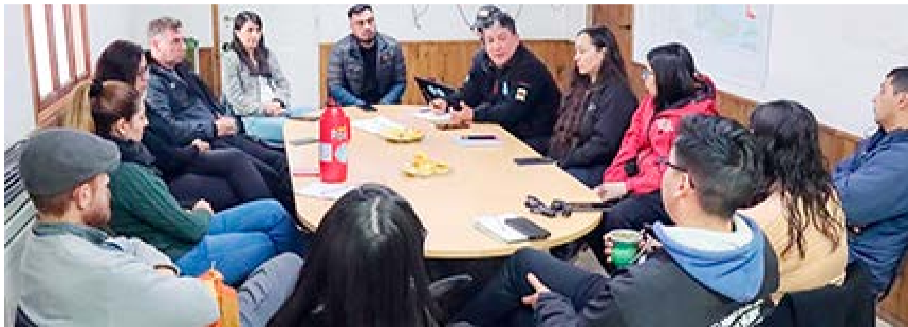
Durante las mesas de trabajo, se lograron unificar lineamientos y avanzar en la optimización de procedimientos para ofrecer respuestas más efectivas a la comunidad tolhuinense.

El Operativo Invierno 2024 busca garantizar que todas las áreas municipales estén preparadas y alineadas para enfrentar las contingencias propias de la estación fría, priorizando siempre el bienestar y la seguridad de los habitantes de Tolhuin. Con este fortalecimiento, el Municipio reitera su compromiso de estar al servicio de la comunidad, especialmente en los momentos en que más se necesita.