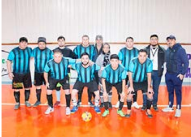
El equipo de Los Ñeri, categoría libre.

Con respecto a la participación de jugadores, ¿la condición es no estar federado? destacó que: “sabemos bien que hay muchos jugadores que juegan en AFA o en CAFS, pero también hay muchos que si se animan a divertirse, a pasarla muy bien y, por supuesto, reencontrarse con los compañeros de trabajo cada fin de semana, esa motivación nos lleva a concluir que tenemos muy buen nivel de juego en cada partido que podemos llegar a ver del campeonato, y todo esto se debe a que no ponemos ningún límite en lo que tiene que ver con