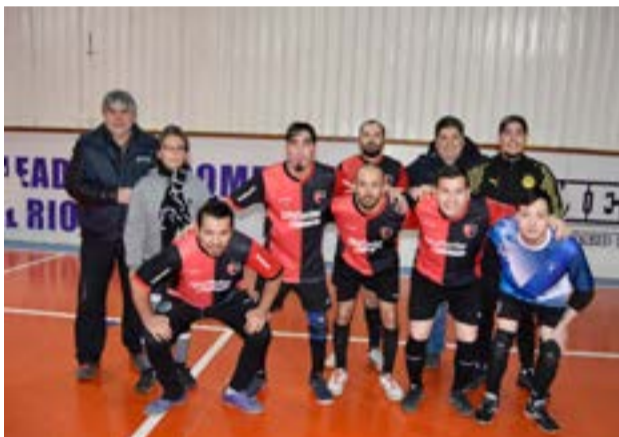
El equipo de La Fusión 24, categoría libre.

Control, ya que el objetivo de la organización es visibilizar y fomentar aún más el compañerismo y la esparcimiento entre todas las y los empleados de comercio. Consultado sobre la cantidad de equipos que participan en esta nueva edición, contó que: "actualmente tenemos