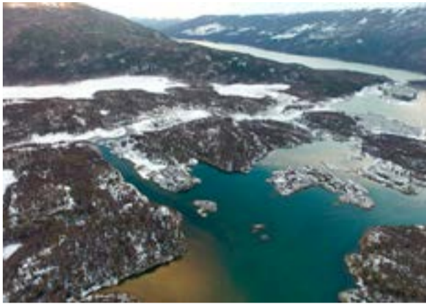
La Dirección Ejecutiva del Fondo para el Medio Ambiente Mundial (GEF por sus siglas en inglés) aprobó el concepto del proyecto "Restauración de Ecosistemas en siete áreas protegidas de la Argentina" y otorgó una subvención para su preparación.

reposición del GEF-8, enfocado en ampliar los esfuerzos para combatir la pérdida de biodiversidad, el cambio climático y la contaminación. En este contexto, se