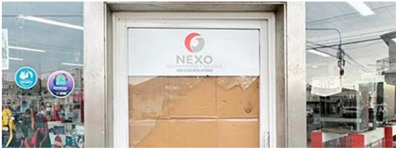
Millonario robo en una local de informática asciende a unos 13 millones de pesos.

Carro espera que las autoridades puedan dar con el responsable y prevenir futuros robos de esta magnitud.