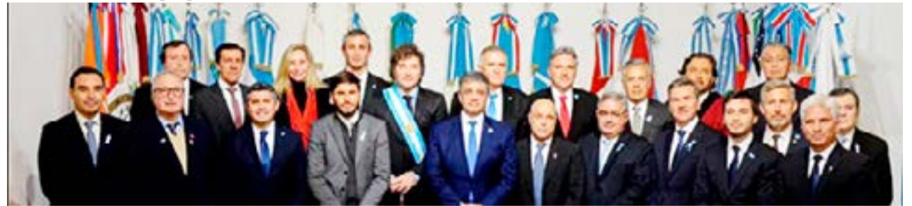
El Poder Ejecutivo tiene en carpeta una serie de normativas que se irán publicando en los próximos días, a la espera del reinicio de las discusiones parlamentarias.

Según explicaron en el entorno de Milei, la decisión de cambiarle el nombre al organismo responde a seguir una lógica de cambio de perspectiva que se busca, a partir de la cual la SIDE volverá a ser una entidad al man-