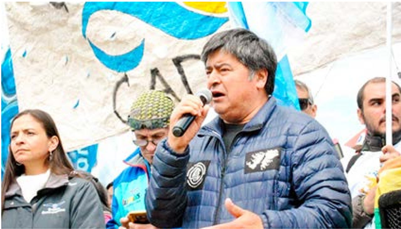
El secretario General de ATE, Carlos Córdoba, se refirió a la negociación salarial con Gobierno y otras cuestiones relacionadas con el sector estatal.

"Porque la lucha que se está discutiendo es una y para todos. Pero no pasó nada, entonces si para la salud, cuando se te está muriendo un hijo, cuando te está muriendo vos, se te está muriendo tu familia, recién vas a recurrir al sindicato, recién vas a hacer cosas o te vas a preocupar, estamos mal. Es como la Caja de Previsión, es como todo. Por eso necesitamos resolver esto lo más rápido posible y para eso tiene que estar el convenio colectivo de trabajo, para eso necesitamos juntarnos todos los sindicatos y aprovechar para, de una vez por todas, lograr el ideal para todos los trabajadores y para nuestros jubilados", concluyó el secretario General de ATE.