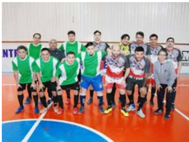
Los equipos de Fire Control vs. El Rejunte, categoría libre.