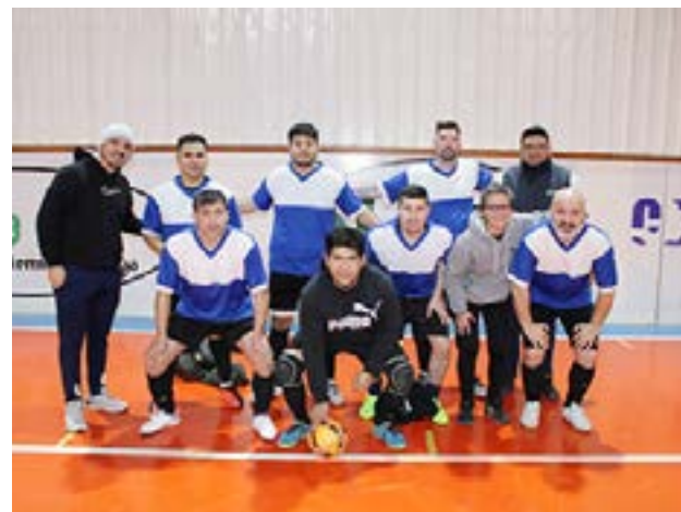
El equipo de Aston Birra, categoría libre.

“Contarte que desde el gremio nosotros siempre agradecemos que vengan, participen, disfruten y acompañen a los chicos porque en definitiva es para toda la familia mercantil lo que venimos realizando, y ojala podamos contar con más equipos que quieran sumarse a este lindo proyecto deportivo que es exclusivamente para todos los trabajadores que están afiliados al centro de empleados de comercio, ya que todos los meses tenemos eventos, ya sea para las y los hijos de nuestros afiliados, para el afiliado mismo, como así también con diversas actividades para todas las compañeras de trabajo, así es que están todos invitados, y ahora se viene