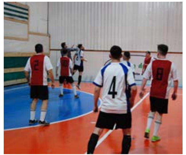
SAIEP vs. Diarco Partido 6 – categoría libre – inicio: 19.00 horas Los Ñeri vs. Academia FC

Gonzalo Gómez Borussia FC 5 Cristian Correa Borussia FC 5 Fixture Domingo 21 de julio Partido 1 – categoría libre – inicio: 14.00 horas La Fueguina vs. La Fuegoneta Partido 2 – categoría libre – inicio: 15.00 horas El Príncipe vs. Notinham Miedo Partido 3 – categoría libre – inicio: 16.00 horas Fecha Libre vs. Malvinas FC Partido 4 – categoría libre – inicio: 17.00 horas Don Agustín vs. El Hiper Partido 5 – categoría libre – inicio: 18.00 horas