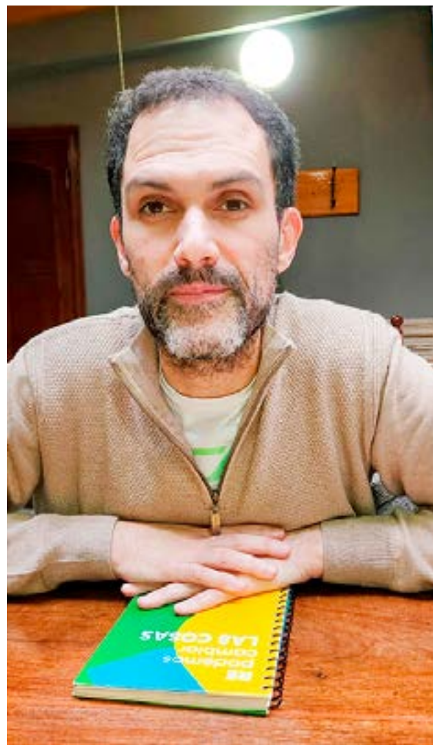
El ministro de Economía Francisco Devita visitó el programa 'Buscando el Equilibrio' en los estudios de Radio Provincia y anunció que se logró destrabar la autorización para la emisión de letras del tesoro. Se espera la autorización de los créditos con financiamiento externo para avanzar con la nueva usina de Ushuaia y el parque eólico en Río Grande.

"Respecto del modo de coparticipar, hasta el 2019 se venía coparticipando de una manera determinada y en todos los años se había liquidado más de lo que se había pagado. Siempre había una deuda a favor del municipio. A partir de 2020 el gobernador nos pidió que no hubiera diferencias políticas con ninguno de los municipios y que se coparticipe todo de la misma manera, respetando la resolución del Ministerio de Economía. A diario coparticipamos los recursos provinciales, los