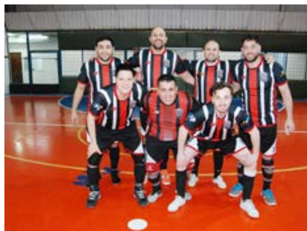
El equipo de Borussia FC, categoría libre.

“Así es que todo se está realizando acorde a lo planifi-