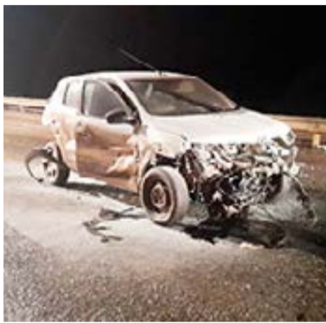
Conductor herido en violento despiste y vuelco sobre la ruta nacional 3 a la altura del kilómetro 2915.

Se labran las correspondientes actuaciones en el lugar. Participó personal de Bomberos voluntarios y Protección civil.