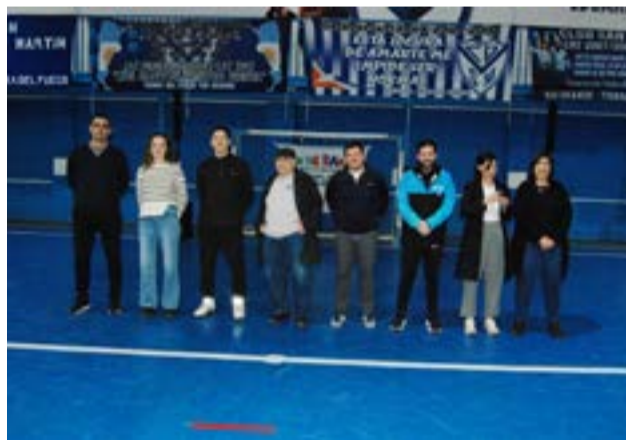
de las localidades de Punta Arenas, Río Gallegos, Río Turbio, Ushuaia y las/los riograndenses como anfitriones para este evento que superó ampliamente todas las perspectivas que trazaron hace ya dos meses desde la