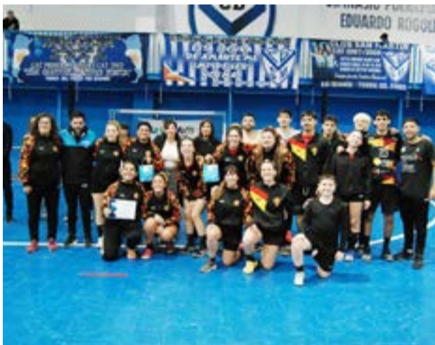
un muy buen evento deportivo que marcó un muy buen precedente por estas latitudes.