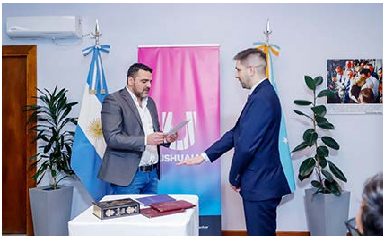
Martinco fue elegido por un Jurado de Selección mediante concurso, y su designación fue ratificada por el Concejo Deliberante a través de la resolución N° 127/2024.

La Sindicatura General fue creada por Ordenanza N° 3455 y es un órgano público que goza de autonomía financiera, funcional e institucional y tiene a su cargo el control externo, presupuestario, contable, financiero, patrimonial y legal de todas las dependencias del gobierno municipal.