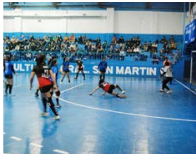
de vida en la ciudad de Río Grande, ya que club cuenta con diversas disciplinas deportivas y se destaca por su