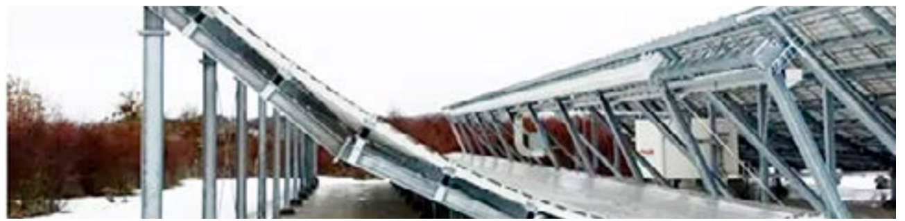
La estación terrena o radar perteneciente a las filiales británicas e irlandesas de LeoLabs, instalada en la localidad fueguina de Tolhuin.