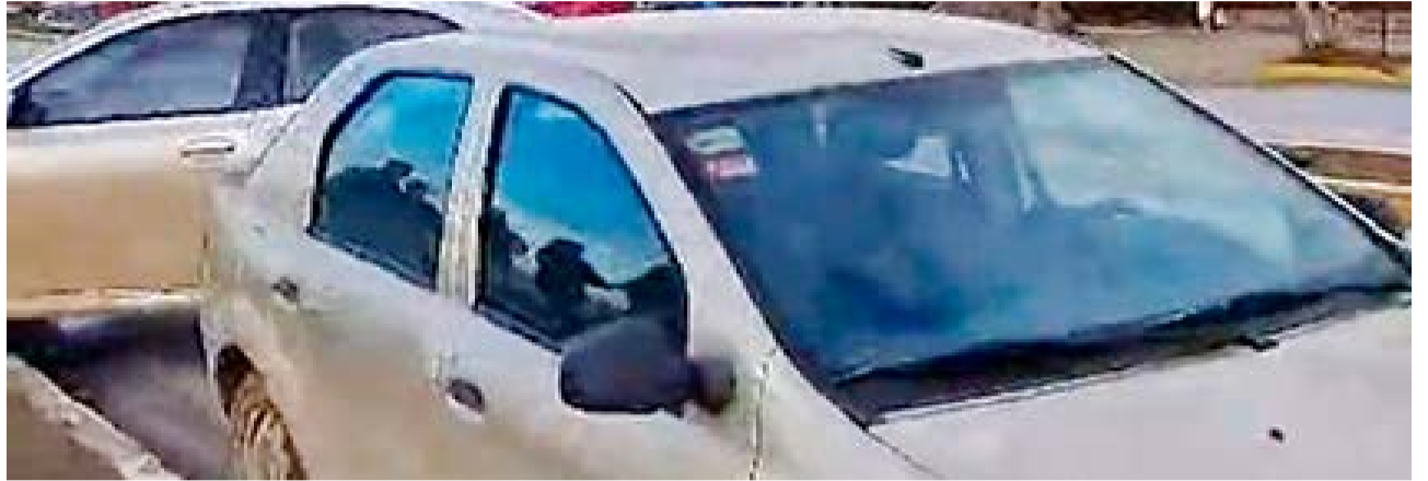
Dos choques sobre calle Güemes debido al estado resbaladizo de la calzada.

La conductora no presentaba lesiones, y además, poseía la documentación en regla.