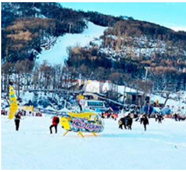
“HeliUshuaia es un proyecto que ya lleva 18 años, desde que empezamos con las alas rotativas”, dijo.

porte aéreo no regular y cualquier taxi aéreo o charter lo podría hacer. Nosotros tenemos las condiciones para