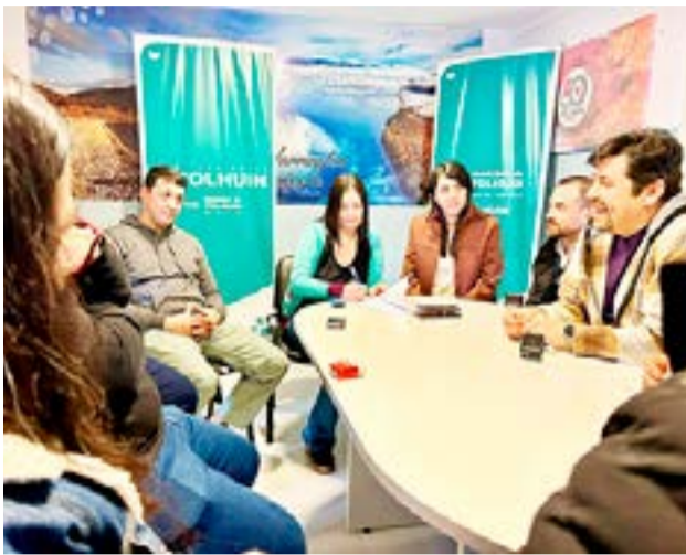
En mesa paritaria, junto a las autoridades del Municipio, los representantes gremiales de la Asociación de Trabajadores del Estado y la Unión del Personal Civil de la Nación, firmaron un convenio paritario.

Además, Cejas acotó que “lo que venimos también lo-