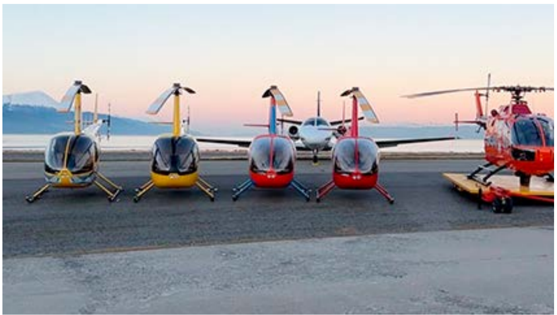
Flota de Helicópteros.

Respecto de la falta de diálogo fluido con el gobierno de la provincia, manifestó que “a nosotros nos convocan cuando hay una emergencia. El último recurso son los helicópteros y nos convocan. Nosotros, por un tema de responsabilidad social empresaria que tenemos, siempre