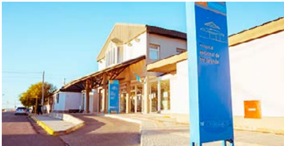
Una familia resultó intoxicada por inhalación de monóxido de carbono.

Río Grande.- A las inmediaciones acudieron efectivos policiales, Bomberos Asimismo, se hace presente el perito Bomberil de Policía, quien realizó las respectivas