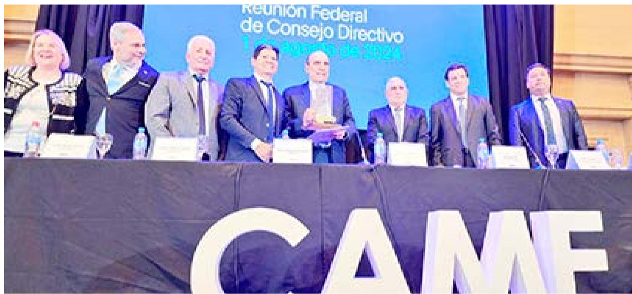
El jefe de Gabinete Guillermo Francos visitó la sede de la Cámara Argentina de la Mediana Empresa (CAME) donde se hizo la Reunión mensual Federal de Consejo Directivo.