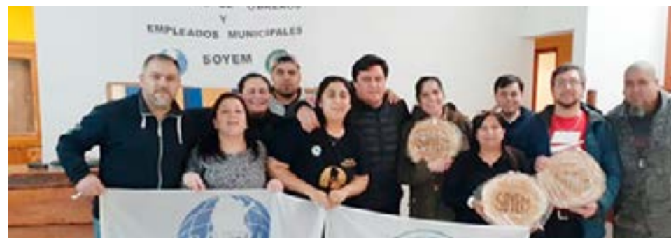
Representantes de la ASOEM de Río Grande y el SOYEM de Tolhuin, se reunieron con dirigentes de la COEMA.

que tuvimos, pudimos hablar de todo un poco, hablar de las problemáticas que tenemos en cada municipio que se asemeja. Teniendo en cuenta que la ASOEM, allá en Río Grande, estaba con algunos inconvenientes y finalmente hay una secretaria Ge-