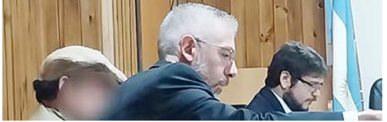
Fiscalía pidió 22 años de prisión para hombre acusado del abuso de su hijastra.

sibilidad de decir sus últimas palabras, y se estima que luego, se conocerá el veredicto.