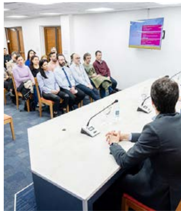
Esta instancia de Introducción a la Educación Financiera se centró en la formación conceptual de los participantes de manera virtual y asincrónica, lo que permitió a los docentes gestionar sus tiempos de estudio de acuerdo a sus necesidades, con el objetivo de brindar herramientas para manejar los recursos y poder invertir.

que “podamos finalizar esta primera etapa de Introducción a la Educación financiera junto a docentes, representantes del BCRA, del BTF, del Ministerio de Economía y del Ministerio de Educación, para formar a un gran número de docentes en la parte teórica y en una segunda instancia en el aula para nuestros alumnos”.