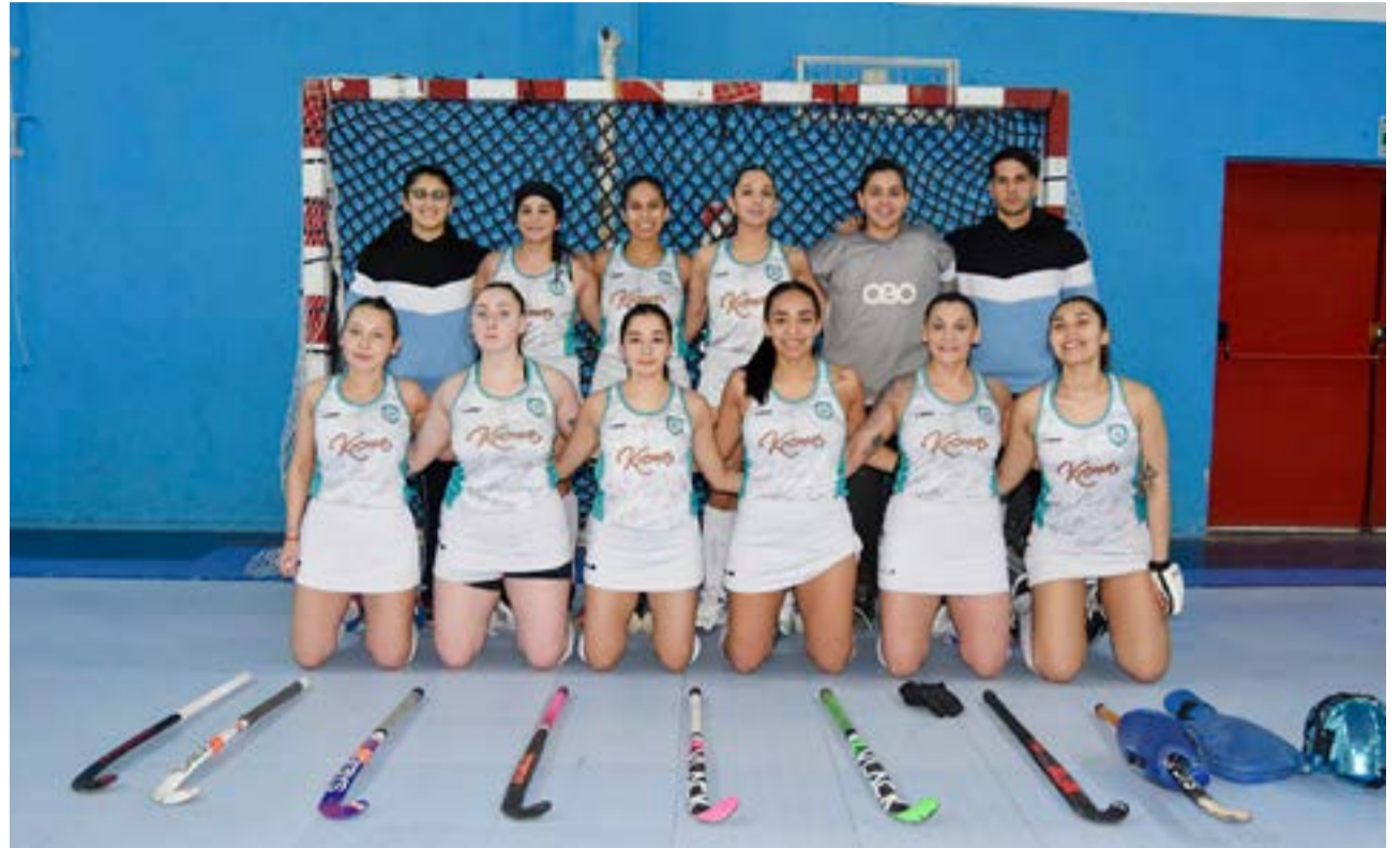
El equipo de CIMAHA, categoría Primera Damas.