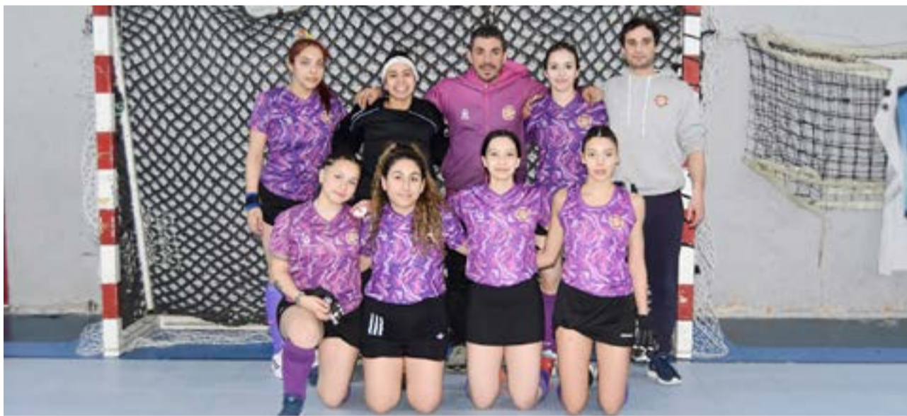
El equipo de Uaken, categoría Primera Damas.

y pista también tenemos caballeros, apostamos a los caballeros que nos han quedado sueltos por ahí, entonces tratamos de que también ellos tengan su rodaje, ya que lo hemos visto jugar en amistosos, en encuentros y en las primeras, que ellos tienen un rodaje muy corto, entonces tratamos de que se nos aceptara, que podíamos juntar entre todos los clubes, y unimos a las tres ciudades para conformar un seleccionado”.