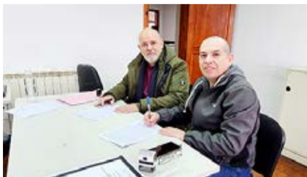
El Centro de Empleados de Comercio y la Cámara de la Ciudad de Río Grande, firmaron un acuerdo salarial para los meses de junio, julio y agosto.

ma local, una suma no remunerativa de $ 10.000, con los haberes de Julio 2024. Igualmente, una suma no remunerativa de $ 20.000, con los haberes de agosto 2024".