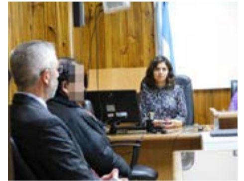
Hombre que abusó de la hija de su pareja fue condenado a 22 años de prisión efectiva.

Los fundamentos de la sentencia serán leídos el próximo 16 de agosto a las 13.