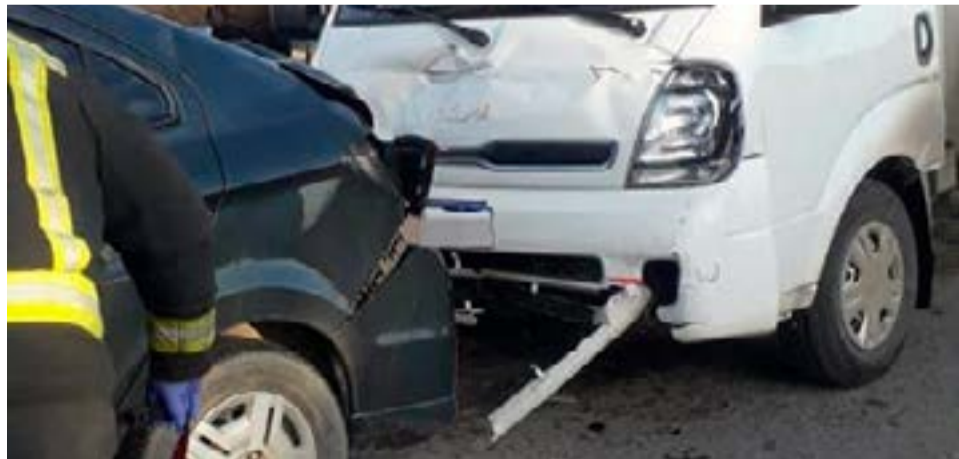
Conductor en estado de ebriedad habría ocasionado choque y una conductora resultó herida.

sencia de la ambulancia, procediendo al traslado de la misma a sede hospitalaria para su atención médica, donde posterior se conoció que presentaba lesiones