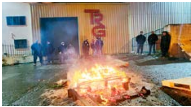
Trabajadores de Textil Río Grande, acompañados por la Asociación Obrera Textil, se manifestaron frente a la planta fabril, después que la empresa les dijera que no pueden pagar el porcentaje de salarios que venían abonando desde que están suspendidos.

Tenemos seis fábricas bajo nuestra representación en Río Grande. Todas están trabajando, excepto Barpla, que enfrenta problemas judiciales, pero la situación es