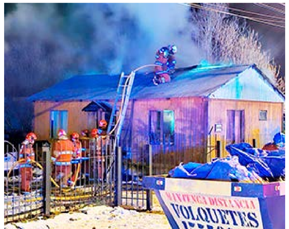
Principio de incendio en una casa de Ushuaia.

momentos antes al estar cocinando se produjo una ebullición de aceite el cual hizo contacto con la hornalla, ocasionando una aceleración, consecuentemente produjo