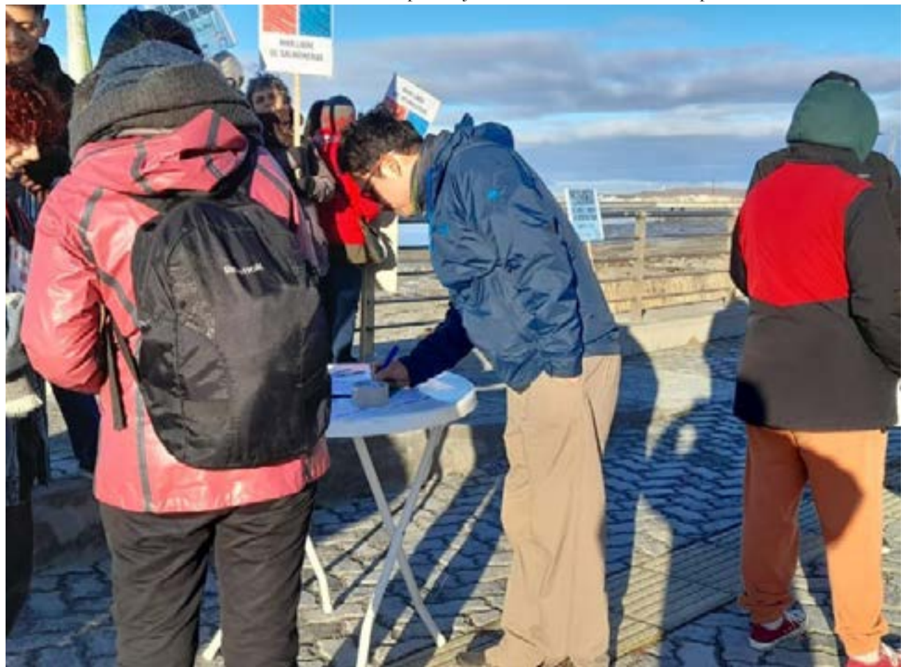
Durante la jornada de ayer se llevó adelante una nueva edición del Atlántico en la provincia, en coincidencia con otras ciudades costeras desde Buenos Aires hacia el sur.

la provincia, en el cual nos referimos al proyecto este del cultivo de salmónidos y de acuicultura en general. Justamente es eso, la idea es pronunciarnos en contra