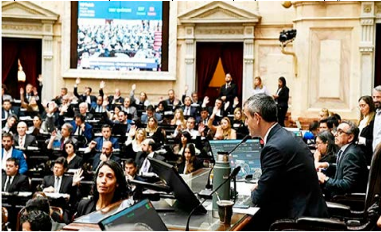
El Poder Ejecutivo avanza con la implementación de la normativa que contempla las reformas que el presidente Javier Milei impulsa desde su llegada a la gestión.

Uno de los principales puntos que establece el decreto es que, de ahora en más, para trabajar en el Estado se deberá aprobar una "Evaluación General de conocimientos y competencias, diseñada y reglamentada a