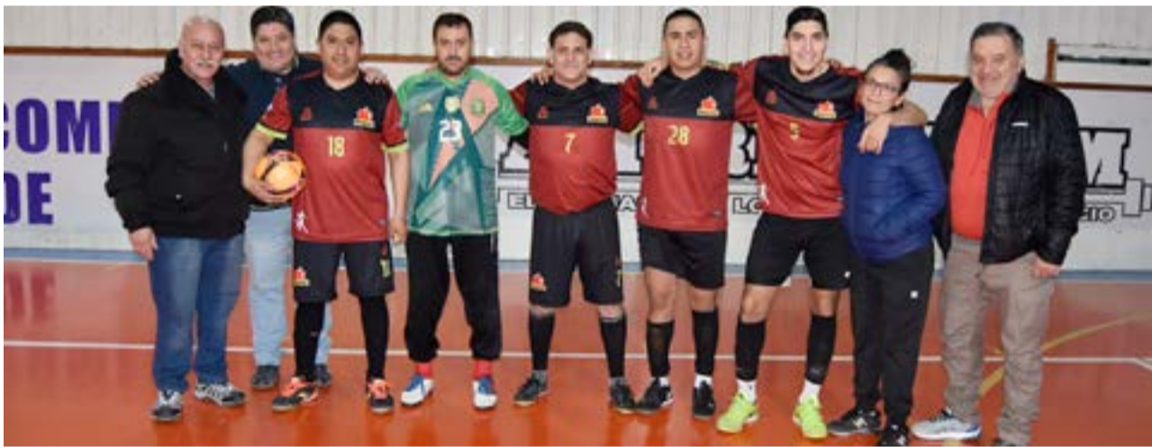
El equipo de Diarco FC, categoría libre.

numerosos comercios y/o empresas de nuestra ciudad, donde transitaron nuevamente un especial evento por excelencia y que para esta oportunidad fue exclusivamente para afiliados al gremio y que tuvo una muy buena participación de nuevos equipos y jóvenes jugadores que disfrutaron de muy buen agrado este campeonato. Destacando además desde la organización el muy desarrollo del evento que contó en cada fecha a la gran familia mercantil que hasta hoy día sigue fiel e incondicional seguidora de cada evento que el centro de empleados de comercio realiza para sus afiliados y ya proyectando actividades para lo que resta del año con sorpresas y muchas actividades más que serán el deleite de todos, felicitaciones y a continuar así.