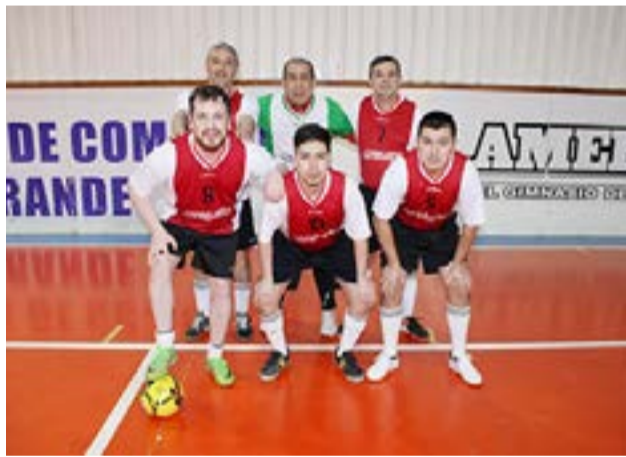
El equipo de Notinham Miedo, categoría libre.

“También quiero destacar que para esta nueva edición que actualmente estamos desarrollando, venimos observando que en cada partido que se disputa, y como dije anteriormente, la presencia de familiares, amigos y fieles