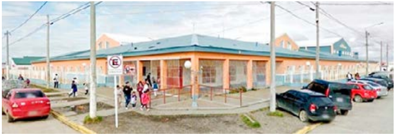
Ayer, nuevamente, no hubo clases en la Escuela 4 de la zona de la margen sur del río Grande.

También mencionó que "se evaluó la posibilidad de reforzar actividades pedagógicas" para mantener a los niños conectados con su educación, durante esta crisis.