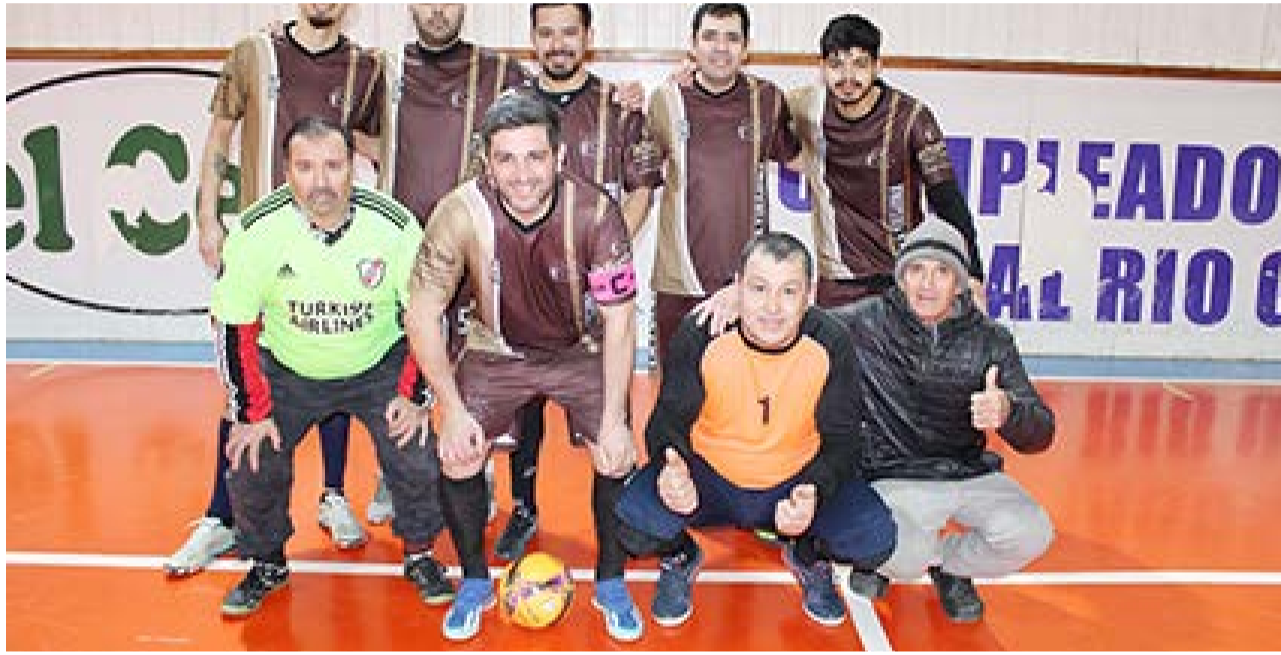
El equipo de La Fuegoina, categoría libre.