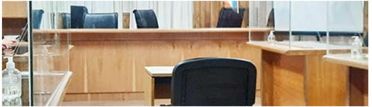
Todos los juicios de agosto serán por delitos contra la integridad sexual

Cabe mencionar que, en todos los casos, actúa la Fiscalía Especializada en Género, en tanto que, la Presidencia del Tribunal irá variando, como así también podría haber subrogancias en caso que alguno de los jueces, haya actuado en otras instancias del proceso.