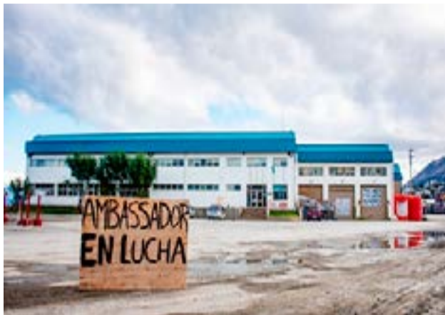
Al cumplirse los 18 meses del contrato que les hizo el Grupo Mirgor, las trabajadoras y trabajadores que pertenecieron a la empresa Ambassador Fueguina quedaron definitivamente desempleados.

Pero lo que más molestó a quienes resultaron desvinculados, fue la falta de un contacto personal con algún representante del Grupo que adquirió la planta, durante