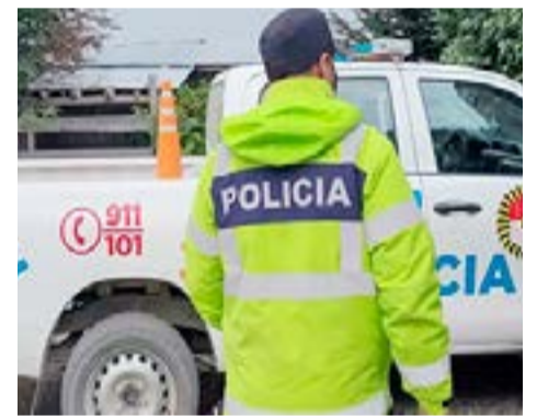
Joven atacada a machetazos: Allanaron domicilio del agresor y fue notificado de derechos y garantías.

orden de allanamiento para el domicilio ubicado en Cabo San Sebastián al 500. El allanamiento se llevó a cabo con resultado positivo, procediéndose al secuestro de elementos de interés para la investigación. Asimismo, se le notificaron sus derechos y garantías al imputado".