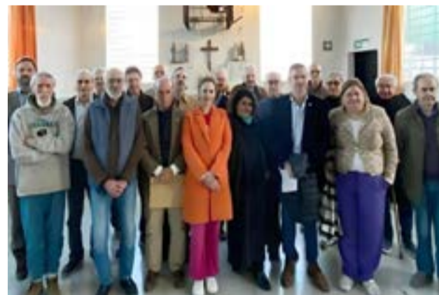
La Multisectorial se pronunció respecto de la visita de un grupo de diputados y diputadas a los genocidas presos.

nes fueron elegidos como representantes del pueblo se hayan reunido con los dictadores que atentaron contra la democracia y que hoy se encuentran cumpliendo condena por perpetrar delitos de lesa humanidad”, remarca el texto.