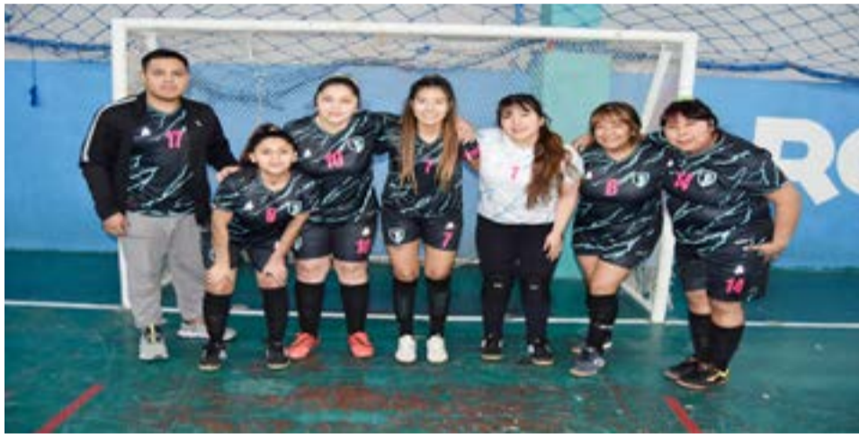
El equipo de Deportivo Sur, primera división zona “B”.