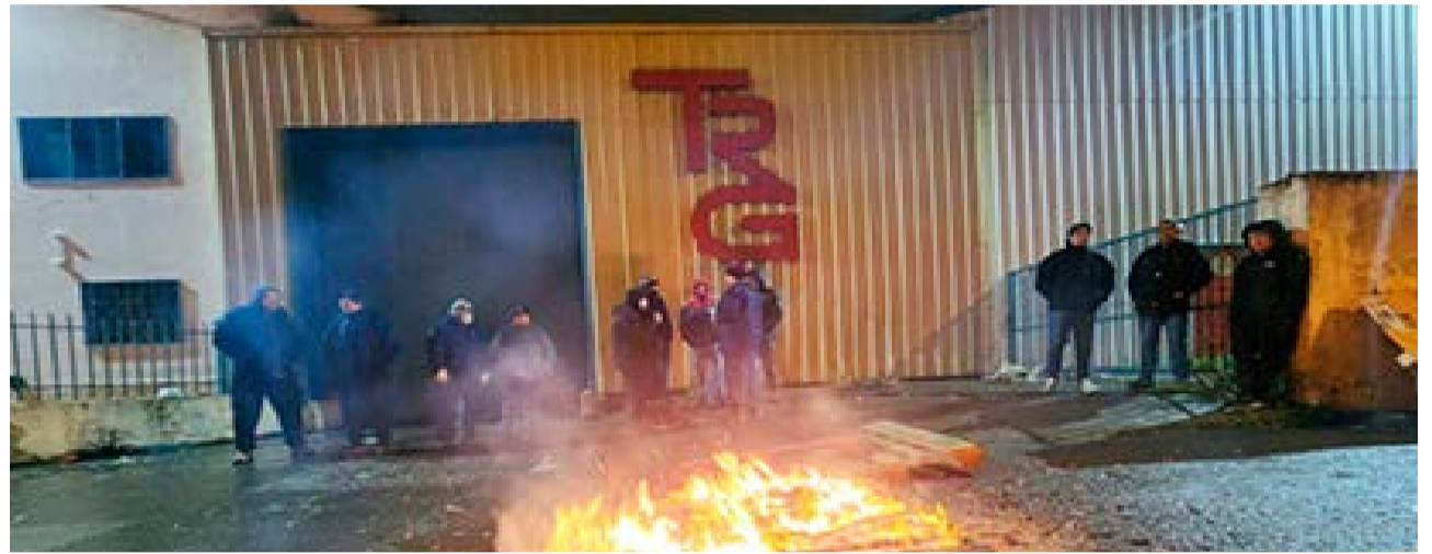
La empresa Textil Río Grande no se presentó en la audiencia convocada en el Ministerio de Trabajo de la provincia, mientras tanto los trabajadores siguen sin cobrar sus haberes.

angustiados con esta situación, porque se los ha llevado a una disyuntiva, o aceptan el pago de una indemnización reducida en cuotas o siguen en la calle sin percibir salarios”. Rubio dijo que “los trabajadores hacen un paralelismo con lo que pasó con otras empresas, como Yamana del Sur, y están muy preocupados por ese tema y no quieren terminar en la misma situación”. “Hoy al menos, el sindicato lo que ha manifestado su voluntad de tratar de combatir esto, denunciarlo y que lo investigue el Ministerio de Trabajo. Se ha pedido