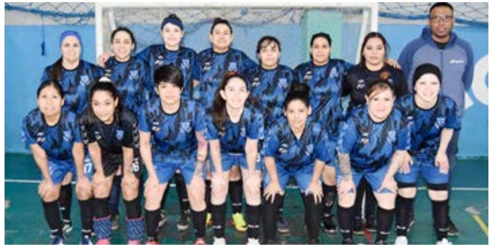
El equipo de A.A.T.E.D.Y.C., primera división zona “B”.

nuestra ciudad, es que el domingo 11 de agosto desde las 16.30 horas en las instalaciones del gimnasio Juan Manuel de Rosas, se enfrentaron los equipos de Patagonia vs. Deportivo Sur, Juventus vs. A.A.T.E.D.Y.C., Atlanta vs. Sol Naciente, Spordivas vs. Atlético RG, y cerró la jornada Unión Austral se enfrentó a Libertad.