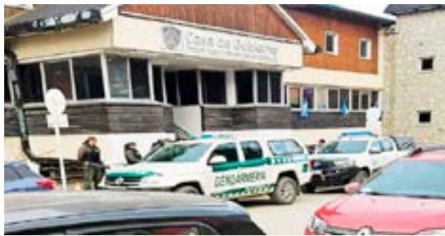
Gendarmería Nacional allanó la Casa de Gobierno en el marco del llamado a elecciones constituyentes

No se emitió información oficial ni de la Justicia, ni de Gendarmería.