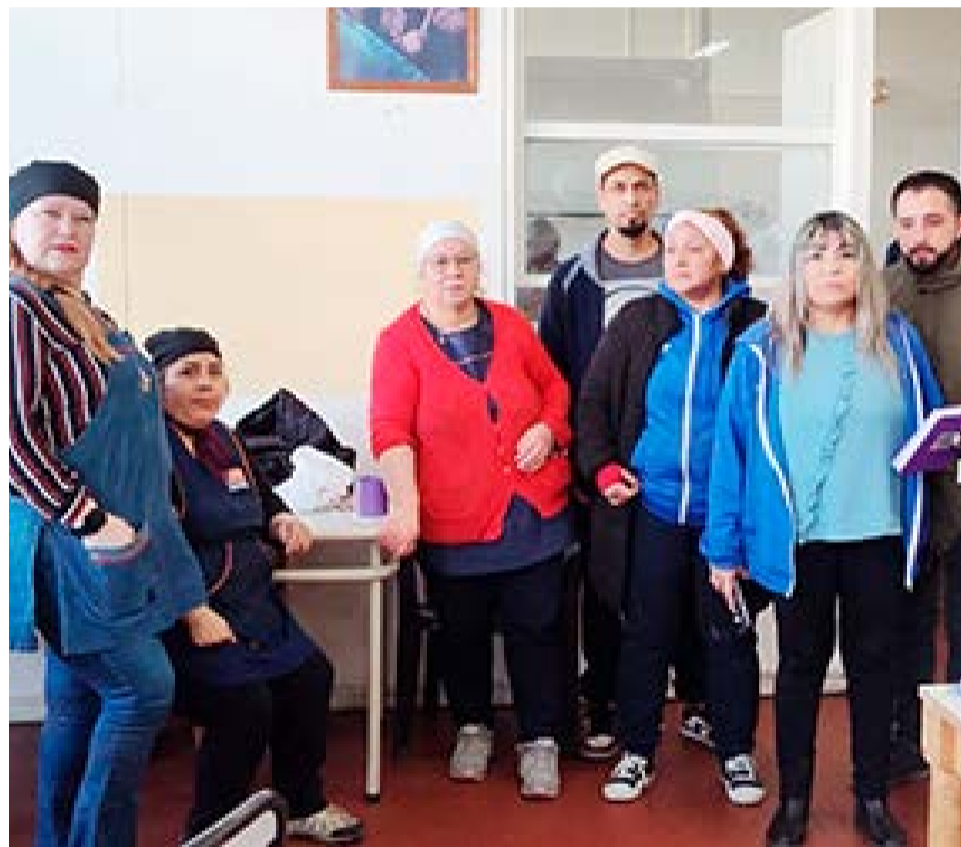
Desde ATE aseguraron que, luego que los trabajadores y trabajadoras de planta se negaron a seguir calentando agua para lavar los utensilios de la cocina por la falta de agua caliente, ayer los reemplazaron por personal que es planta política e integrantes de cooperativas.

En el mismo sentido, remarcó que "es gravísimo lo que está pasando. Nosotros vamos a hacer la denuncia en el Ministerio de Trabajo, ahora nos estamos dirigiendo a hacer la denuncia, porque entonces quiere decir que en cualquier lugar va a venir otra persona y va a de-