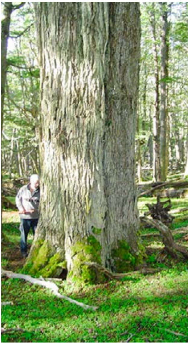
Este árbol de lenga de 400 años

es algo que decidamos nosotros, sino que es un acuerdo que las provincias firman y se aplica una polinómica por superficie de la provincia y porcentaje de bosques. Cada provincia tiene un porcentaje y estimo que el valor debe estar en los 200 millones de pesos. Todavía no está depositado el fondo de 2024 hasta que no estemos desembolsando el 2023", explicó.