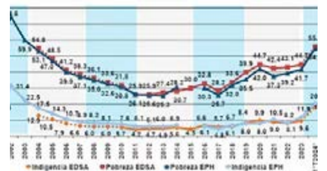
Evolución de la tasa de pobreza e indigencia desde 2001 (ODSA).

EVOLUCIÓN DE LAS TASAS DE INDIGENCIA Y DE POBREZA URBANA A PARTIR DE EDAD LABORAL (1º TRIMESTRE Y 1º BIMESTRE 2024 ENTRENADO) Y TAMBIÉN EPHE EN LOS PRIMEROS TRES MESES DEL AÑO (2001-2024) EN UN POR CIENTO DE PERSONAS.