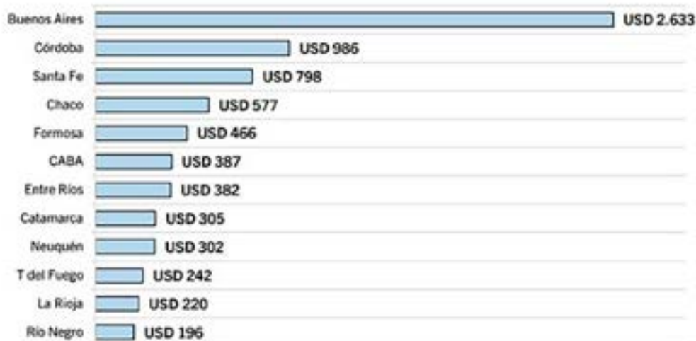
Gráfico 3. Recorte del gasto público, por distrito, expresado en dólares. Acumulado 2º trimestre 2024