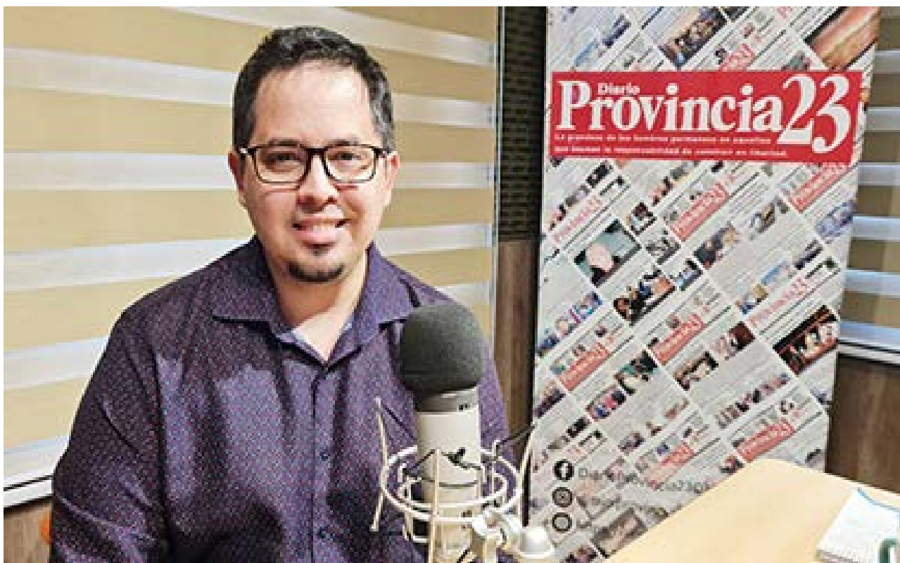
El diputado nacional de La Libertad Avanza Santiago Pauli visitó el programa ‘Buscando el Equilibrio’ en los estudios de Radio Provincia y aseguró que en el presupuesto nacional no se ven afectados los intereses de Tierra del Fuego.

Advirtió que para aplicarla en la provincia sería necesaria una enmienda constitucional. “Tiene un componente extra que es que en Tierra del Fuego el sistema electoral está dentro de la Constitución provincial. Esto requiere reformar un artículo de la Constitución pero no hace falta llamar a una reforma, porque si tiene mayoría la Legislatura se hace un referéndum y la gente vota. Es importante para ver si esto le interesa o no a la gente. Si la gente no lo vota, es porque no le importaba. Yo creo que es un tema que ayudaría a mejorar la calidad democrática de la provincia y vamos a ver qué dicen los otros legisladores”, concluyó.