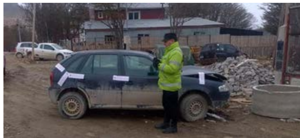
Chocó contra un poste mientras transitaba en estado de ebriedad.

Se solicitó personal de tránsito, quienes realizaron el alcotest, arrojando resultado positivo con 2.78 g/l, por lo que se labró la multa correspondiente. Asimismo, se procedió a la aprehensión de Quispe por infracción al Art. 120 de la Ley 1024, por último personal municipal procedió a incautar dicha unidad.