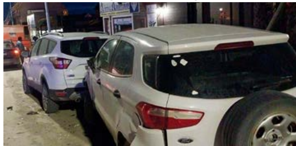
Conductor en estado de ebriedad chocó a otros dos automóviles estacionados en calle Yaganes.

De igual forma el rodado Fiat fue trasladado por personal de tránsito al predio municipal.