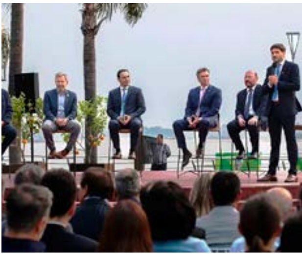
Mandatarios de distinto signo político y con posturas diversas frente a la administración de Javier Milei firmaron ayer por la tarde en la localidad correntina de Bella Vista una declaración conjunta. En el documento, se establece la voluntad de todas las jurisdicciones de crear una nueva Región, conforme lo prevé la Constitución Nacional de 1994.

Más tarde, los gobernadores mantuvieron una reunión a puertas cerradas, tras la cual se firmó un acta. Se trató del "Acuerdo de Hermanamiento", entre todas las provincias representadas, rubricada a las 16 en la Costanera de Bella Vista. El cierre de actividades fue con una recorrida por una planta procesadora de frutas.