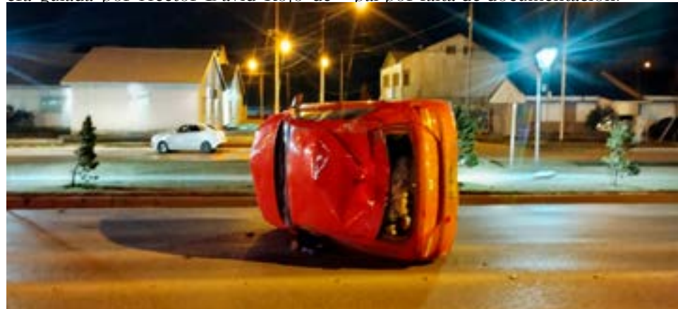
Conductor circulaba en estado de ebriedad y volcó sobre calle 20 de junio. No hubo heridos.

Posteriormente, se trasladaron los rodados Golf y Gol al corralón municipal por falta de documentación.