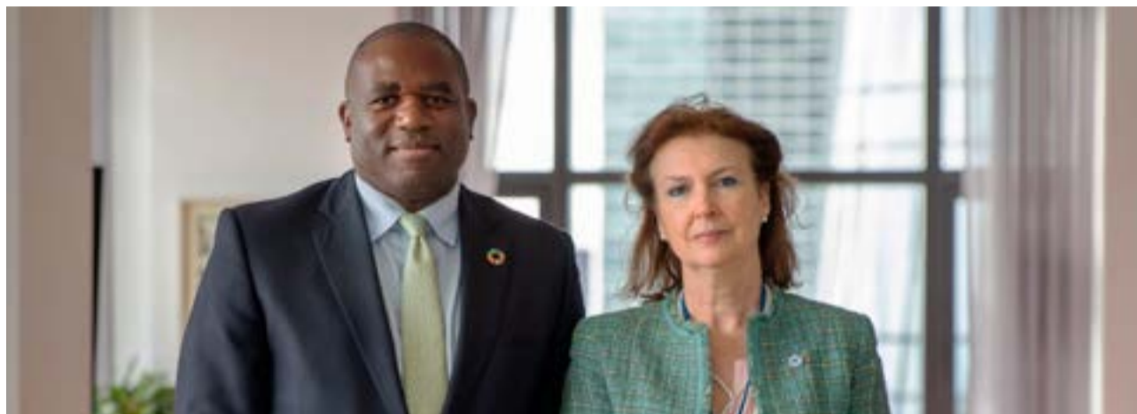
La canciller argentina Diana Mondino se reunió con su par de Reino Unido, David Lammy, en Nueva York y acordaron la reanudación del vuelo que se hacía entre las Islas Malvinas y Córdoba hasta 2018 y que el gobierno de Alberto Fernández había suspendido.

En julio de 2022 se retomó el vuelo regular desde Punta Arenas a las Malvinas, con una escala mensual en Río Gallegos. Pero no se registraron avances desde ese momento para que haya un vuelo que saliese o que al menos tocara suelo argentino.