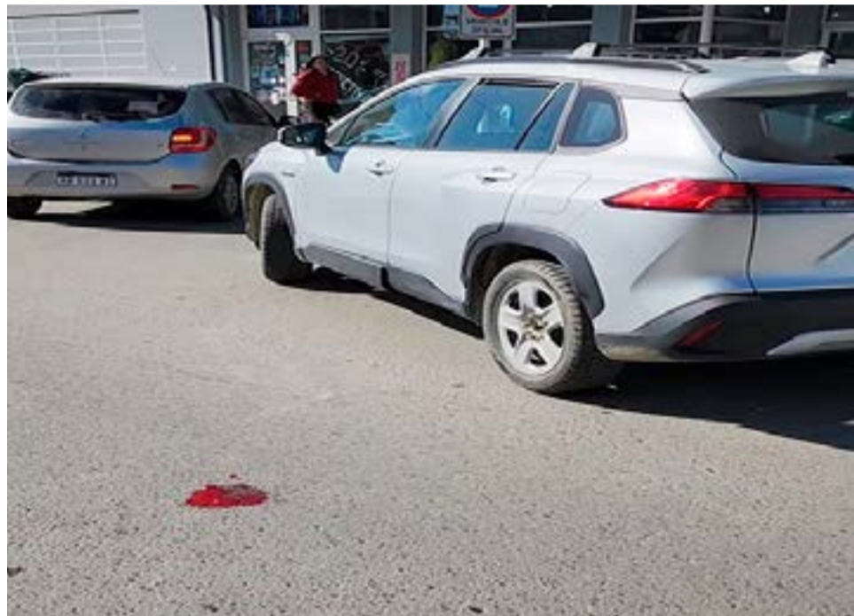
Un hombre fue atropellado accidentalmente por su esposa y terminaron hospitalizados.

pitalizada debido al estado de shock que presentaba