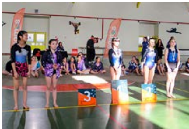
3 LAS ÁGUILAS