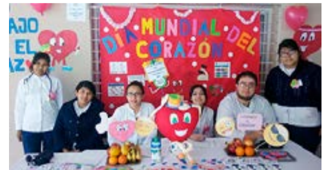
Desde el año 2000, el 29 de septiembre se conmemora el "Día Mundial del Corazón".

"Es preciso conocer nuestros números: el peso y el