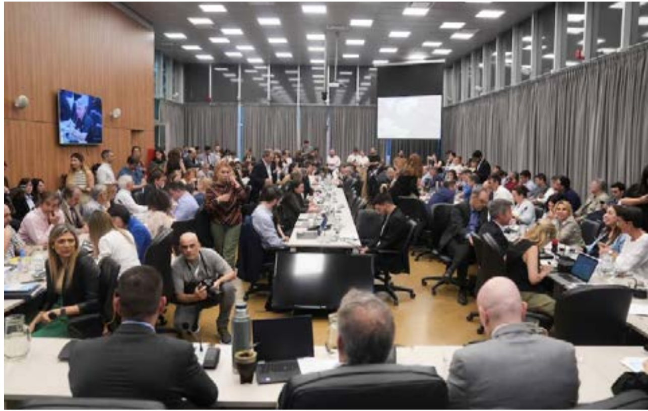
Un plenario de tres comisiones de Diputados dictaminó este lunes los cambios que realizó el Senado a la Boleta Única de Papel (BUP) y la ley podría ser sancionada hoy, en la sesión que tiene pensada la Cámara baja, desde las 11.30.

Luego, la macrista y usual aliada libertaria Silvia Lospennato mencionó a legisladores que impulsaron años atrás y en soledad este tipo de iniciativas. Esto no gustó mucho en el radicalismo y se lo hizo saber Karina Banfi.