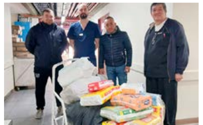
Trabajadores de la administración pública provincia y municipal de Río Grande, concretaron la donación de más de 2000 pañales para el Hospital Regional de Río Grande y el Centro Infantil Integrado.

Cooperativa Eléctrica y Otros Servicios Públicos de Río Grande Limitada