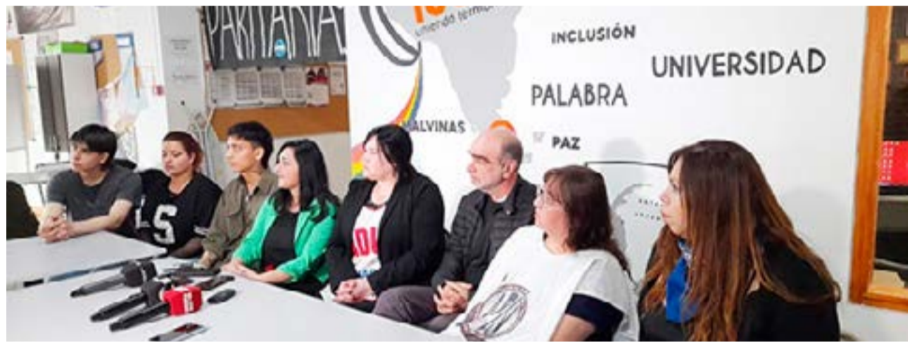
Con sendas conferencias de prensa en simultáneo, en las ciudades de Ushuaia y Río Grande, se convocó para este miércoles a marchas en defensa de las universidades y de la educación públicas.

Vale mencionar que, en el caso de Río Grande, la