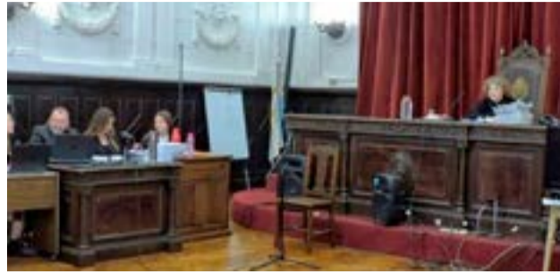
Condenaron a 42 años de prisión a un hombre que abusó de sus dos hijas en Ushuaia y Punta Alta. El padrino de una de las víctimas, también recibió una pena de 24 años de prisión.

El jurado encontró culpable al padre de abusar de manera carnal de una de sus hijas entre los años