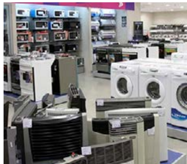
El ministro de Economía Luis Caputo confirmó la baja de aranceles para importar 89 productos, entre ellos plásticos PET e hilados. Las posiciones arancelarias incluyen desde bienes finales hasta importantes insumos y bienes de capital.

A partir de esta rebaja, las motos importadas pasarán