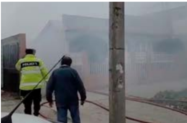
Vivienda ubicada en calle 9 de julio al 1100 fue consumida por las llamas. Por fortuna no hubo heridos.