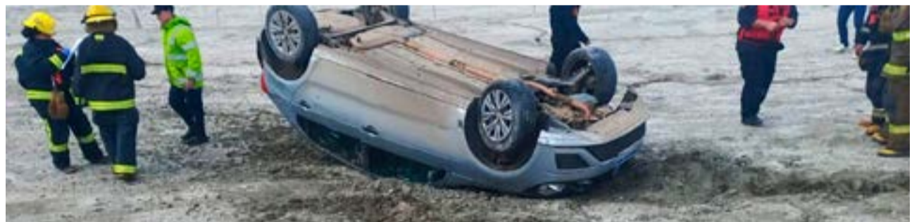
Vuelco en circunvalación sin heridos.

A modo preventivo, se solicitó la ambulancia, la cual trasladó a la conductora al nosocomio local. Colaboró en el lugar personal de la División Bomberos de Policía y Bomberos Voluntarios. Se labran actuaciones.