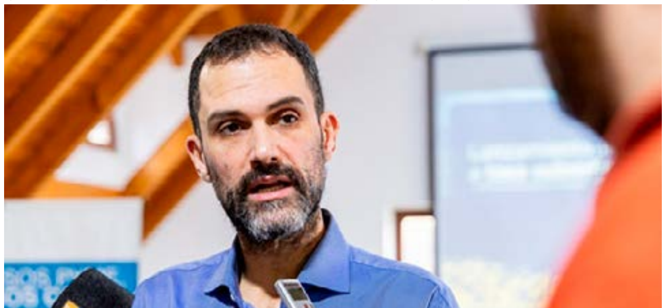
El ministro de Economía Francisco Devita dio un giro en el discurso luego de conocerse el recorte de 100 mil millones a Tierra del Fuego, casi equivalente a un presupuesto municipal, y volvió sobre la necesidad de ajuste a las municipalidades.

Los municipios ya se manifestaron sobre el recorte que se desprende del artículo 23 de proyecto de presupuesto, que representarían cinco mil millones