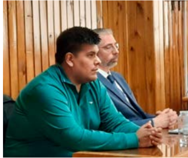
El Tribunal de Juicio del Distrito Norte consideró que: “El descargo de Nieva es un montón de mentiras”.

Asimismo, el escrito indica que “no cabe duda que todo fue un engaño orquestado para quedarse con el dinero de los damnificados, porque el esquema