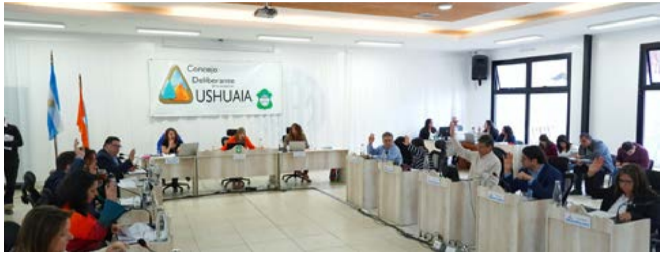
Esta medida del municipio, busca aliviar la carga fiscal sobre los comerciantes locales y fomentar un entorno más favorable para la actividad económica.

El proyecto destaca la jerarquización del turismo como Política de Estado, la creación de un ente público con financiamiento externo y la eliminación de tasas a comercios e industrias.