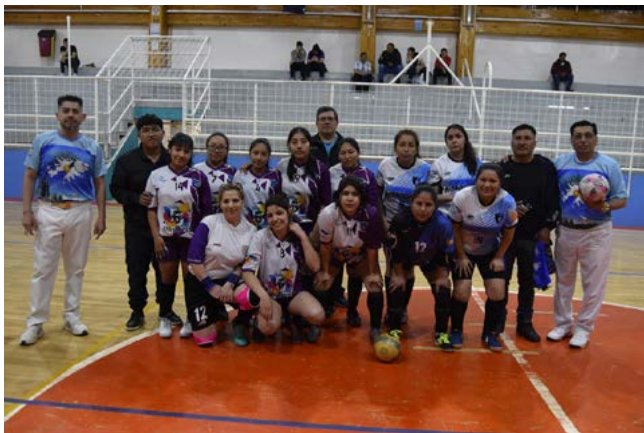
Los equipos de Deportivo Patagonia y Deportivo Libertad, primera división “B”.

Partido 3 – primera división “A” – inicio: 19.00 horas