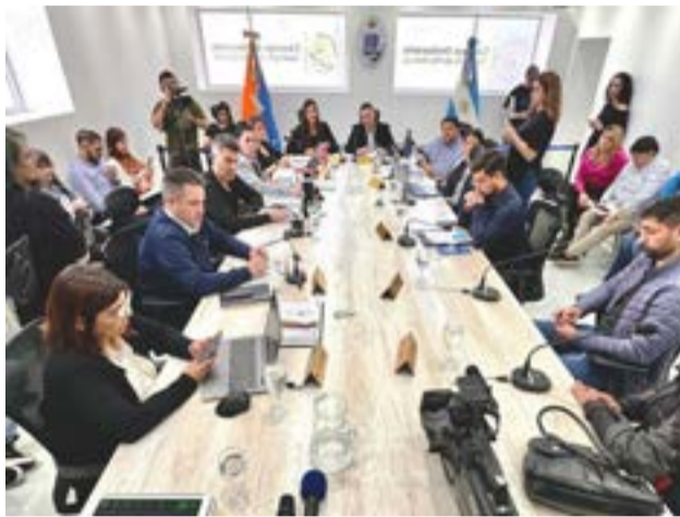
El Cuerpo de Concejales realizó ayer la reunión de Comisiones del corriente mes.