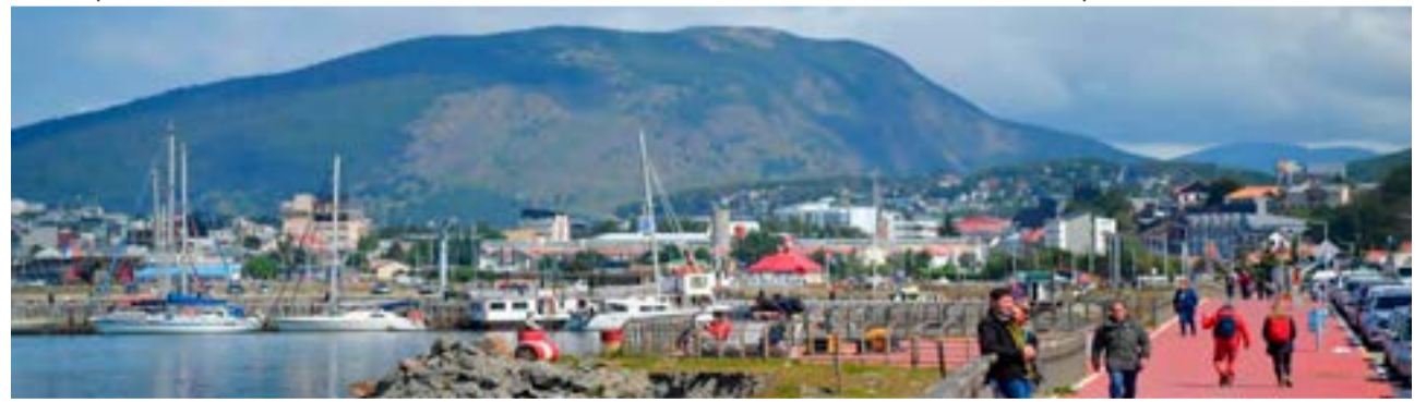
"Entendemos que en verano la situación va a ser bastante parecida a la del invierno y vamos a estar abajo con respecto al año pasado. El turismo nacional se ha resentido, por lo menos en destinos alejados como Ushuaia, y el turismo europeo ha disminuido en las reservas. Esto no significa que va a ser algo certero, ojalá no lo sea, pero es lo que vamos viendo en cuanto a reservas", dijo.

Con respecto al anuncio del intendente Vuoto sobre la construcción de un hotel de cuatro estrellas en Ushuaia, consideró que no hay que temerle a la competencia. "Vi el anuncio y hay varios proyectos dando vueltas en la ciudad, de hoteles y cadenas que quieren desarrollar sus proyectos en nuestra ciudad. Todo lo que viene que sea de calidad, bienvenido sea. Es importante que tenga salón de reuniones, porque el turismo de reuniones es alentador para un destino. Se publica en temporadas bajas o medias para mantener la cantidad de ocupación en los hoteles", sostuvo.