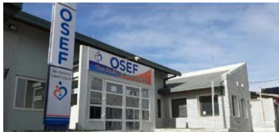
La progenitora reclamó a OSEF la compra de insumos necesarios para su subsistencia, conforme a lo que sus médicos tratantes le recetaron y prescribieron, por lo que solicitó su compra en el mes de febrero de 2024.

la normativa vigente, y le entreguen los suplementos médicos necesarios para que la menor pueda continuar con sus