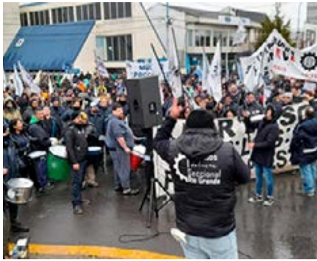
La UOM seccional Río Grande, en Congreso de Delegadas y Delegados, decidió reclamar a la cámara AFARTE “la inmediata apertura de paritarias con el objeto de discutir continuidad laboral y recomponer salarios”.

En otro de los puntos, la resolución indica que, “A 15 años del logro importante de la Unión Obrera Metalúrgica, plasmado en la Ley 26.539, que fuera reclamada, impulsada y defendida por nuestra organización