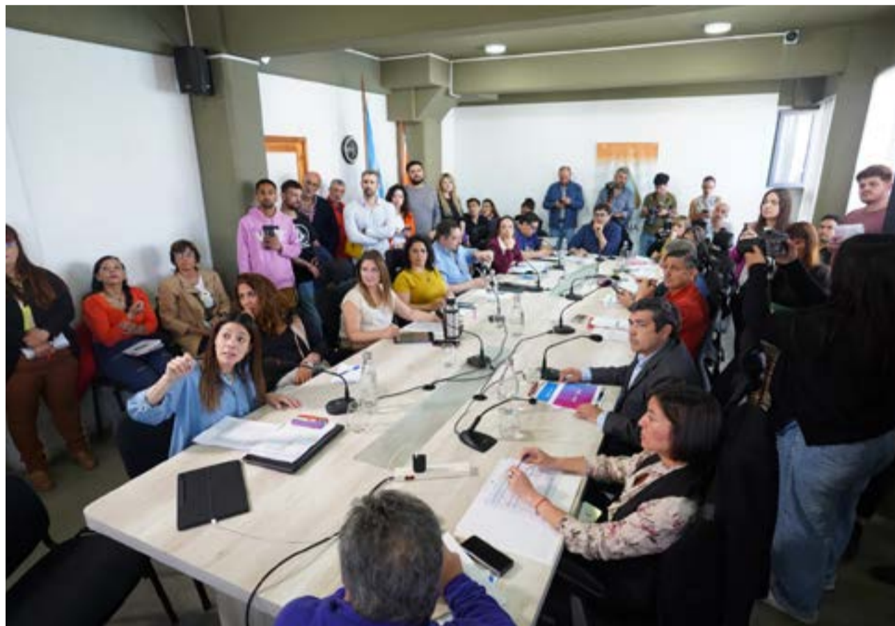
Los funcionarios del Municipio de Ushuaia realizaron una presentación con un presupuesto estimado en poco más de $121.000 millones para el 2025, que fue definido como austero y equilibrado y fue aclarado que se esperan aún los lineamientos definitivos de los presupuestos nacional y provincial para su readecuación.

Adelantó también que habrá un nuevo pañol de indumentaria y protección que se ubicará en la parte superior del Centro Cultural Esther Fadul, se trabaja en el primer centro de salud municipal para atención primaria y consultado sobre el aumento salarial previsto para el 2025 adelantó que tendrá que ver con los recursos que se puedan asegurar.