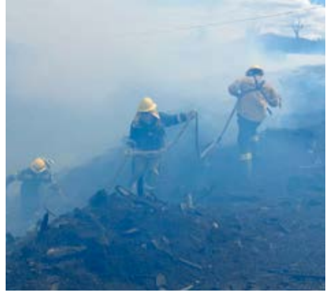
Servidores públicos se abocaron al control y contención de las llamas.