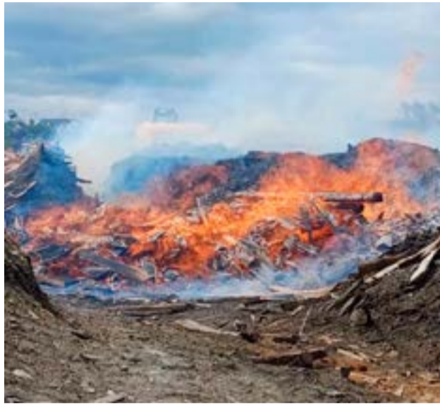
Incendio en el aserradero El Litoral de Tolhuin fue controlado, aunque no extinguido.

Se estimaba que, en un par de horas más podría estar controlado, sin embargo, continuaban trabajando en el lugar.