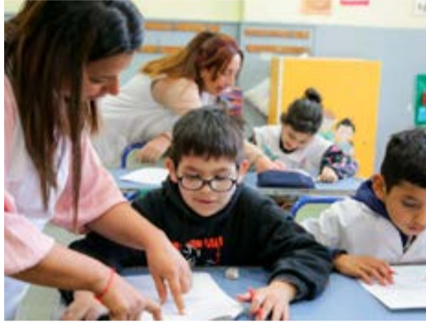
Días atrás, se llevó adelante una reunión técnica con representantes del Ministerio de Educación y el equipo de Convenio Colectivo de Trabajo de SUTEF, para avanzar sobre diferentes temas.

cente señaló un error sobre la fecha que se estableció para el inicio de la Licencia Anual Reglamentaria (LAR). A su turno, el Ministerio de Educación res-