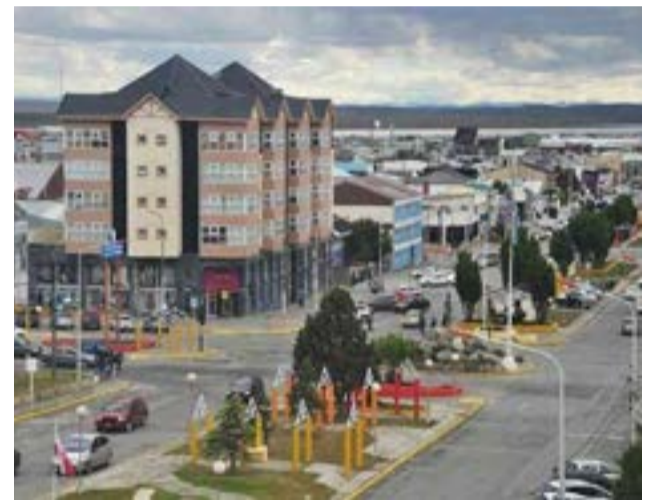
Río Grande registró una desocupación del 8,1% en el tercer trimestre del año.

Para el próximo trimestre podría esperarse otro aumento del desempleo impulsado por la desvinculación de operarios del sector textil, producto de la desafectación de los beneficios de la ley 19640 que impacta negativamente en al menos 5 empresas radicadas en la provincia.