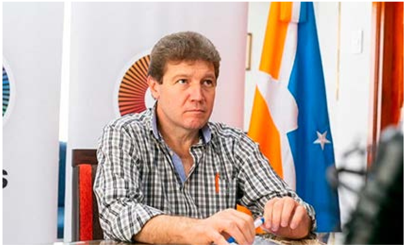
El gobernador Gustavo Melella hizo un balance de gestión y adelantó un 2025 con varias inversiones privadas, que permiten avizorar crecimiento y desarrollo, más allá de la preocupación por la profundización del ajuste nacional.

tiene muy claros los números. Es muy buen economista, pero por sobre todo tiene una mirada humana. Es alguien que mira los números pero detrás de los números ve rostros concretos de vecinos y vecinas. Cuando hay un problema con el subsidio de gas envasado, va y se sienta con los ganaderos, con los comerciantes, con